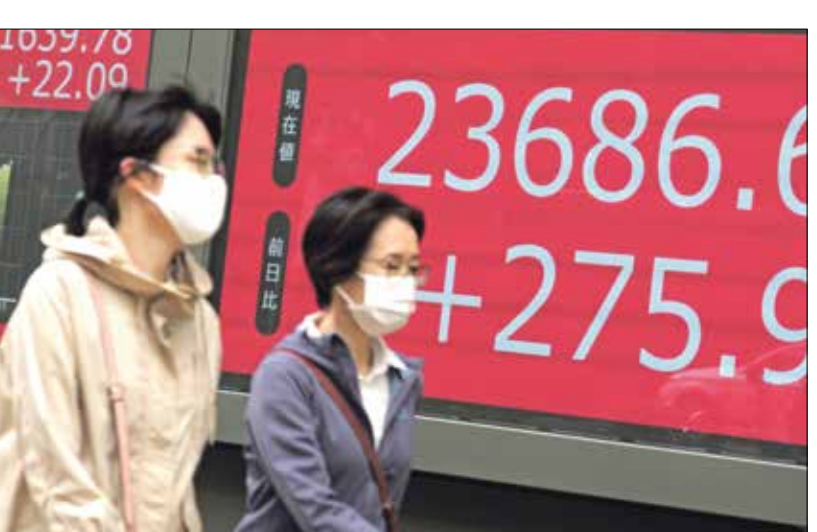
بورصة الاسهم في العاصمة اليابانية طوكيو

حدث الحج الثاني وثالث أكبر اقتصادات العالم، كذلك انصبت اهتمام المضاربين على التداعيات الإيجابية المتوقعة لعقار فايزر، وبيوتيتك على نشاط القطاعات الأخرى تائراً بفيروس جائحة كورونا.