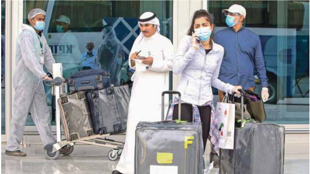
تراجع كبير في حركة الطيران بسبب كورونا

وأضاف المسؤول، الذي رفض ذكر اسمه، أن هناك عدة مقترحات في الوقت الراهن قدمها اتحاد السياحة والسفر