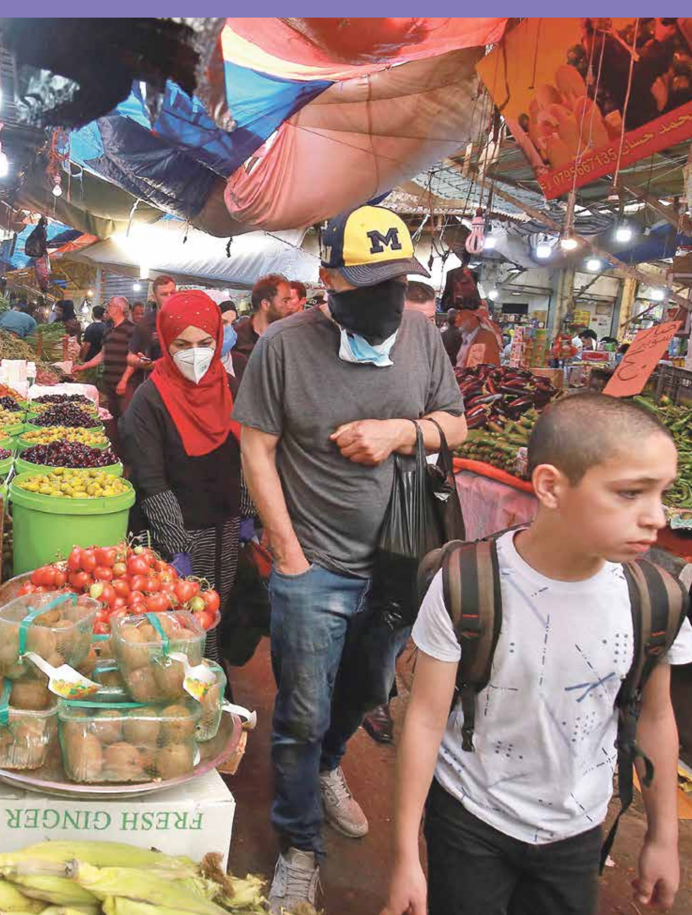
المواطنون يعانون من موجات غلاء متتالية للسلع الضرورية