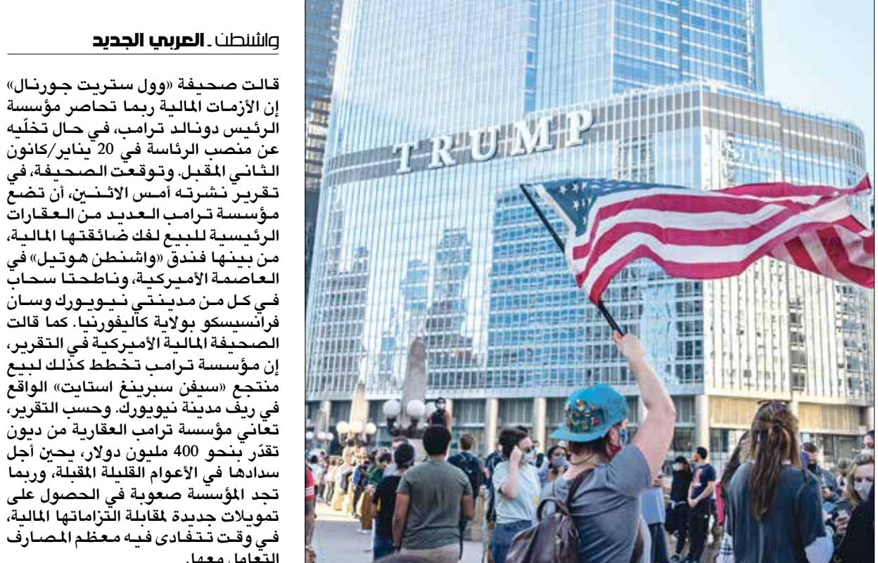
احتجاجات بغور بلدين امام برج ترامب في شيكاغو

ربما يضطر ترامب إلى بيع بعض عقاراته لتسديد التزامات ديون تقدر بنحو 400 مليون دولار