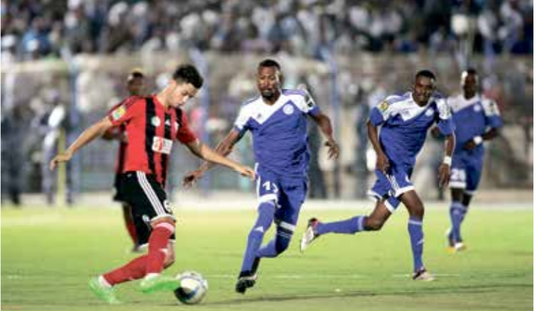
الهالك السوداني في مواجهة غامبيا، اللوبيج

ويستضيف الاتحاد الليبي نظيره كمكعب التنزباري في لقاء سهل لألتحاض، الفائز خارج ملعبه في الذهاب، بثخانية معان عيسى وربع الشاندي، وتشهد البطولة مواجهات عربية أخرى، حيث يحل مقديشو الصومالي، ضيفا على أرضي الرواندي، بعد تعادلهما ضلما في الذهاب، فيما يلتقي نوانديبو الموريتاني، مع إيسا البنيني في ملعب الأول، بعد تعادلهما 1-1 في الذهاب، ولا بدليل أمام نوانديبو، سوى الفوز بآية نتيجة للتأهل، أو التعادل بنتيجة أعلى