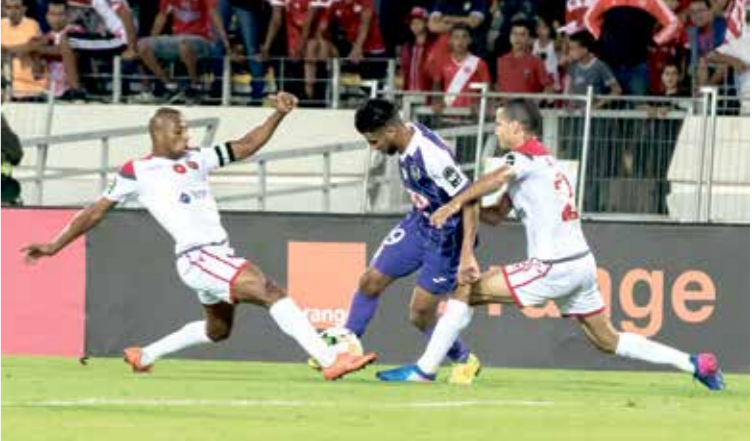
وفاق سطيف يستمتع بالتعويض والتأهل