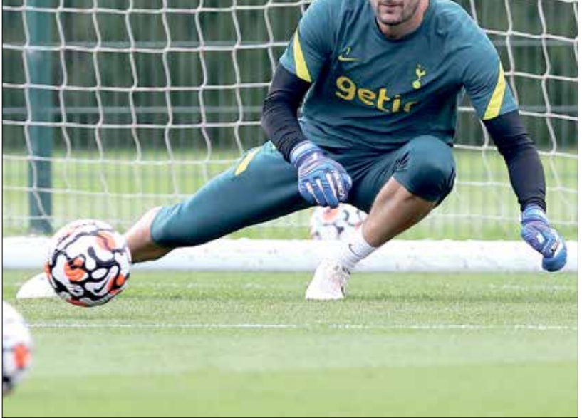
لوريس حصد لقب مونديال 2018 رفقة فرنسا

سيحدد مستقبل الفرنسي هوجو لوريس قريبا بعد مكوثه عشر سنوات مع فريق توتنهام مع عائق جديد أمام مسيرته، وهو حارس مرمى منتخب بلاده، فقد يتخذ مستقبل حاريس مرماه الفرنسي هوجو لوريس قريبا، بعد مكوثه نحو عشر سنوات مع فريقه توتنهام، في حراسة مرمى حاريس مرمي منتخب فرنسا بطل العالم، «سبيرز»، ويعمر الرابعة والثلاثين، لا يزال حاريس مرمي منتخب فرنسا بطل العالم، يقدم مستوى مرموقا ولا مؤشرات حول تراجعها في وقت قريب، ويقول الأمريكي براء فريدل الذي سبقه في حراسة مرمى توتنهام: «بإتة رابع، أمل أن يحافظ على صحة جيدة كي لا يضطر توتنهام للبحث عن حارس آخر في غضون أربع أو خمس سنوات وسنوات»، لكن قبل أشهر من انتهاء عقده في حزيران/ يونيو 2022، تاخرت مفاوضات التعديد، في وقت أشار قدوم الحارس الإيطالي يمار لويجي غوليني سعارا من أتالانتا النكتهات، وأصبح لوريس ثاني أقدم لاعب في توتنهام بعد كاين، أخيرا، أكثر لاعب خوضا للمباريات