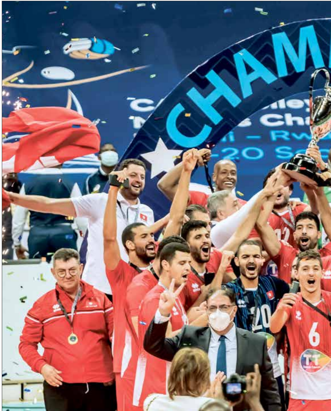
منتخب مصر لم يخسر شوطاً واحداً في مباريات البطولة (هائل الشيب) (سراويل أطول قليلاً) (نورس الأضواء)

وقال صاحب 20 عاماً في تصريحات تلفزيونية بعد اللقاء: «اعتدت الظهور بشكل جيد في كل المباريات التي شاركت فيها في دوري أبطال أوروبا، وساهمت في شيء، جيد لفرقتي، أنا سعيد للغاية لأنني أسعد دائماً بتسجيل الأهداف في دوري الأبطال»، وأضاف رودريغو: «كنا ندرك أن المباراة ستكون صعبة للغاية، وجدنا صعوبات كبيرة على مدار المباراة، والمناس كان أفضل في الشوط الأول، ولكننا فرضنا سيطرتنا بشكل أكبر في الشوط الثاني، الانتصار هنا مهم للغاية، والمباريات صعبة جداً، وعلينا أن نلعب بتركيز كبير».