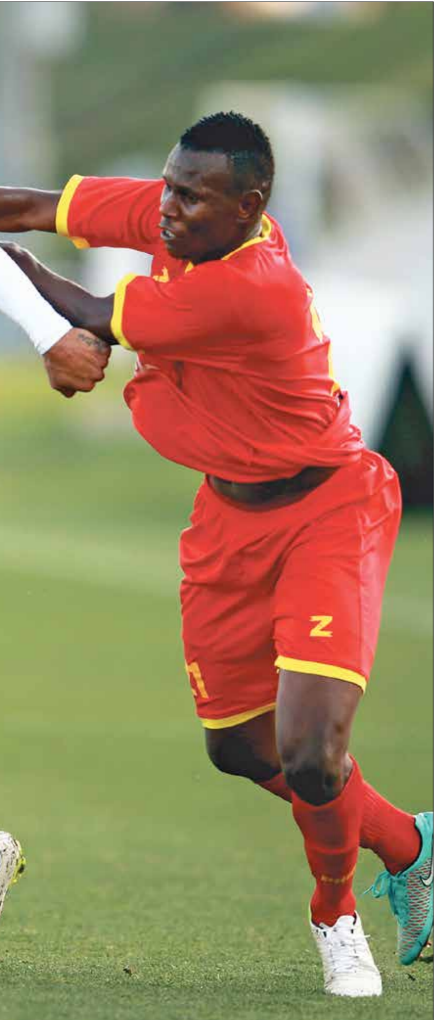
المرشح بحث عن المزمور على إكسبرس الوغدفي الأكس جريم/Getty)

من الذهاب، كما يحل ارتا سيد الجيبوتي، ضيفا على توسكر الكيني، وهو يسعى للفوز بآية نتيجة أو التعادل بهدف لكل فريق من أجل العبور للدور المقبل للبطولة، بعد تعادله على أرضه بهدف لكل فريق. وتشهد مسابقة أول الأبطال، مواجهات أخرى، حيث يلتقي الشرطة بطل مالawi مع أمازولو الجنوب أفريقي، وأولو الكونغولي مع يونياو الموزمبيقي، ويستضيف زسكو الرامي نظيره روبال بطل إسواتيني، ويحل صاغرادا الأنغولي ضيفا على بلاتينيوم الريمبابوي، ويلتقي مانجما الكونغولي مع بونفويدي الغامبوني، ويواجه الملعب