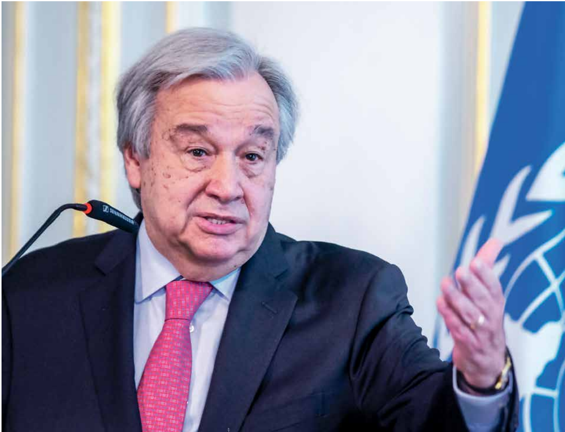
غوتيريس، وهم منه يفكر بحدوثنا على حل مشكلات أفغانستان

لكل القوات والأموال. حل المشكلات التي لم يتمكنوا من حلها خلال عقدين فهو وهم». وأعلن غوتيريس أن الأمم المتحدة ستقبل شكوى طالبان بتشكيل حكومة أكثر شمولاً مما كانت عليه قبل 20 عاماً، لكنه أشار إلى أن الأمم المتحدة ليس لديها قدرة على موقعها كمظلمة دولية موجودة هناك لدعم الشعب الأفغاني». وقال: «لا ننتظرو المساعدة حتى قبل سيطرة الحركة على كابل. ومن المتوقع أن يزيد ذلك العدد فيما يبدو بسبب الخسائر ونقص السلع الأساسية، فيما حذر برنامج الأغذية العالمي