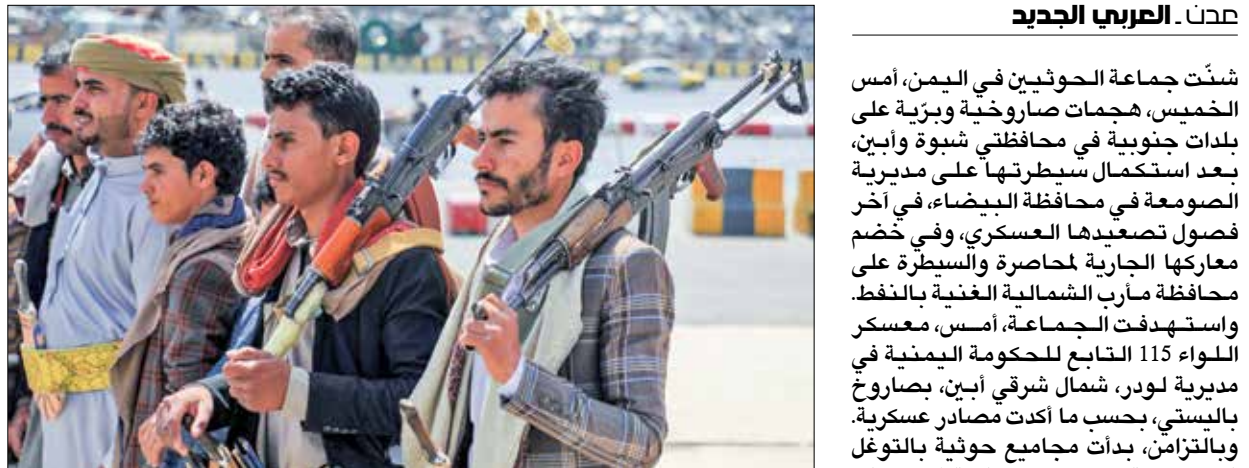
يهدد الحوثيون منابع النفط والغاز في شبوة

عدداً من مديرية الصومعة بالبعضاء، بعد معارك عنيفة مع الوية سلفية وقوات حومية، أسفرت عن أكثر من 50 قتيلًا، وفقًا لخصار عسكرية وسيطرة الجماعة، أول من أمس، على مركز المدربين، آخر معازل القوات الحكومية في البعضاء، وأكد مصدر حكومي لكاتبه «الأضول». إنّ تقدم الحوثيين جاء بسبب قلة الدعم والإسناد الذي يبغاني منه الجيش الوطني». وبدأت الخصال فيما يقوم المبعوث الأممي الكبير من جبهة شقرة بإتجاه الحدود الإيرانية الرابطة بين أبين والبعضاء، بهدف التصدي لوقوات عسكرية جديدة ضمن جيش شوبة بقبوات عسكرية جديدة ضمن جيشان. وكانت جماعة الحوثيين قد حققت مكاسب