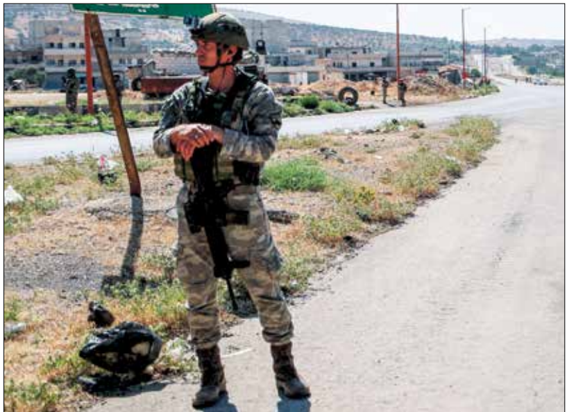
جندي تركي على طريق «أم 4»

وذكرت صحيفة «الوطن» التابعة للنظام، أمس الخميس، أن قوات الأخير استكملت