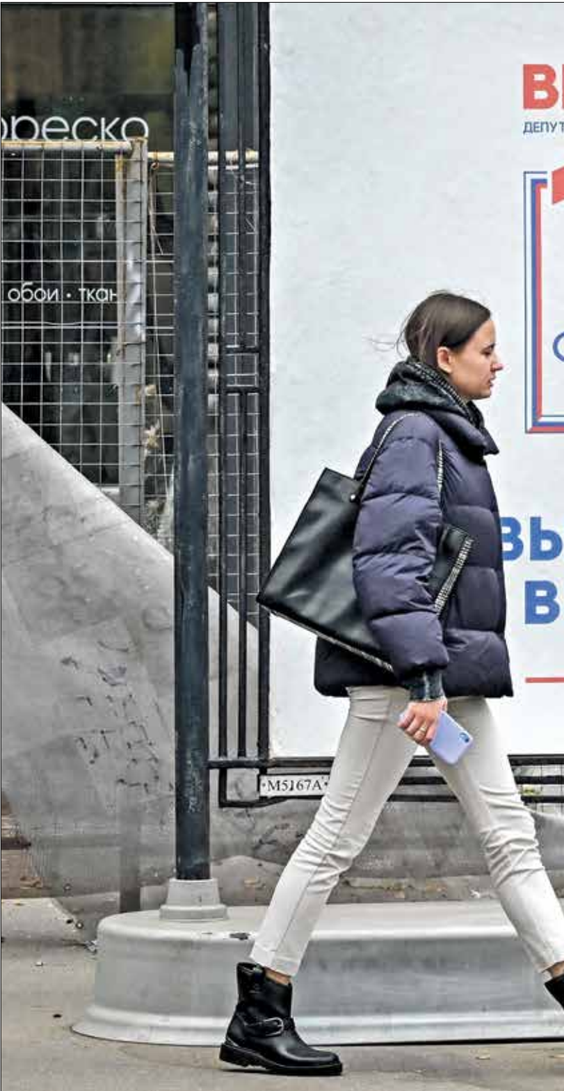
لجنة الانتخابات على مدى ثلاثة أيام

المتعلق بمناهضة التطرف «حيز التنفيذ، وتصنيف منظمة نافالني منطرفة، أدى إلى حرمان مئات الآلاف من المواطنين الناشطين سياسيا من المشاركة في الانتخابات، وقد يتعرضون للاستهداف في المستقبل القريب»، وتشير منظمة غلوبوس هنا إلى قانون وضعه بوتين في 4 يونيو لانتخابية يحظر على الأشخاص الموقوفين في أنشطة المنظمات المنطرفة المشاركة في الانتخابات على أي مستوى.