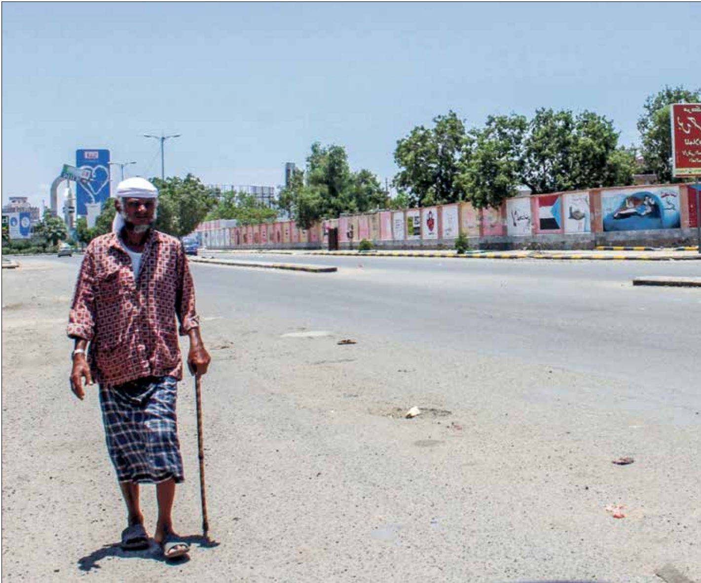
تعزف عدن بالزمام ملد سوات

استنفدت الحكومة اليمنية والانصاليون كافة الإسلحة في معركة قصف العظالم الدارة بينهما منذ مطلع العام الحالي، وبعد