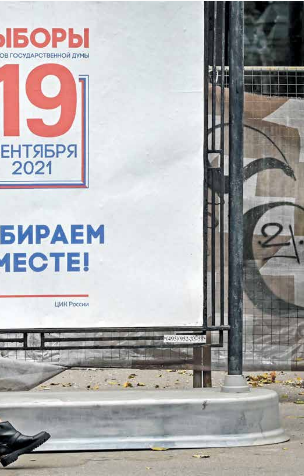
لجنة الانتخابات على مدى ثلاثة أيام

وفي السياق، قالت منظمة «غولوس» الروسية المستقلة لمراقبة الانتخابات، في تقرير، في 22 يونيو/حزيران الماضي، إن القيود القانونية التي فرضتها الحكومة في الفترة الأخيرة، حرمت ما لا يقل عن 9 ملايين روسي، أي حوالي 8 في المائة من السكان المؤهلين من حقهم في الترشح للانتخابات البرلمانية وأضافت أن دخول القانون الجديد