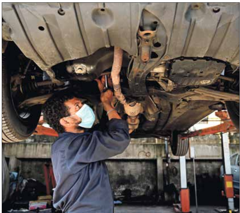
تأكد من أن تكون عملية تركيب قطع الغيار الجديدة صحيحة