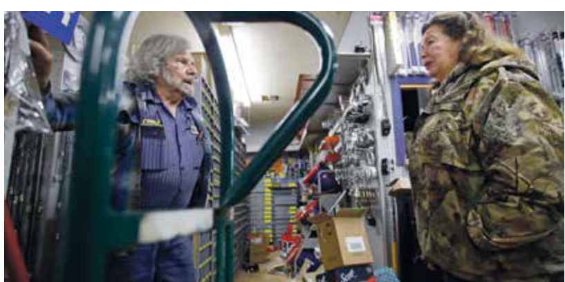
والعديد من القطع الأخرى

والمعروفين بإنتاج قطع الغيار والملحقات عالية الجودة. وابتحث عن المكونات التي تم تصميمها لتحقيق المتانة والأداء والموثوقية. وسواء كنت تقوم بترقية نظام التعليق الخاص بك، أو إضافة عجلات، أو تركيب نظام عام عالي الأداء، أعط الأولوية للجودة على السعر لضمان أن ترقية سيارتك تحقق النتائج المرجوة وتصمد أمام اختبار الزمن. فالاستثمار في قطع الغيار والملحقات عالية الجودة سيؤتي ثماره على المدى الطويل، بما يوفر لك الوقت والمال والصداع في المستقبل.