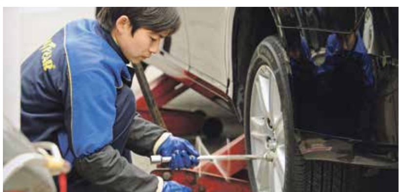
قد تشمل الترقية تغيير طقم الإطارات

تتميز السيدان الجديدة من مرسيدس، AMG 53 (4Matic) بإجمالي قوة يصل إلى ما يزيد عن 600 حصان. وتشمل مجموعة الحركة الهجينة محركاً سداسي الأسطوانات سعة 3.0 لترات مع شاحن توربو (443 حصاناً)، ومحرك كهربائي واحد. ليولد النظام 577 حصاناً بالكامل، أو 603 حصاناً عند تفعيل وضع التسابق Race Start الاختيارية. إضافة إلى 750 نيوتن متر من عزم الدوران. وتُشير هذه الأرقام إلى تفوق هذا الطراز بإنتاج قوة أكبر من الجيل السابق من S AMG E63. ويقترن المحركان مع ناقل سرعات أوتوماتيكي من 9 سرعات، مما يُساعد في التسارع من حالة السكون صفر إلى 100 كم/س خلال 3.8 ثوان فقط عند وضعية التسابق، و4 ثوانٍ بدونها.