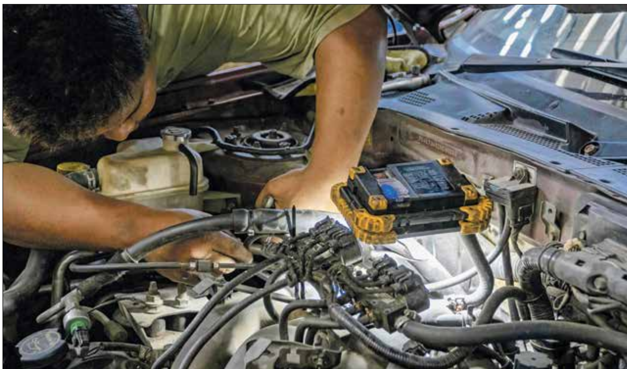
سلم سيارتك إلى ميكانيك محترف حتى لو كانت فاتورته اعلنى من غيره لضمان جودة العمل