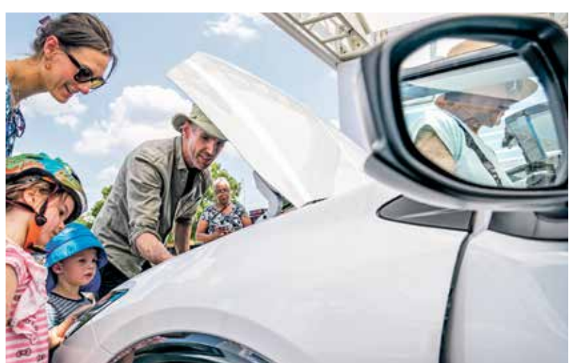
تجاوز دور التكنولوجيا في المركبات من الرفاه إلى الضرورة

الاداء والمساحة والتكنولوجيا وكفاءة الوقود عوامل حاسمة