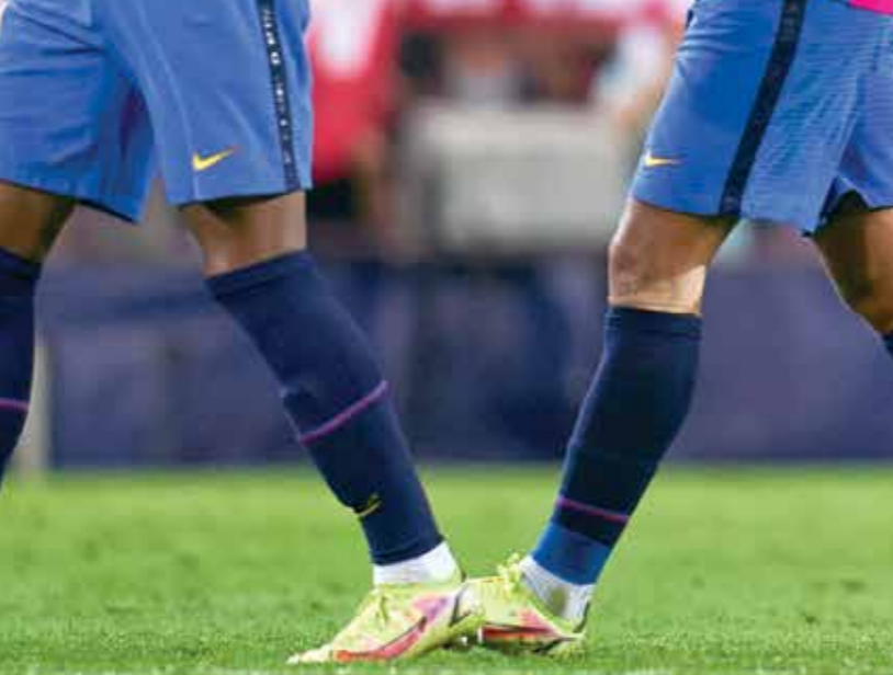
نوعية اللعب في فريق برشلونة لا تنعم الألقاب

على أرض إفساح المجال أمام الاستسلام الموسم يحتاج كارثية لا تليق بفريق يصعد برشلونة.