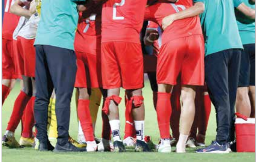
يبحث الدحيل، عن فوز مهم لاستمرار في السطح الجيدة

يسعى فريق الدحيل والعربي مساء الخميس للمحافظة على البداية القوية في بطولة الدوري القطري، في وقت سيحاول السد تحقيق انتصار جديد