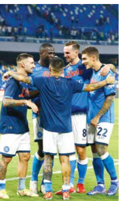
نابولي يدار رحلته الأوروبية بمواجهة صعبة ضد لستر سيتي الكليلزي

أما المجموعة الثانية فتشهد قمة قوية بين إنذرفون الهولندي ومناقسه ريال سوسيداد أحد أفضل الأندية الإسبانية. وفي وقت ستكون المباراة في ملعب الفريق الهولندي إلا أن سوسيداد قادر على تقديم مستوى طيب وتحطى منافسه وتحقيق أول انتصار في البطولة. وفي إطار نفس