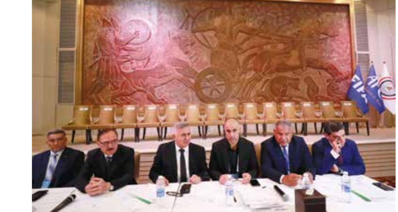
الهيئة التنفيذية تواجذت في انتخابات الاتحاد العراقي الأحد الربيصفر