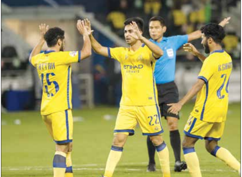
سعاد لاعبي النصر بالوصول إلى ربع نهائي البطال

وأضاف الفريق الياباني الهدف الرابع بواسطة تاكاتاني الذي تابع الكرة براسه على القائم القريب إثر ركلة ركنية (79) وفي مباراة أخرى ضمن منطقة الغرب، سجل هدفي ترابي هدفا قاتلاً في الدقيقة الـ 90 ليفوز فريق برسيبوليس الإيراني على الفوز على استقلال دوشانبي الطاجيكي في مقر داره 1-صفر. والتأهل إلى دور الثمانية. وفيما كانت المباراة متجهة نحو التعدي، تمكن ترابي من إحراز رابع من هز الشباك وقيادة وصيف حطل نسخة 2020 الدولي ربع النهائي للمرة الرابعة في خمسة مواسم. وأنهى هذا المغامرة المشوقة للفريق الطاجيكي بمشاركتة الأولى في المسابقة القارية.