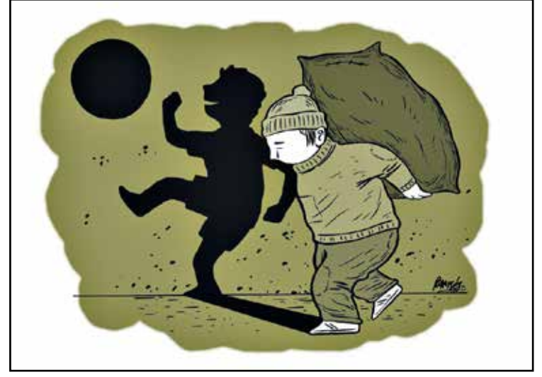
بؤس طفله يعمل وحلمه ان يلعب (رمسيس ازكوردو/كار تون موفمنت)