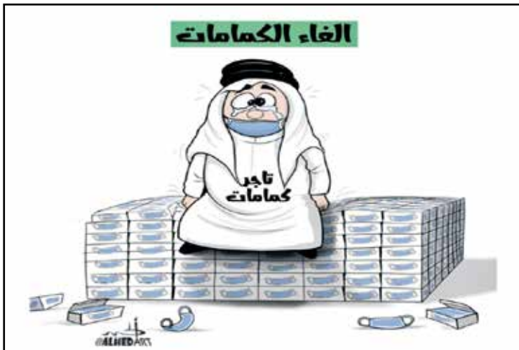
تجار الكمامات بعد إغائها في السعودية