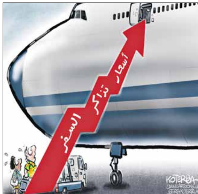
جيف كتيرا/ كيفل كار تونز