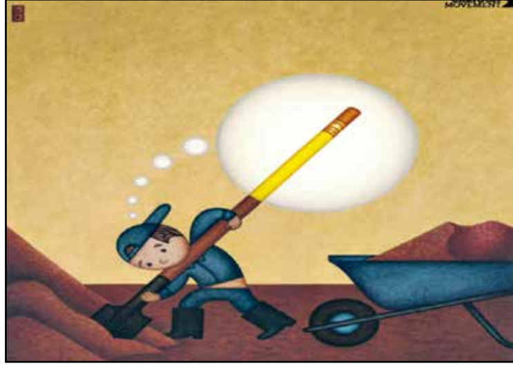
مجرفة الرمال بيد الطفل بدل القلم

ومع تفاقم ظواهر الأوبئة الجديدة واختلاطها، أصيب المواطنون العرب بالذعر، وأصبحوا يخشون لمس النقود وتداولها، على الرغم من ندرتها أصلًا بين أيديهم، حتى جاء الخلاص من قبل الأنظمة الحاكمة نفسها، بوصفها مسؤولة عن «صحة» المواطنين أولًا، ولأنها «تشفق» على شعوبها ثانيًا. اقترحت الأنظمة حلًا باهرًا جاء فيه: «يؤسفنا إبلاغكم بأن وباء النقود حقيقي، ونو نبعثات صحية خطيرة للغاية، وحرصًا منا على سلامتكم من هذا الوباء الخطير، نرجو منكم سرعة إيداع ما بحوزتكم إلى رقم الحساب أدناه، إلى حين إيجاد علاج لهذا الوباء اللعين، والله يحفظكم من كل سوء». وعقب مرور سنوات، ولدى مراجعة المواطنين العرب، اكتشفوا أن حساب «النقود» طار كالقروء.