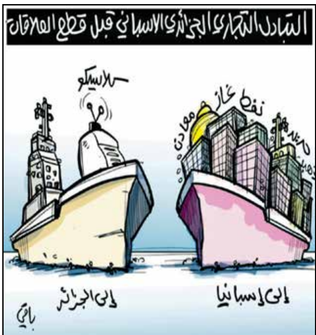
العلاقات الجزائرية - الإسبانية