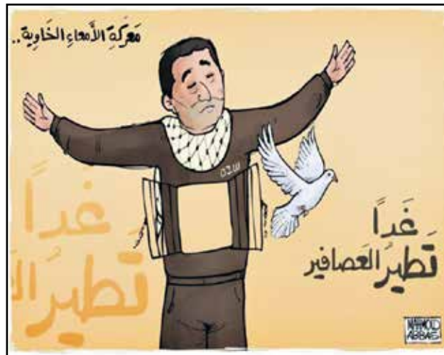
وتستمر معركة الامعاء الخاوية