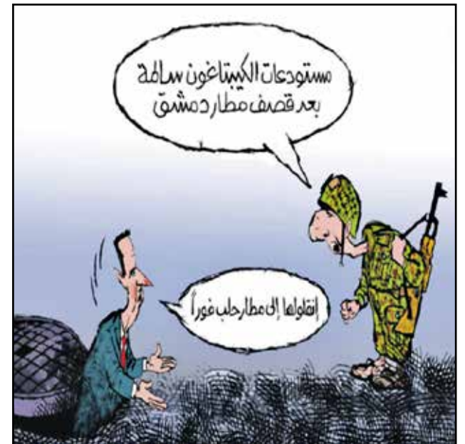
النظام السوري بعد مطار دمشق (تلفزيون سوريا)