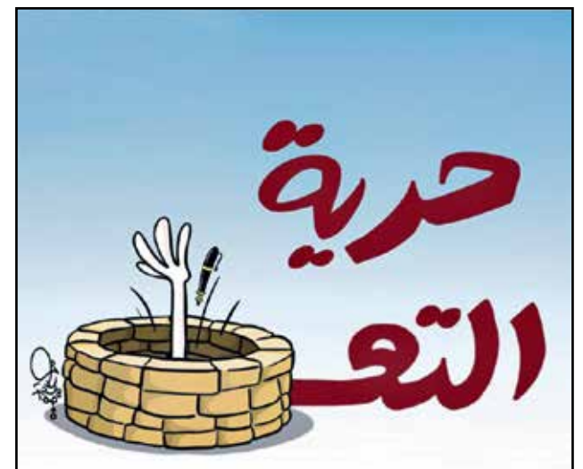
حرية التعبير في العراق (سوليف هالوكوت/ تويتر)