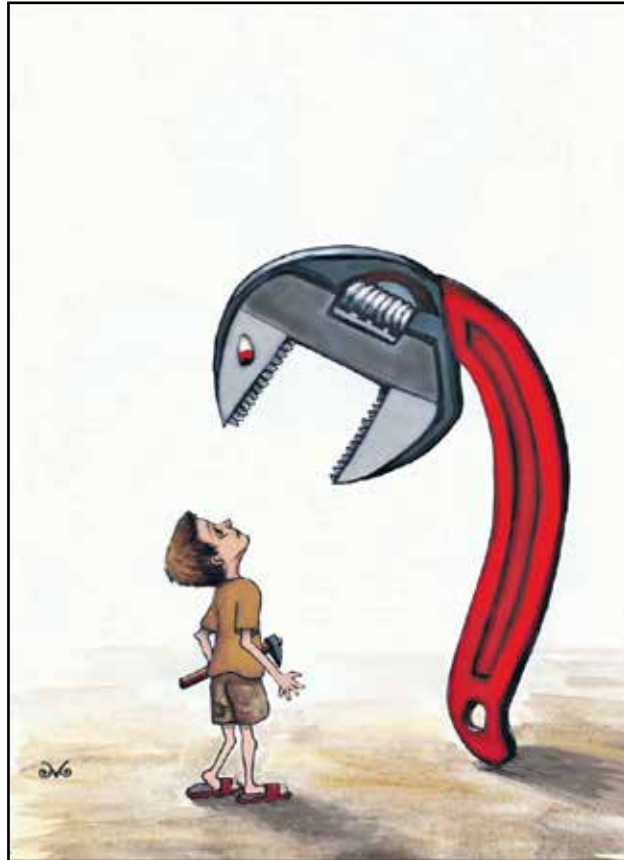
ادوات المصانع تلهم الطفولة