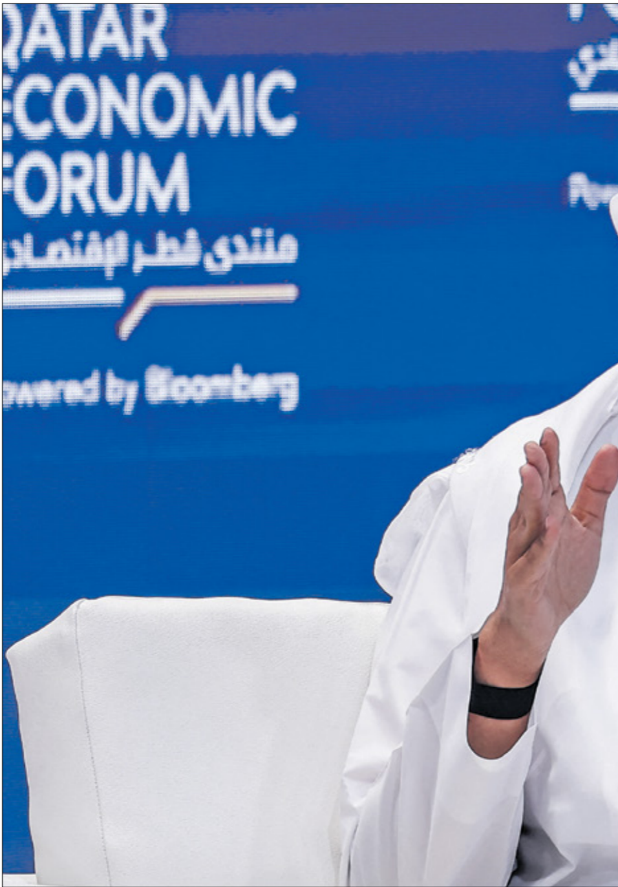
رئيس الوزراء القطري حلال ملاحه قطر الاقتصادي أمس

وجسر الهوة، وإيجاد طرق مبتكرة للتوصل إلى اتفاق بين الطرفين ولغت الانصاري في المؤتمر الصحافي الأسبوعي أمس الثلاثاء إلى وجود هوة كبيرة بين الطرفين، قائلا: «ستمرون في جهودنا من الأشقاء بالمنطقة واصدقاننا في الولايات المتحدة في محاولة تحريك أجداه الرائدة بالوساطة» لكنه لم يحدد موعدًا لاستئنافها، وأضاف: «ولفة قطر تتعامل بطريقة جيدة في جهود الانصاري المجتمع الدولي إلى الصعا للتوصل إلى وقف الحرب التي يجب الا تستمر، وكرر التأكيد أن بلاده لا يمكن أن