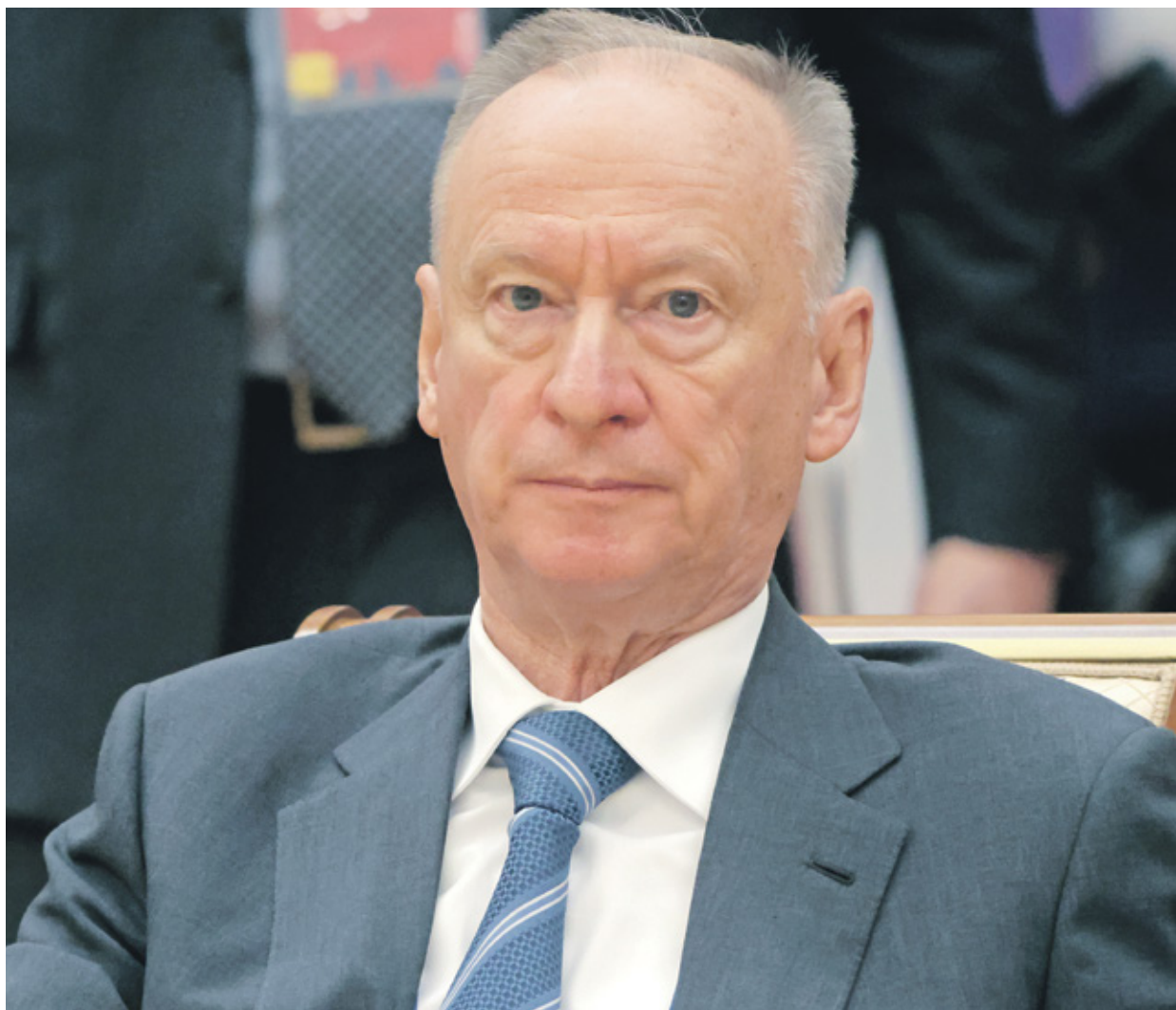
بالرشوف في قمة قادة دول الاتحاد السوفييتي السابق في بيلاروسيا، نوفمبر الماضي

رئيس الوزراء في عهد الرئيس الراحل، بورييس يلتسين، كما شغل منصب مدير عام مؤسسة روس أتوم، المعنية بقطاع الطاقة النووية. كذلك ميدينسكي من أنصار أيدولوجيا توسع «العالم الروسي»، وبرز اسمه دولياً في نهاية فبراير/شباط 2022،