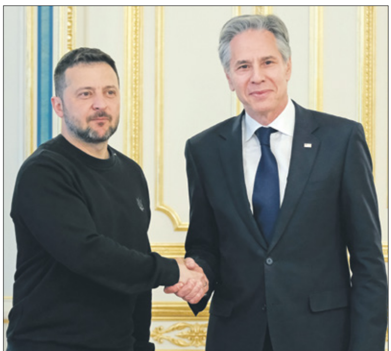
بليكن وزيلينسكي في كيف، أمس

قال المستشار الألماني أولاف شولتز، أمس الثلاثاء، إنه من غير المرجح أن تضع قمة السلام الأوكرانية التي تستضيفها سويسرا الشهر المقبل حداً للصراع في أوكرانيا، وأوضح لمجلة الشيرن الألمانية أنه «صعب أحسن الاحوال، فهي بداية عملية يمكن أن تؤدي إلى محادثات مباشرة بين أوكرانيا وروسيا»، مضيفاً أن القمة ستناقش «سلامة محطات الطاقة النووية وصادرات الحبوب وتبادل الأسرار» والتصعيد النووي.