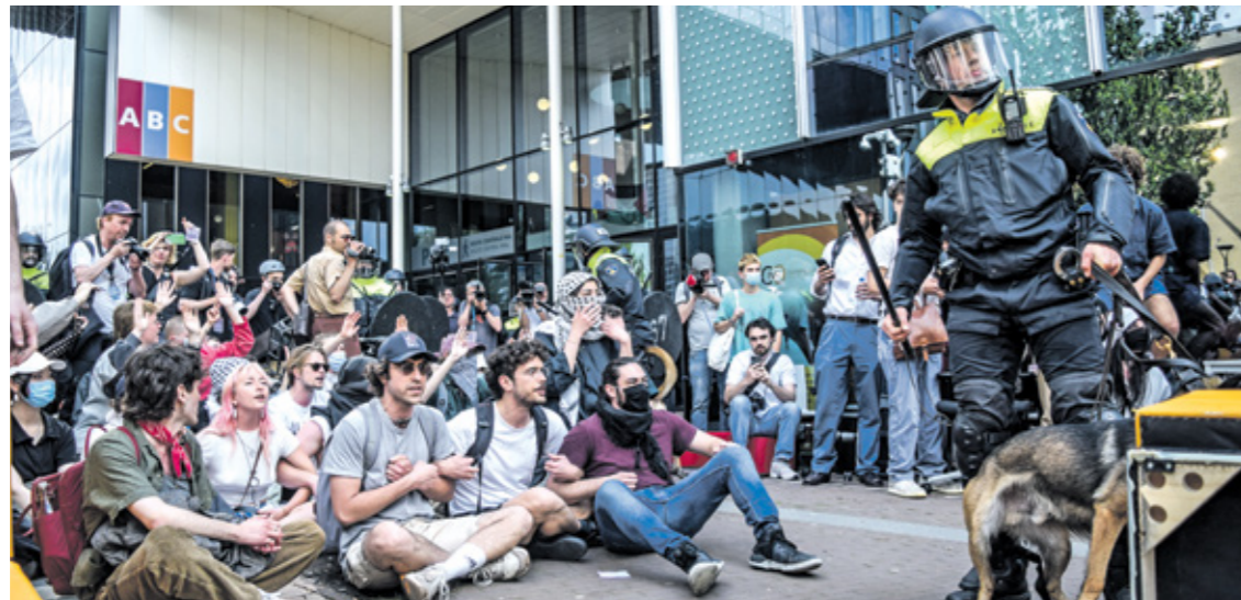
من لحظة الشرطة في جامعة امستردام، اول من أمس (فيديو هاتجيب بالانجليزي)