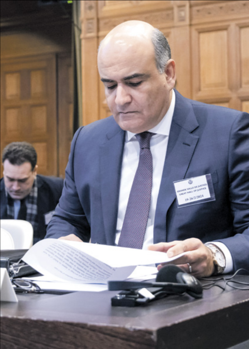
السفير المصري في هولندا حاتم مكة العتيباجلسة المحكمة فبراير أوكوسيونجوكه (اليمين)

كان يمكن أن تحسم الموقف لصالح المسألة الديمقراطية، دفع ذلك الجزء، الغالب من شباب الحراك خصوصا إلى الاستقالة تقييدًا وبالعودة إلى مربع الصمت. تقع على القوى والشخصيات السياسية المنتزمة بالسلطة الديمقراطية والجمالية في مرجعياتها وأيدياتها لمطلب التغيير والإصلاح، مسؤولية إحياء الأمل السياسي لدى هذا المجتمع المعطل بالإنزيمات. إن ذلك يمثل الانتخبات الرئاسية فرصة لإعادة الصوت الديمقراطي للمسك بالعقد السياسي الوطني وبقياسها الحريات وقيم العدالة المستقلة. ليس هناك خلاف على أن الانتخبات الرئاسية المتزمتين استميل موضوعية وسياسية وأخرى ترتبط بطبيعة البيئة الانتخابية والقواعد التي تحكمها في الجزائر، مضافة إليها موضوعية وسياسية وأخرى ترتبط هذه المرة ظروف خاصة بالجزائر محليا وإقليميا. لا تشجع الكثير من الفواعل السياسية على خلق خط مناسف لتون. لكن ذلك ليس مانعًا للقوى السياسية المنتزمة بالسلطة الديمقراطية. من جعل الاستحقاق الرئاسي مناسبة لتجديد الطليعة الديمقراطية بكل أبعادها وقد تحررت من قيود الأيديولوجيا المغلفة وأعيدت قراءة الحالة الجزائرية من منظور مختلف.