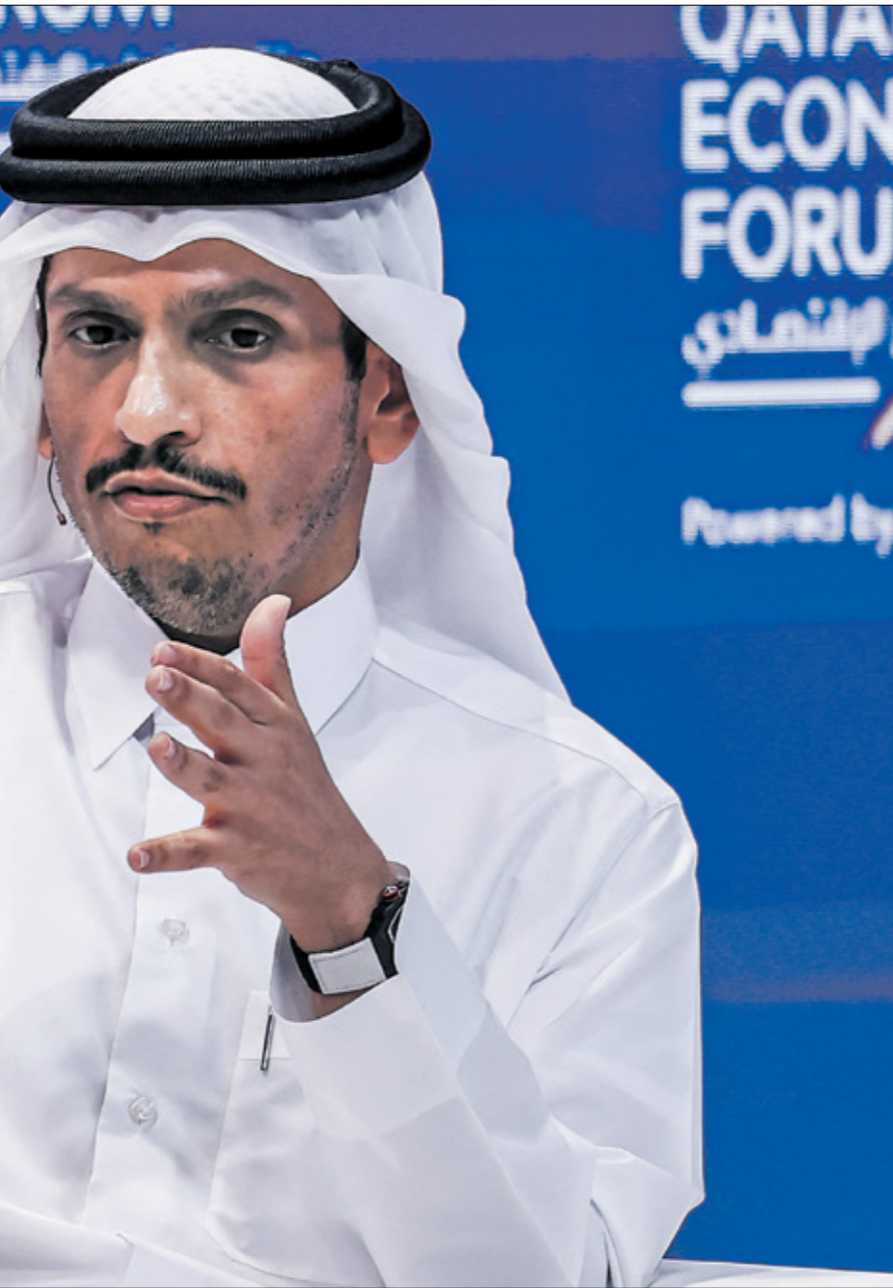
رئيس الوزراء القطري حلال ملاحه قطر الاقتصادي أمس

تقبل بأن سُتغل سياسيا في إطار الوساطة التي تقوم بها، متهمًا الطرف الإسرائيلي بقولهم أن يسميه بأنه لا يريد إيقاف الحرب، ودان الانصاري الاعتداء الإسرائيلي على قوالم المساعدات الإنسانية المرسله إلى غزة، ولفت إلى أن المساعدات الإنسانية لم تصل إلى قطاع غزة منذ 9 مايو/ أيار الحالي، مع بدء الاعتداء الإسرائيلي على معبر رفح، مضيفا أن إسرائيل تضرب عرض الحائط بقوانين حقوق الإنسان من خلال منع دخول المساعدات إلى قطاع غزة، ولغت الانصاري الاعتداءات المستوطنين الإسرائيلييين في الضفة الغربية تدل على عدم جدية الطرف الإسرائيلي في التوصل إلى سلام، وقال إن أي تشريع للعنف لا يخدم إلا من يريد إطالة أمد الصراع في غزة.