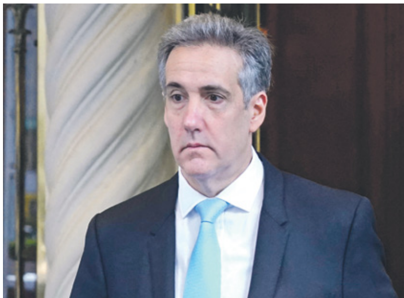
كوهين مغادراً منزله إلى المحكمة، أمس