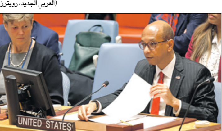
دود حلاله جلسة المجلس اول من أمس (ماتكلم بالانجليزي)

دعت الولايات المتحدة، أول من أمس الإثنين، إيران، إلى وقف نقل «كميات غير مسبوقه» من الأسلحة إلى جماعة الحوثيين في اليمن، ما يسمح للجماعة بتنفيذ «هجمات متطورة»، على سفن في البحر الأحمر و أمكن أخرى. وجاء الكلام الأميركي على لسان روبرت وود، نائب المندوبية الأميركية في الأمم المتحدة لبندا توماس غرينفيلد، خلال جلسة مجلس الأمن ناقشت الوضع في اليمن، على ضوء تطورات التصعيد الحوثي لغزة. وقال وود، إنه «إذا كان مجلس الأمن يريد إحراز تقدم نحو إنهاء حرب اليمن، فيجب عليه العمل بشكل جماعي لمحاولة إيران بالتوقف عن دورها المزعزع للاستقرار، وإبلاغها أنها لن تستطيع الاختباء وراء الحوثيين». من جهته، قال المبعوث الأممي إلى اليمن، هامس غوردنرغ، من أن «الأعمال العدائية مستمرة رغم انخفاض وتيرة الهجمات (الحوثية) على السفن التجارية والعسكرية في البحر الأحمر وخليج عدن والمحيط الهندي»، معتبرا أن إعلان الحوثيين زعمهم توسيع نطاق الهجمات، بشكل «استفزازًا مقلقا»، كما أكد أن الحاجة الملحة لعلاج الأوضاع المعيشية المتدهورة لليمنيين وإحراز تقدم نحو تامين اتفاق لخرطة طريق بما يهني الحرب. مبدئيًا، أعلن الجيش الأميركي، أمس، تدمير سفينة للحوثيين في اليمن، وصاروخ باليستي مضاد للسفن أطلق في اليمن فوق البحر الأحمر.