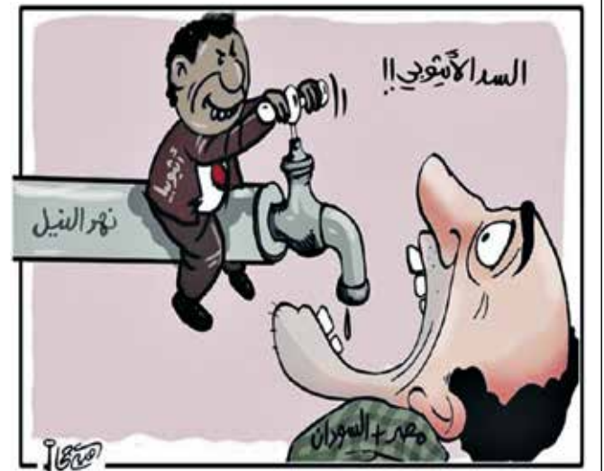
السد الأثيوبي والعطش القادم للسودان ومصر (القدس العربي)