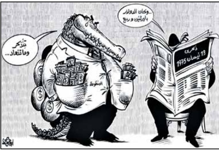
ذكرت الحرب الأهلية اللبنانية في ظل الأزمة المالية