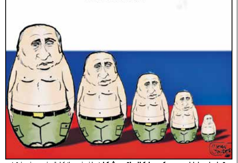
بوتين ينسخ نفسه ويكرها كالماثريوشكا (جان غودا/كار تون موفمنت)