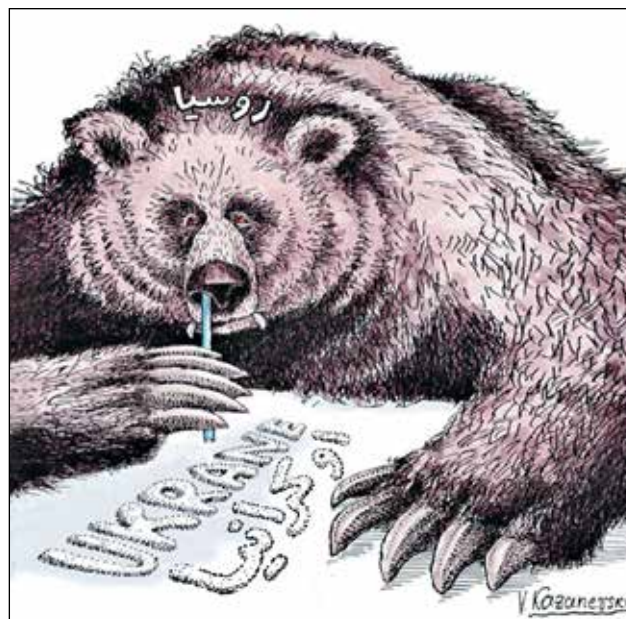
فلاديمير كازانفسكي/كيفل كار تونز