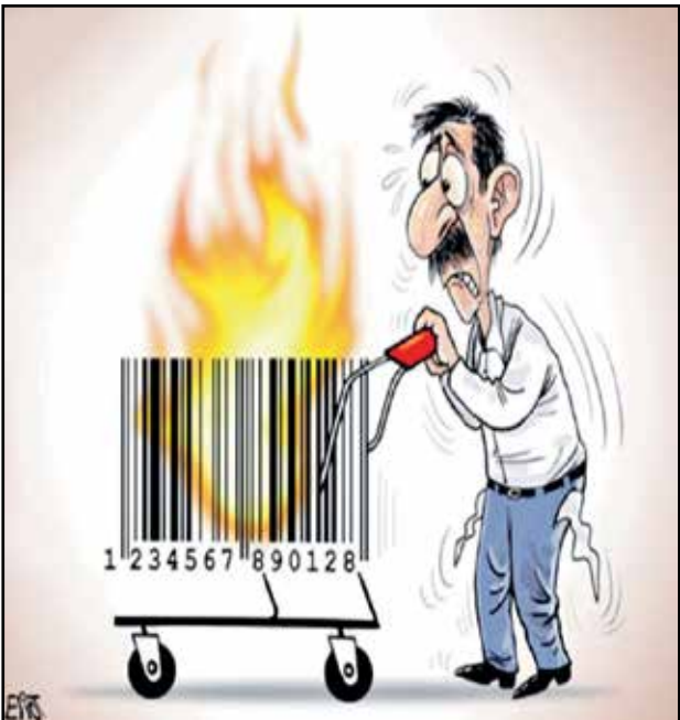
نار الاسعار المشتعلة مع قدوم شهر رمضان (الوطن القطرية)