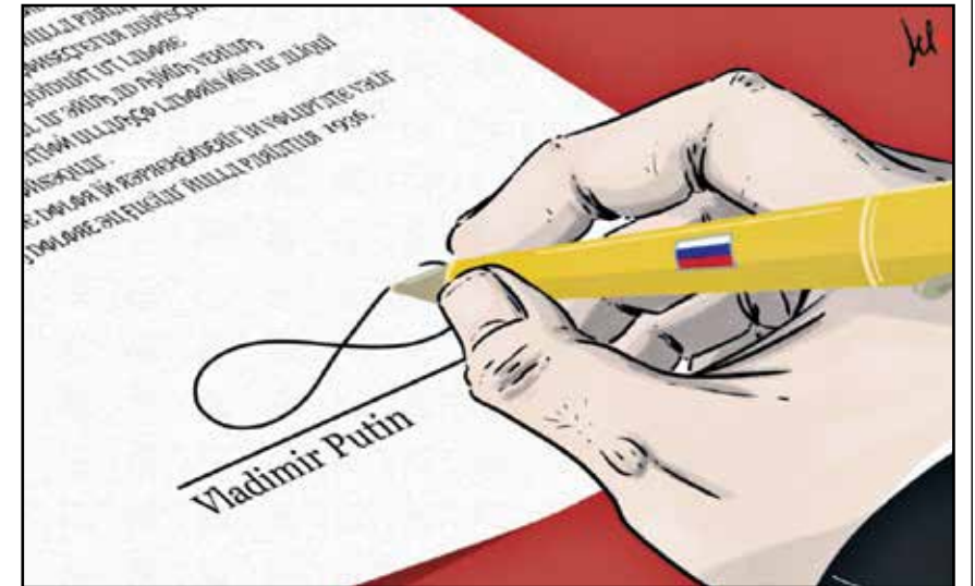
بوتين يوقع بوقع بشارة الانهيار ببقائه في السلطة (إيمانويل ديك روسو/كار تون موفمنت)