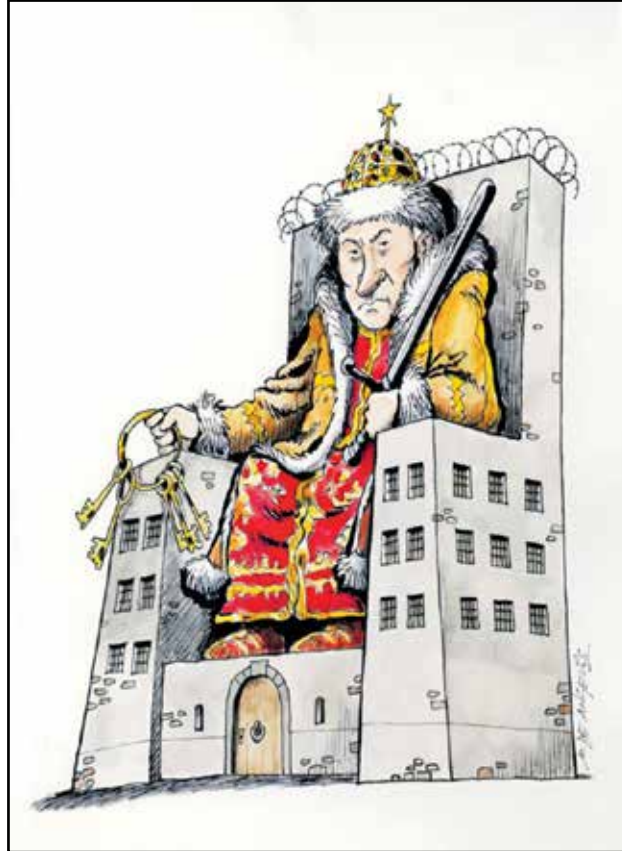
عرشه سجن كبير (ماركو دي أنجلس/كار تون موفمنت)

أعلنت الحكومة الروسية أخيراً قانوناً موقفاً من الرئيس فلاديمير بوتين يتيح له البقاء رئيساً لولايتين إضافيتين يستمر كل منهما ست سنوات، مانحاً لنفسه بذلك إمكانية البقاء في السلطة حتى عام 2036، ومتوجاً نفسه قيصراً أبدياً لروسيا، وهذا الحدث لم يفوته الرسامون الساخرون حيث جسّد العديد منهم شخصية بوتين كحاكم متسلط شمولي يفضل القوانين على هواه.