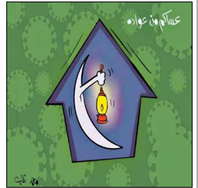
رمضان في زمن الحجر الكوروني