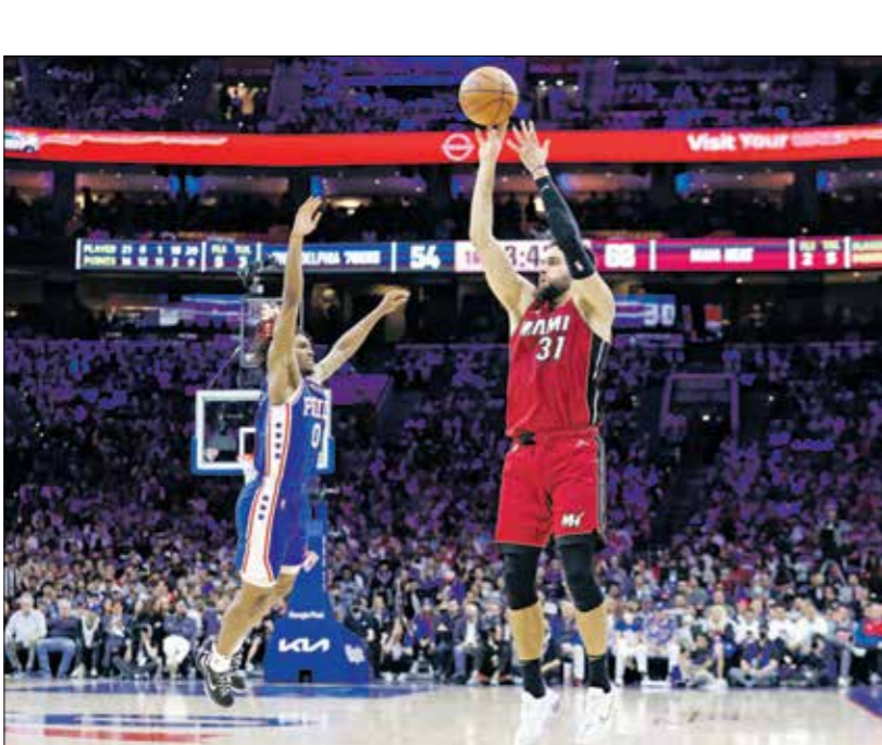
يصنع ميامي هيت هبوطه إلى النهائي الكبير والمنافسة على اللقب

وعلى ملعب «أميركان إيرلاندز سنتر» في دالاس، فرض مافريكس التعادل على صنز الذي لم يجد طريق الفوز في مباراة