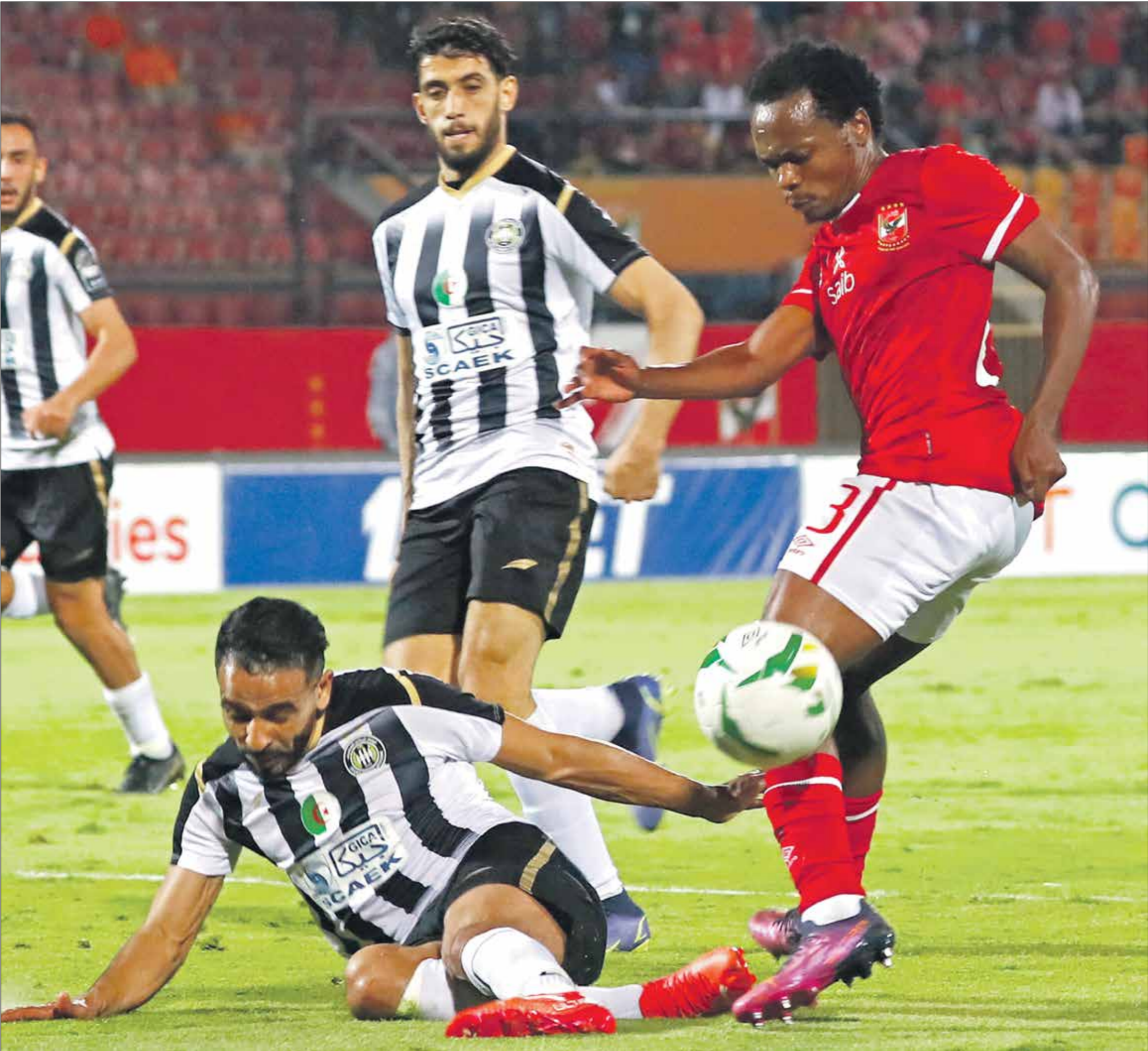
مواجهة ملحددة بين سطيف والأهلي (تحت حوسبة)فرانس برس

في الفوز بالبطولة بكرلات الترجيح بعد نهاية الوقت الأصلي بالتعادل الإجمالي بهدف لكل فريق، وتوج الوفاق بطلاً للسوبر على حساب الأهلي، ويسعى بيبسكو موسيماي، المدير الفني للاهلي، لتجنب الخسارة والعودة من الجزائر بنتيجة مرضية، لبث الثقة في نفوس جماهيره، بقدره لاعبيه على تحقيق لقب دوري أبطال أفريقيا للمرة الثالثة على التوالي، خلال خوض النهائي المغربي للمباراة، لو رفض «كاف» التراجع عن قرار، وكذلك الهروب من موجة الانتقادات التي تلاحق