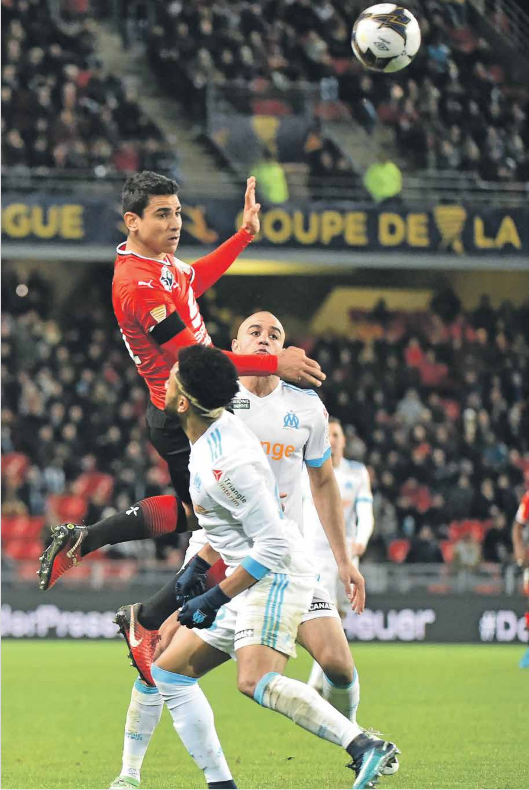
قمة مرتقبة في بطولة الدوري الفرنسي

تشهد منافسات الجولة الـ 37 من بطولة الدوري الفرنسي لكرة القدم قمة نارية مرتقبة بين فريقين ومارسيليا في إطار الصراع من أجل التأهل إلى منافسات دوري أبطال أوروبا في الموسم القادم. ويحتل فريق مارسيليا المركز الثاني برصيد 68 نقطة مقابل 62 لفريق رين الخامس، ويحتاج الأول للفوز لضمان العبور رسمياً، في حين يحتاج الثاني للانتصار من أجل تضييق فارق النقاط، والمحافظة على الأمل.