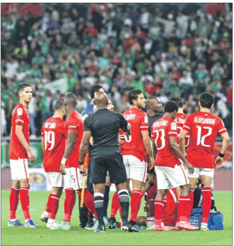
الملعب كان يُعجب التنس بلق المباراة النهائية إلى ملعب آخر

رفض الاتحاد الأفريقي لكرة القدم «كاف» طلب الاتحاد المصري استضافة المباراة النهائية لمسابقة دوري أبطال أفريقيا للموسم الحالي في 30 مايو/أيار الحالي، محمداً تأكيد على إقامته في مدينة الدار البيضاء المغربية، وأشار الاتحاد القاري في بيان رسمي «لنقل الاتحاد الأفريقي لكرة القدم رسالة من وزارة الشباب والرياضة المصرية، تشير إلى طلب الاتحاد المصري لكرة القدم والنادي الأهلي استضافة نهائي دوري أبطال أفريقيا». يُذكر كاف ويتفهم تماماً الشكاوى والخاوف التي أثارها نادي الأهلي والاتحاد المصري لكرة القدم ويلتزم بمبادئ الإنصاف والعدالة والمساواة بين جميع الأندية والاتحادات الأعضاء». وأضاف البيان «مع ذلك، كان الكاف ملتزماً بالإنجاز بالقرار الذي اتخذته قيادته المسابقة في شهر يوليو/تموز 2019 وتنفيذه، وهو أن نهائي دوري أبطال أفريقيا سيكون من مباراة واحدة، بدلاً من النهائي المعتاد ذهاباً وإياباً. علاوة