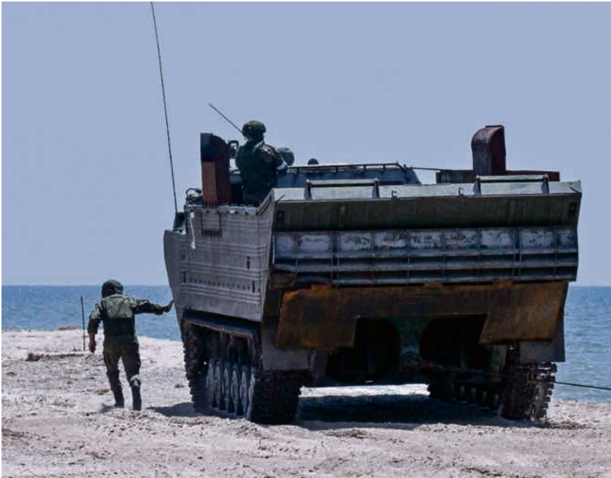
آلية عسكرية روسية خلال تنظيف شاطئ ماريوبول من الألغام أمس

(العربي الجديد، فرانس برس، رويترز، أسوشيتد برس)