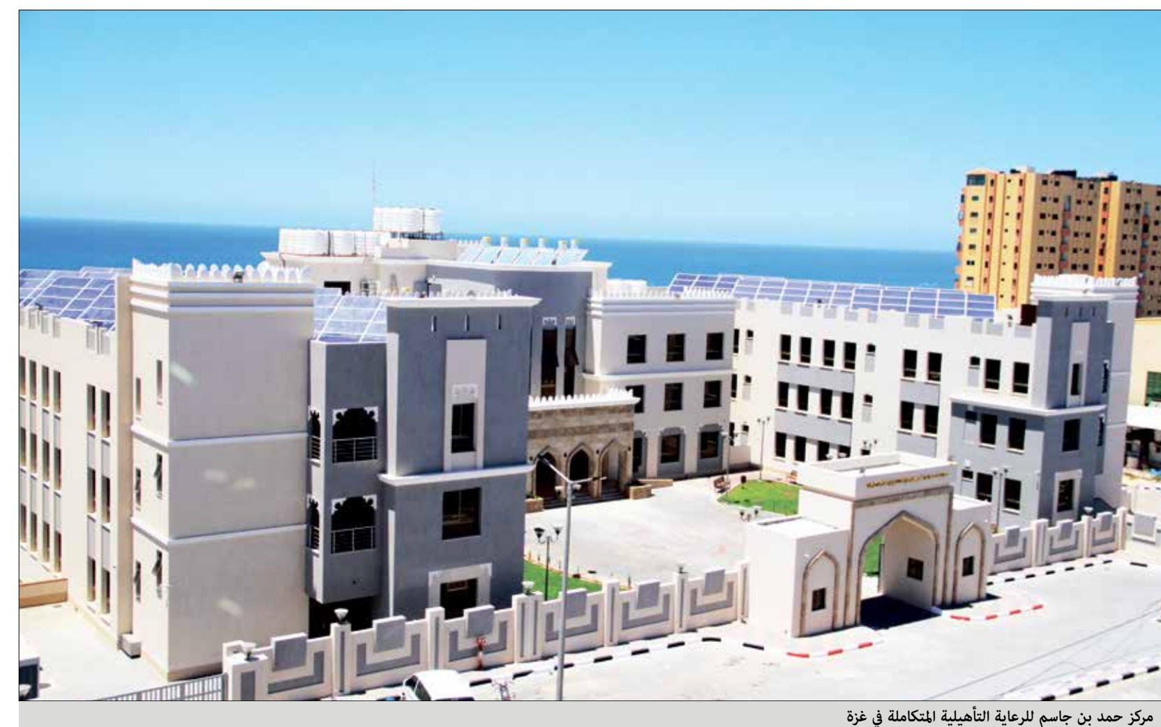
مركز حمد بن جاسم للرعاية التأهيلية المتكاملة في غزة