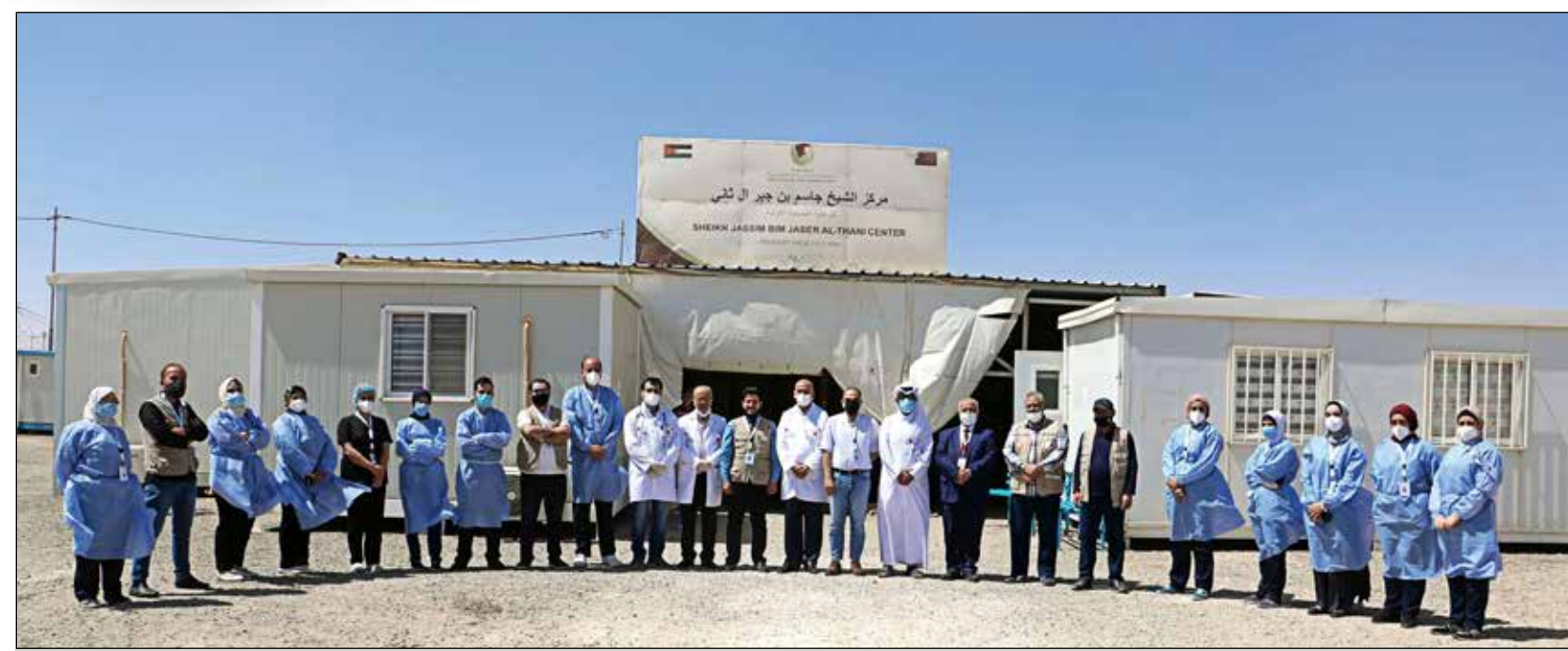
الكادر الطبي لمركز الشيخ جاسم بن جبر آل ثاني للرعاية الصحية الأولية بمخيم الأزرق في المملكة الأردنية