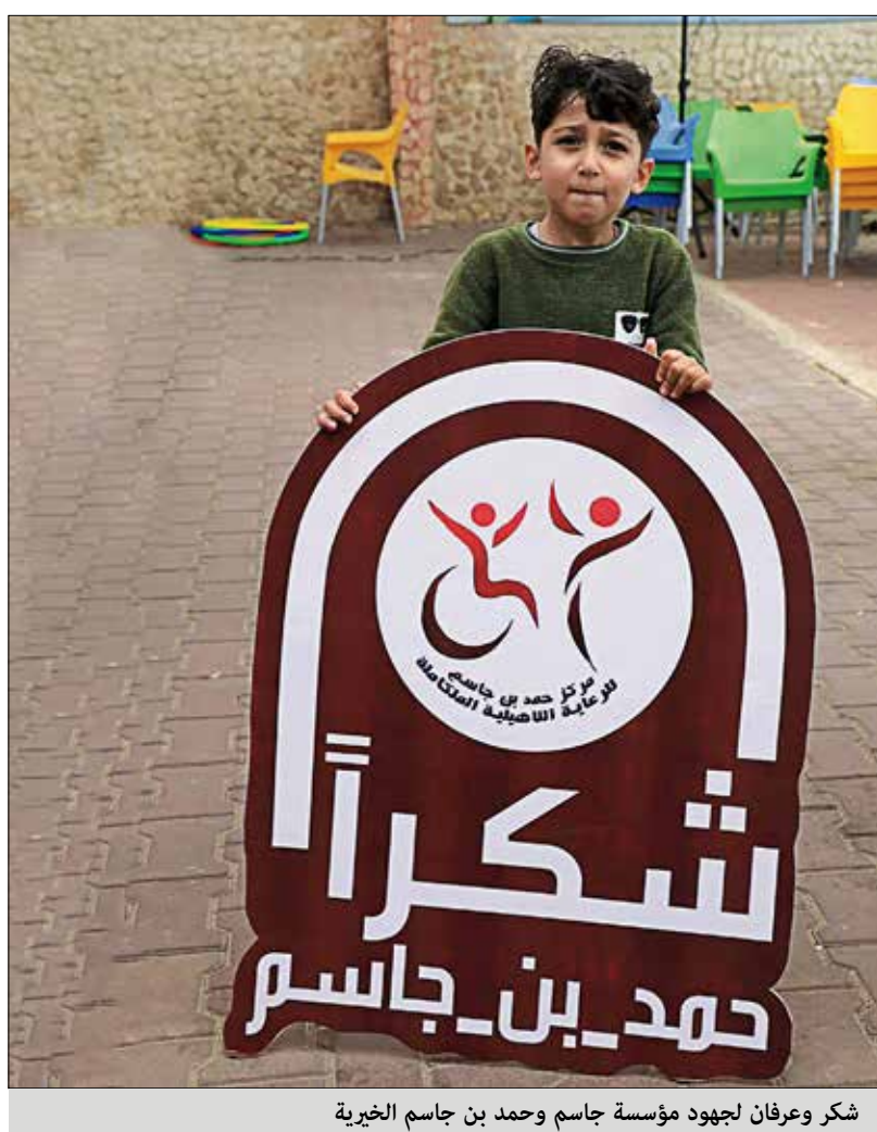
شكر وعرفان لجهود مؤسسة جاسم وحمد بن جاسم الخيرية