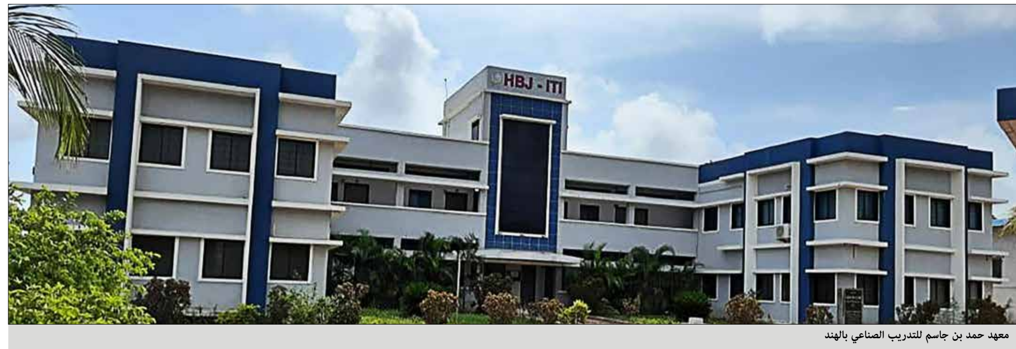
معهد حمد بن جاسم للتدريب الصناعي بالهند

القيمة الإجمالية لمشاريع المؤسسة أكثر من 543,487,000 ريال على مدار 20 عام