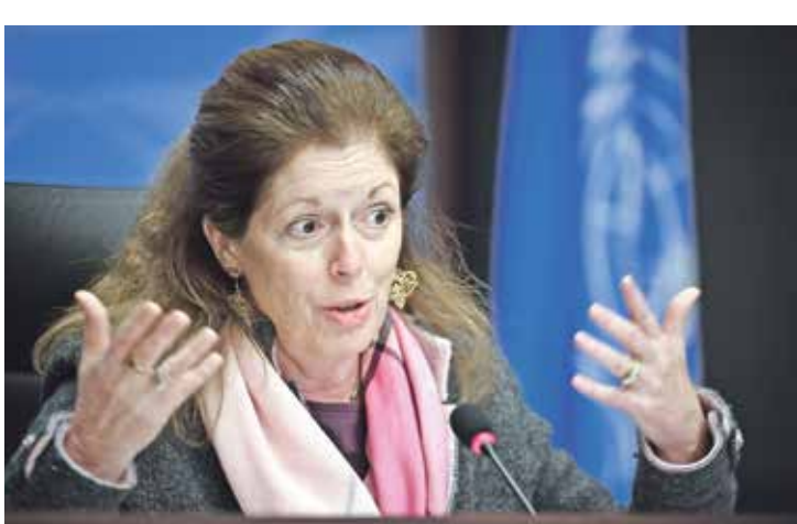
والتمار: هناك فرصة لحياء العلم والوصول إلى الانتخابات كويراني

ليبيا: فرصة أخيرة أمام اللجنة الدستورية ■ إسامة علي، القاهرة . العربي الجديد ■ طالبت اللجنة الدستورية الليبية المشتركة إلى العاصمة المصرية القاهرة، أمس الأحد، بالمشاركة في الجولة الثالثة والأخيرة من المباحثات بشأن المسار الدستوري الخاص بالانتخابات، وذلك برعاية بعثة الأمم المتحدة للدعم في ليبيا. وبينما تستمر هذه الجولة حتى 19 يونيو/حزيران الحالي، يتطلع الليبيون إلى تحقيق قرخ خلال ذلك، يمكن البلاد من الانتقال إلى مرحلة جديدة، خصوصاً في ظل المخاوف التي عادت لتتصاعد في الفترة الأخيرة، على المستوى الأسمى مع تجدد الاشتباكات بين المجموعات المسلحة، ولا سيما في العاصمة طرابلس، وكذلك على المستوى السياسي مع انقسام البلاد مجدداً بين حكومتين تتصارعان على الحكم واقتراب 22 يونيو/حزيران الحالي موعد إنهاء خريطة طريق ملققي الحوار السياسي التي كانت يفترض أن تقضي إلى إجراء الانتخابات وتشكيل سلطة جديدة.