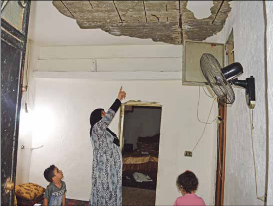
يعيرون تحت سقف مهادر