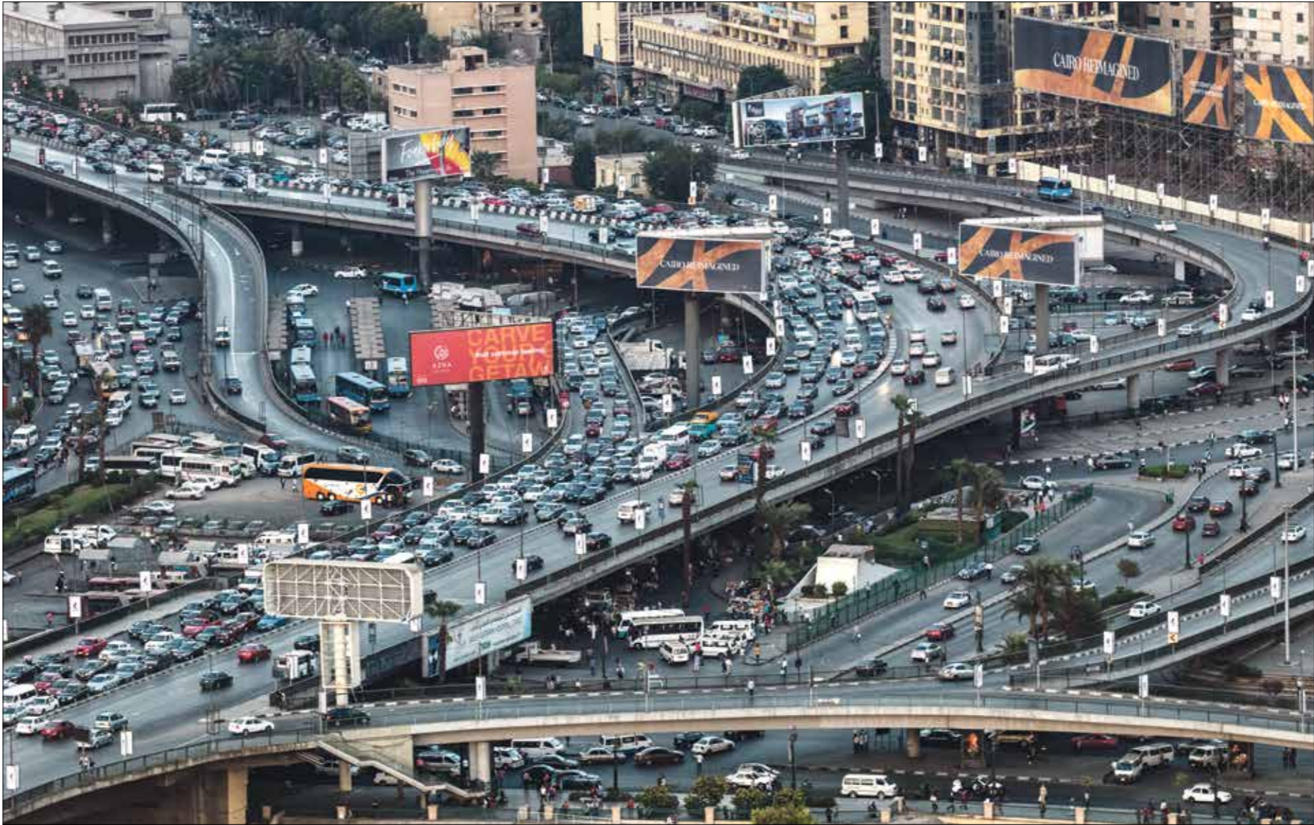
مت القاهرة في 2017