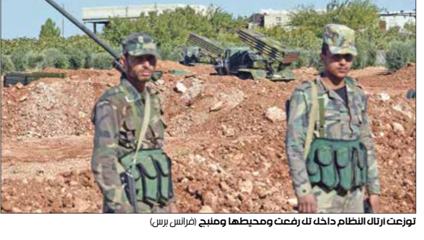
توضع ارتاك النظام حادك لت رفضت ومحيطها ومليج

يعزز النظام السوري مواقعه في الشمال مع استمرارية استعدادات سورية محتملة للعمليات التوسيعية عن قرب إطلاق العملية العسكرية التركية، والتي تستهدف، بحسب التصريحات الرسمية للمسؤولين الأنرارك، تل رفعت ومنبج في ريف حلب الشمالي والشمالي الشرقي. ومن الواضح أن النظام يريد تحقيق مكاسب على الأرض على حساب «قوات سورية الديمقراطية» (قسد)، التي وضعت مرة ثالثة في مواجهة «فرض» الأتراك بعد عملية «فصن الزيتون»، التي انتزعت خلالها تركيا السيطرة على منطقة عفرين، وعلمية ما سمي بـ«فتح السلام»، التي طردت منها «قسد» من منطقة تل رفعت في رأس العين، وتحططت تركيا حاليا للقضاء على «القوات» التابع للروس، و«بين المصدرين» على خلفية «العمليات» المعارضة، فضل عدم ذي اسم له، «العربي الجديد»، أن الأتراك، من قوات النظام، تتوافد تباعا إلى ريف حلب الشرقية منذ عدة أيام».