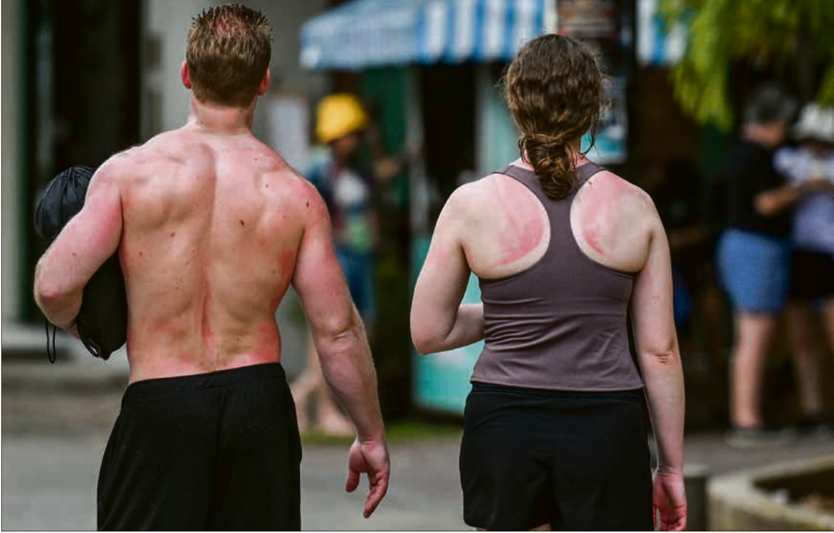
يجب عدم التعرض لأشعة الشمس عند فترة الظهيرة حيث ترتفع حرارتها

يسعى الجميع في فصل الصيف إلى اكتساب اللون البرونزي، ويقومون بتعريض أنفسهم لأشعة الشمس. لهذه الخطوات تداعيات على الجلد ممكنة أن تؤدي إلى حروق