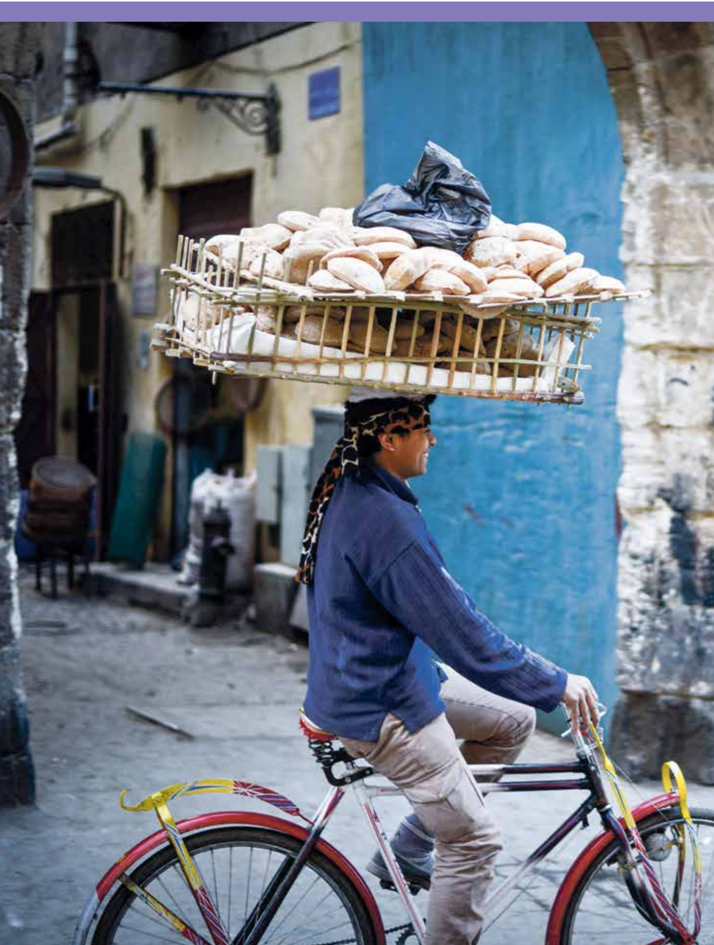
الموازنة الجديدة تدعو لحد ارتفاع التضخم وتلغهم الامتازات المعيشية لحدد التضخم