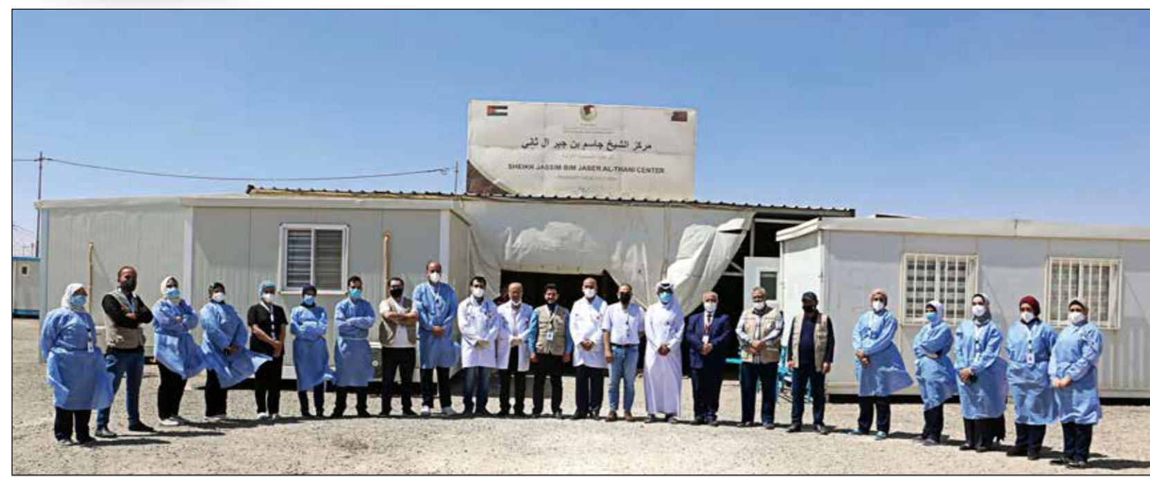
الكادر الطبي لمركز الشيخ جاسم بن جبر آل ثاني للرعاية الصحية الأولية بمخيم الأزرق في المملكة الأردنية