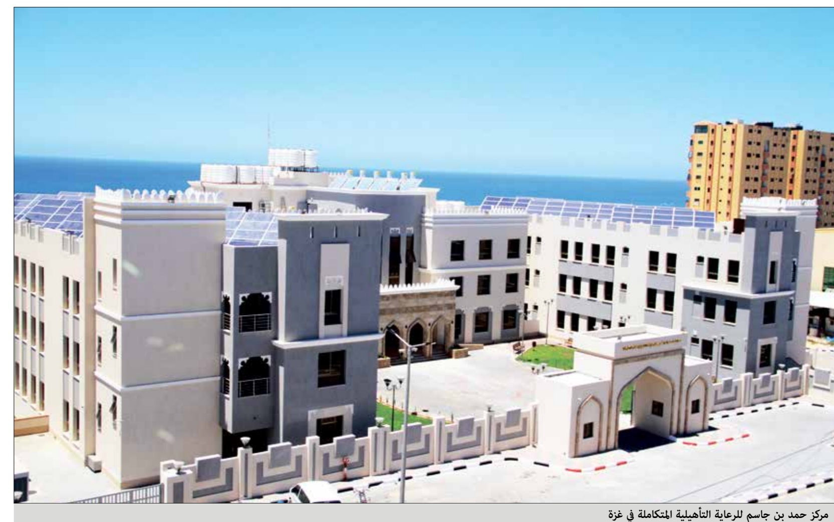
مركز حمد بن جاسم للرعاية التأهيلية المتكاملة في غزة