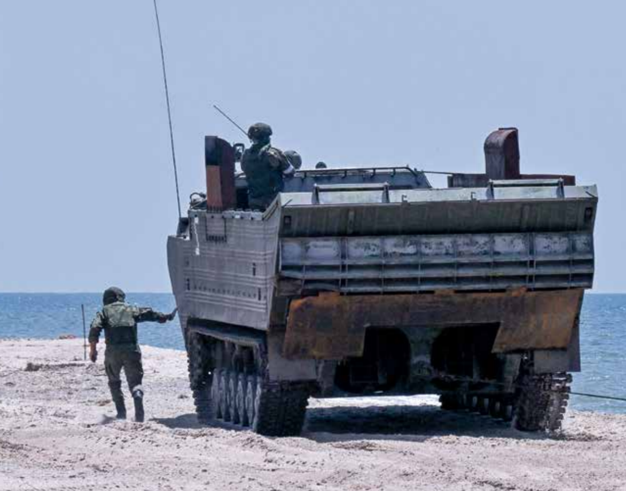
آلة عسكرية روسية تحطيف شاحنة ماريوبول من االعمام لمن

أوكرانيا، أفاد أيضاً باستهداف موقع يضم منشآت إنتاج الحديد في غرب أوكرانيا، في بيان، إن «صواريخ