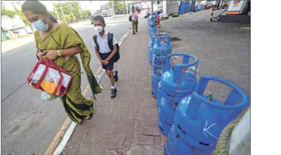
محطة وقود في العاصمة كولمبو

ويبينما أقر بأن سيرلانكا هي من وضعت نفسها في المأزق الحالي، قال إنّ الحرب في أوكرانيا تزيد الأمر سوءا، مشيرا إلى أنّ بحرية وتراكمت على سيرلانكا ديون