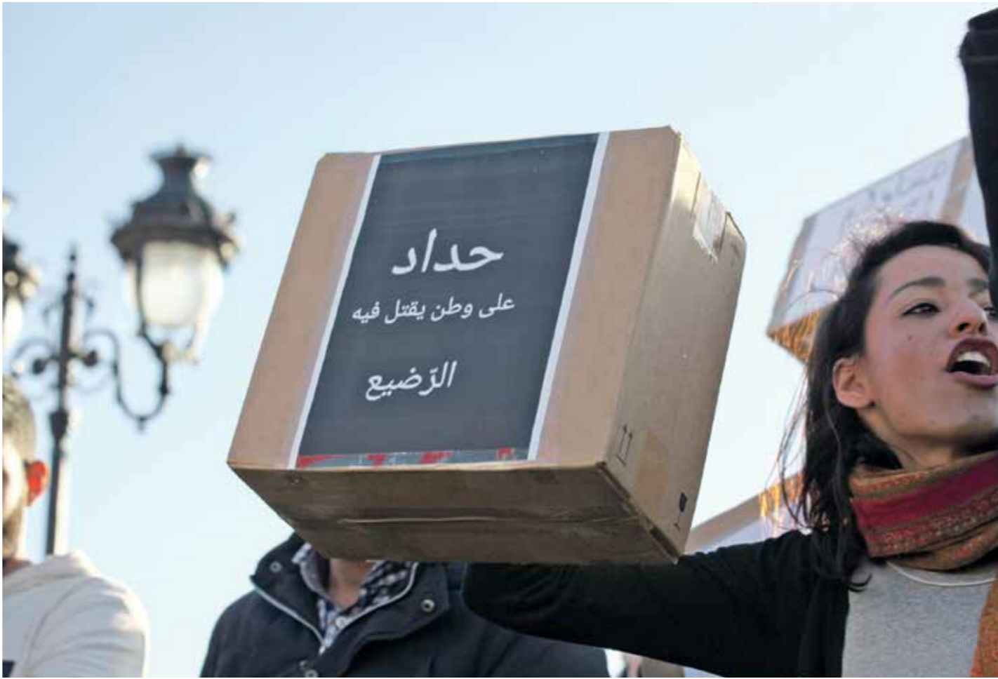
تلاحظ الخدمات الصحية في تونس التفادات كبيرة