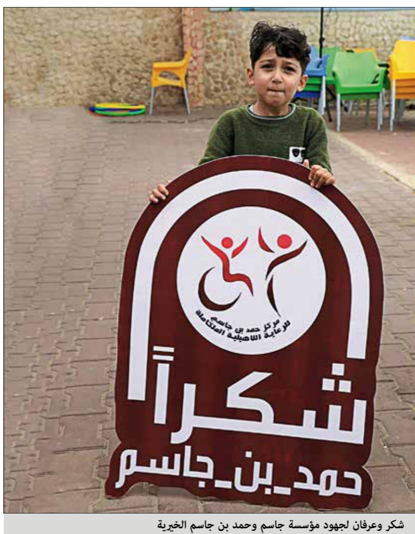
شكر وعرفان لجهود مؤسسة جاسم وحمد بن جاسم الخيرية