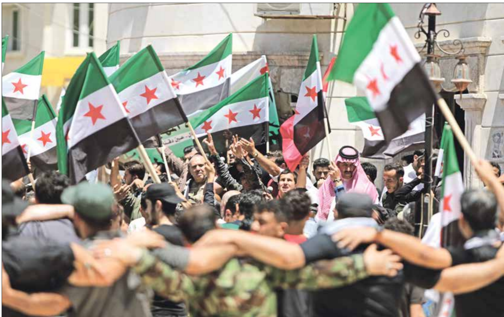
تظاهرة في إربيل (عراق الشالي) ضد حزب العمال الكردستاني /5/ 2022

الأكبر، في المسألة الهويةية في سورية، وربما تحتل مسألة الهوية موقعا متميزا اليوم في النقاش السوري في سياق البحث عن تفسيرات عقلانية للعنف الاستثنائي الذي شهدته البلاد في العقد الأخير، والذي لا تزال وقائعه المرعبة تتكشف كل يوم بشكل أكبر، من جهة، وكذلك للتشتت الذي عرفته مقاومة السوريين السياسية والمسلحة، وعجزهم عن تنظيم قيادة موحدة تجمع شتات فصائلهم وتتمصر جهودهم التي لا تقل استثنائية عما واجهته من عنف وميول معظم السوريين ويحاولون تخيرون في الشأن السوري والعربي عموما، إلى طرح هذه المسألة في إطار إشكالية الهوية، والتساؤل عما إذا وجدت هوية وطنية سورية أم لا، وما هي أسباب غيابها أو ضعفها.