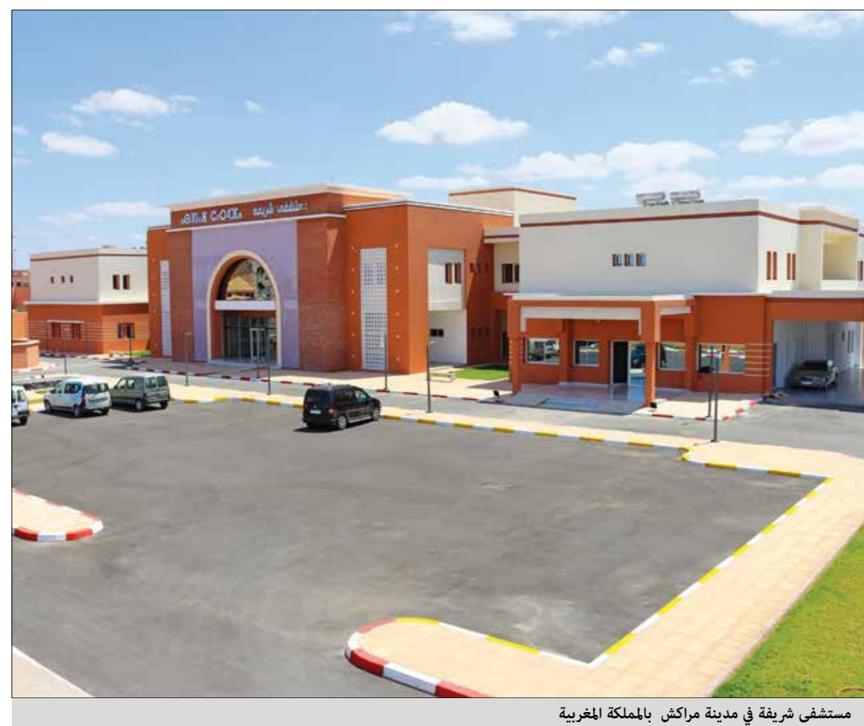
مستشفى شريفة في مدينة مراكش بالمملكة المغربية