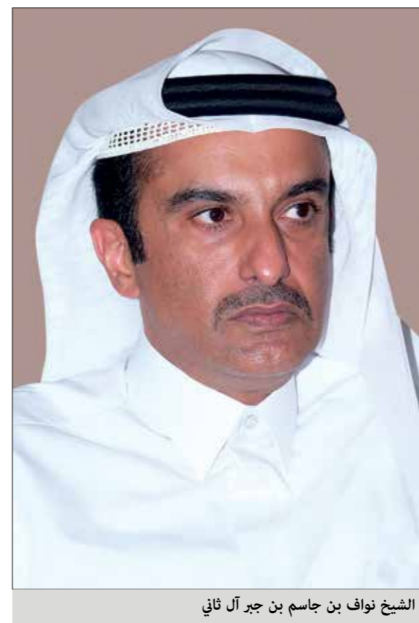
الشيخ نواف بن جاسم بن جبر آل ثاني