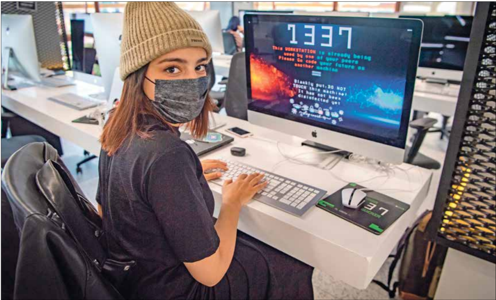
يبدى طلب مغاربة تدهمهم من اختيار نظام البكالوريوس (فاطمة ساء/ هراس بربر)

يؤكد طلاب جامعيون بالمغرب انهم شعروا بتفاؤل لإطلاق مسيرتهم الجامعية من خلال نظام البكالوريوس «الإصلاحي»، ثم فوجئوا بالتراجع عنه