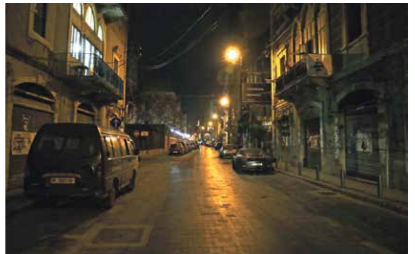
بيروت ليلاً، فراغ كصمت القبور، الدور عجمه نراس روس

والقاهرة غاضب في سكبها الغامر، والصالات الكبيرة في مجمع واحد تعجز عن منح القادم إليها اطمئناناً وهوياً. مساء 10 يونيو/حزيران 2022، تفتتح الدورة الـ11 ل«دايام بيروت السينمائية»، بعد غياب 3 أعوام، لتفشي كورونا، وبدء ثالث أسوأ أزمة اقتصادية في التاريخ (كما تُرصد عارفون ومتخصصون)، سبب اختيار صالات «سيني سينما ـ اسواق بيروت» غير واضح، لكنه يُشبه رغبة في إنعاش حتى جغرافي، غارق في فراغ عدو، الايمنة المحيطة بالصالات مُغلقة، الأثرة خالية كل شيء، يعيق بموت، يتفطن في إذلال شعب،