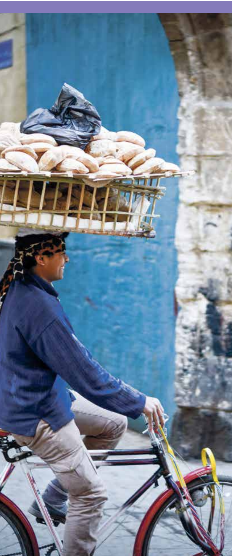
الموازنة الجديدة تدعو لحد ارتفاع التضخم وتلغهم الامتازات المعيشية لحدد التضخم