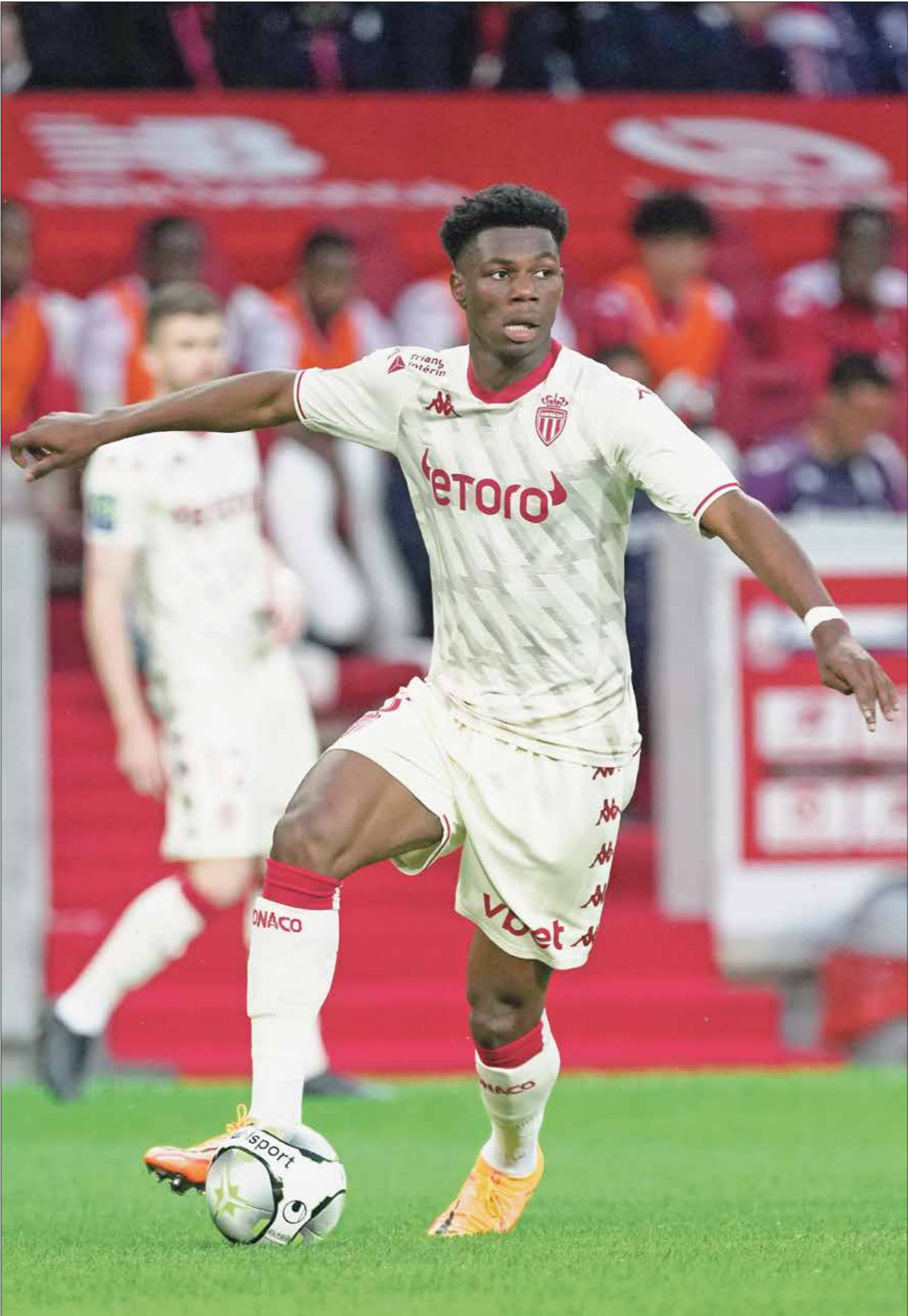
تشواميني مثل ضم صفوف فريقه موناكو لمرمرة/

بقدرة كبيرة على التحكم مع سباقات اللعبة المختلفة، مما يوفر لفريقه القدرة على التكيف أيضا مع السيناريوهات المختلفة التي قد تحدث أثناء اللقاء، ومع ذلك، فقد ترك الفرنسي تلميحات حول ما يمكن أن يساهم به مع الريال، على سبيل المثال، عندما يكون فريقه أكثر سيطرة في مواجهة، يكون للاعب حالات دفاعية عالية المستوى، من خلال تعطيل هجمات المنافس، وانضم تشواميني إلى مواطنه إدواردو كامافيستا والأوروغواياني فيديريكو فالغيريدي، ليكون الثلاثي البديل لخط وسط ريال مدريد، الذي عاصر حقبة تعد الأناج في تاريخ النادي، وهذه ثاني صفقة تجسها الإدارة للملكة هذا الصيف، بعد الإعلان في الأيام القليلة الماضية عن التعاقد مع قلب الدفاع الألماني أنطونيو روديجر، قادمًا مجانًا بعد انتهاء عقده مع فريق تشلسي الإنجليزي، بطل النسخة قبل الأخيرة، لمسابقة دوري أبطال أوروبا.