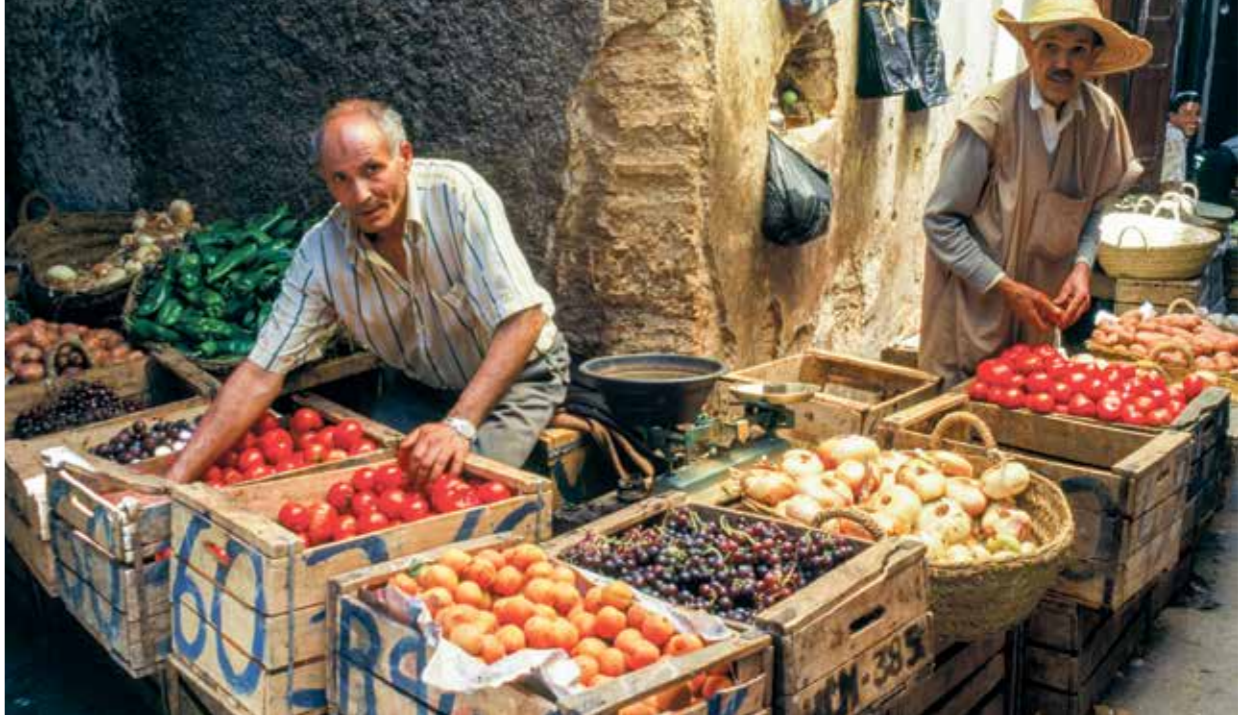
ارتفاع كبير في أسعار السلع الغذائية

وعادت أسعار الوقود لارتفاع مرة أخرى في الفترة الأخيرة، كي تثير نوعاً