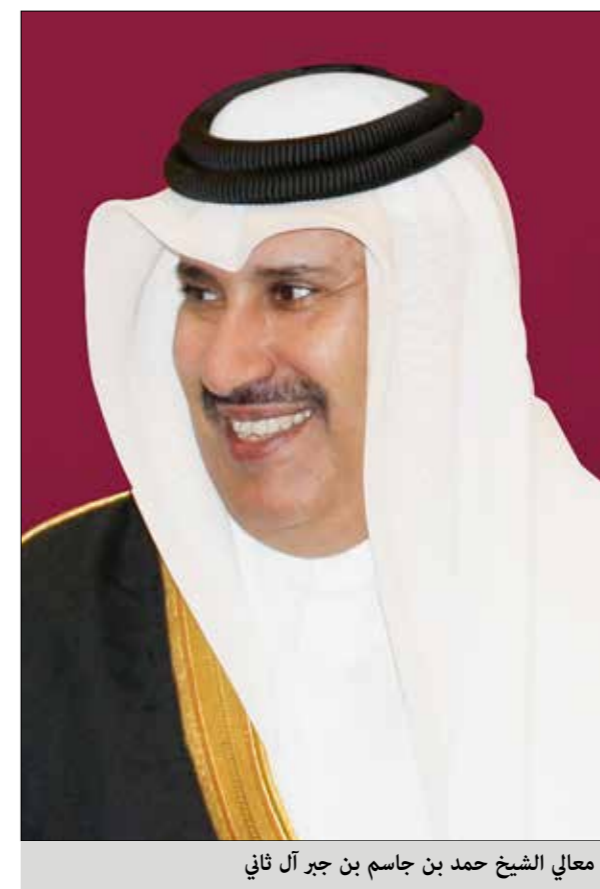
معالي الشيخ حمد بن جاسم بن جبر آل ثاني

أصدرت مؤسسة جاسم وحمد بن جاسم الخيرية تقريرها السنوي الذي يتزامن هذا العام مع مرور 20 عاماً على تأسيسها تحت شعار "أثر تنموي مستدام" حيث تضمن التقرير محورين، استعرض الأول إنجازات المؤسسة منذ انطلاق أعمالها عام 2001 حتى عام 2021، كما تضمن نبذة عن مسيرة الشيخ جاسم بن جبر بن محمد آل ثاني رحمه الله، ومآثره الجليلة محلياً وخارجياً، حيث تم إنشاء المؤسسة بناء على وصية الثلث التي أوصى بها المغفور له بإذن الله وعرفت آنذاك بمؤسسة الشيخ جاسم بن جبر آل ثاني الخيرية التي شكلت اللبنة الأساس في نهوض هذا المرح الخيري والإنساني والذي أضاف له معالي الشيخ حمد بن جاسم بن جبر آل ثاني - العضو المؤسس دعماً شخصياً فأصبح اسمها كما هو اليوم "مؤسسة جاسم وحمد بن جاسم الخيرية". على مدار الـ 20 عاماً الماضية والتي بلغت تكلفتها الإجمالية أكثر من 543,487,000 ريال واستفاد منها حوالي 13 مليون إنسان حول العالم.