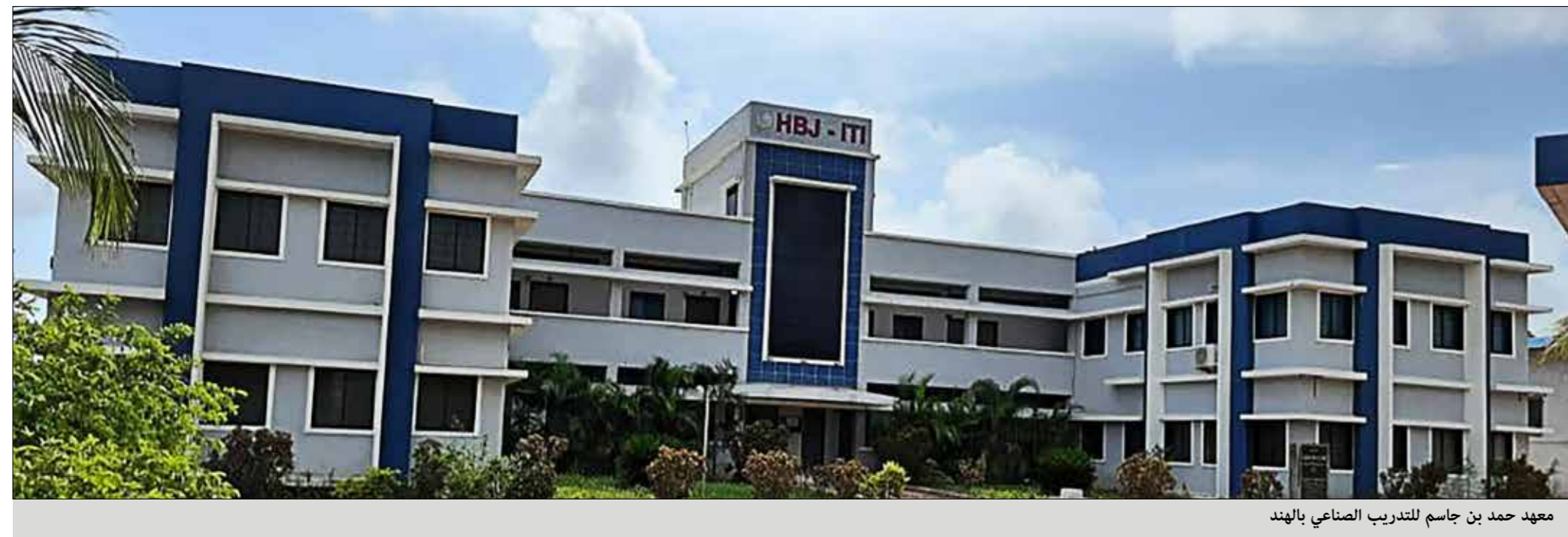
معهد حمد بن جاسم للتدريب الصناعي بالهند

القيمة الإجمالية لمشاريع المؤسسة أكثر من 543,487,000 ريال على مدار 20 عام