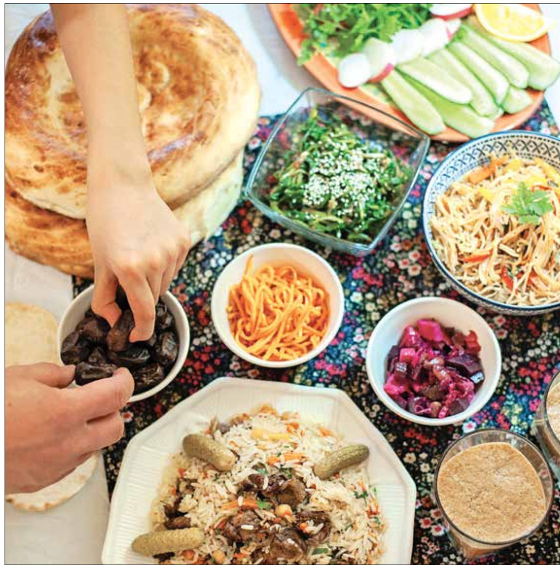
ينصح بشدة بالبروتين في السحور

(باحثة تحمل شهادة دكتوراه في تكنولوجيا الغذاء والصناعات الغذائية، تكتب مقالات متخصصة في الصحة الغذائية لـ «العربي الجديد»)