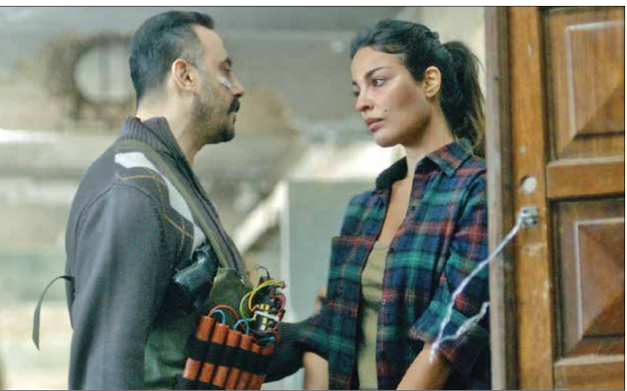
فصيح خولي في «الرجل» (MBC) 2020

تلتحق حياة الفهد عن الأعمال المثيرة للجدل التي قدمتها أخيرا