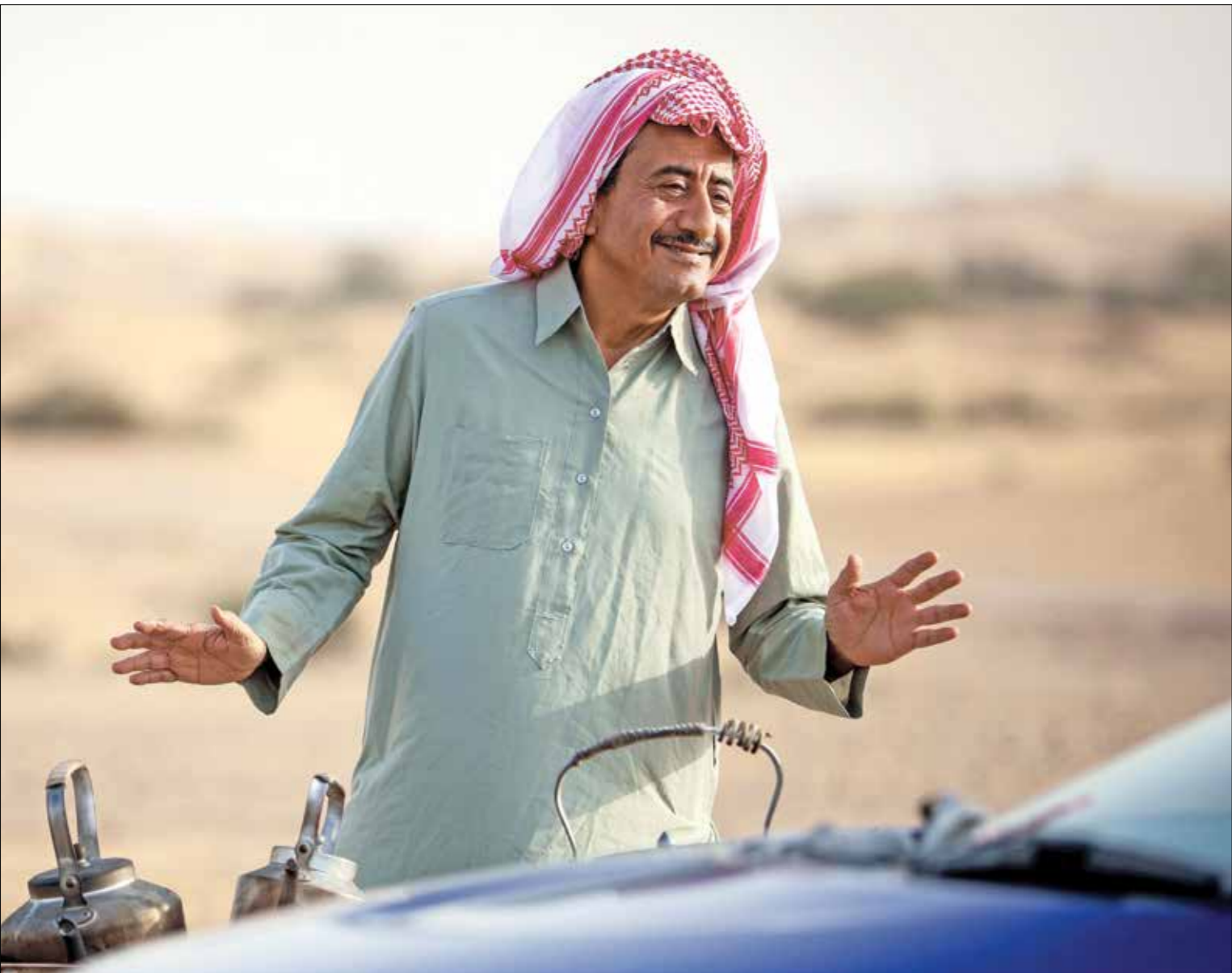
ناصر الضبي في برنامج «الرجل» (MBC)

ترجع الإنتاج الدرامي اللبناني عام 2020 بشكل واضح، والسبب بالطبع قيام انتفاضة 17 أكتوبر/ تشرين الأول 2019، ودخول لبنان في وضع اقتصادي صعب، انعكس آثاره على قطاعات فنية عديدة، أبرزها التلفزيون وإنتاجاته على السواء، وانكسر الأخر سلباً على التعااطي مع الواقع الجديد الخاص بالأعمال الدرامية، لكن المحطات اللبنانية المحلية لم تبق مكتوفة الأيدي أمام هذا الواقع، بل اتخذت موقف استراحة المحارب، ريثما تتجلي الصورة،