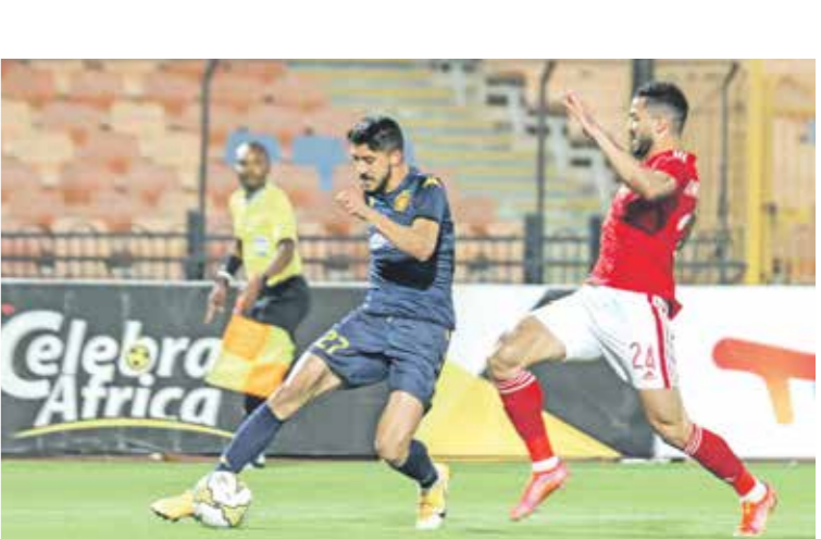
الترجي يعانِي من ضعف الهجوم

في التأهل إلى ربع النهائي، وهما الأهلي المصري والترجي التونسي، الذي حل ثانيا في مجموعته، في وقت حصد فيه الأهلي صدارة مجموعته بصعوبة كبيرة، وكان مهيدا بخسارة المركز الأول في الجولة الأخيرة، غير أنه أحسن التعامل مع المواجهة الحاسمة أمام باغ أفريقيان الترناتي، ليحصد الصدارة ويواصل الدفاع