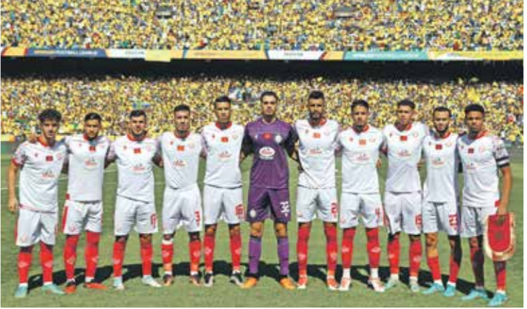
الوداد دفع لحد ضعف هجومه قبل ماجاكو

انتقارات الجماهير، ذلك أن الفريق يُعرف بأهمية الصفقات الأجنبية التي يقوم بها في السنوات الماضية، ولكن أداء الأجنبي تراجع باستثناء التونسي على معلول الذي مازال رقما مهما في حسابات النادي. أما الفريق العربي الثاني الذي تخطف دور المجموعات، وهو الترجي الرياضي، فقد تعادق في «المحركاتو» الصبيغي مع البرازيلي رودريغز على أمل أن يحل مشاكل الفريق الهجوميّة، التي لاقت الترجي في السنوات الماضية فنتذ رحيل الكاميروني باينك نغانغ من بطل أفريقيا