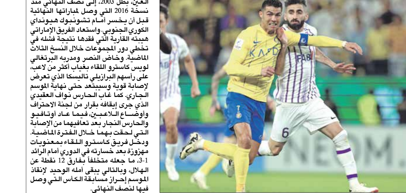
النصر واصل تلامزه في الموسم الحالي

الإضافي الأول عبر الدبيل سلطان الشامي، لكن روتالو انتزع ركلة جزاء قبل دقيقتين على نهاية الوقت ونفذها بنفسه، فأرضا ركلات الترجيح التي أخفق فيها فريقه تماما بعدما أهدر كل من الكرواتي مارسيلو برونوفيتش والبرازيلي اليكس تيليس والبرغالي أوتافيو.