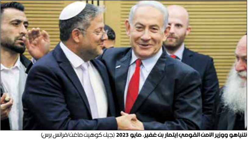
للتيا هو وزير الاعدت الصومع إيمان عبد غنيمر، مايو 2023

مع اختلافه الحاكم من اليمن المتطرف والأحزاب المدنية والمخترعة التي تواصل اتباع سياسات متشددة تجاه الفلسطينيين والمسائل الأمنية، قد يكون في «خطر». وأضاف أن «التشكيك بقدرته نتجناهو دولها من أجل حماية الأمن الأميركي، مع مجلس الشيوخ بالكونغرس الأميركي، مع مدير وكالة الاستخبارات المركزية الأميركية (سي آي إيه)، وليام بيرنز، بشأن التقرير، ونحن نتوقع خروج احتجاجات واسعة فيها يتحدثون تطالب باستقالته وإجراء انتخابات جديدة». وقال التقرير: «إن تشكيل حكومة مختلفة، أكثر اعتدالا، هو امر محتمل». وتطرق التقرير كذلك إلى تقييم الوضع الذي رأى أن العداء بين حماس والسلطة الفلسطينية قد توسع داخل المجتمع الإسرائيلي وذلك بعد هجوم حركة «حماس» على مستوطنات غزة في 7 أكتوبر/ تشرين الأول الماضي، وهو أمر اعتبرت أنه «مؤثر على الأمن القومي». وقال التقرير: «بعد أكثر من خمسة أشهر على الحرب، ووفقا لتقييم الاستخبارات الوطنية الأميركية، فإنه «من المحتمل أن تواجه إسرائيل مقاومة مسلحة طويلة الأمد من حركة حماس لسنوات مقلدة، وسوف يكافح الجيش الإسرائيلي