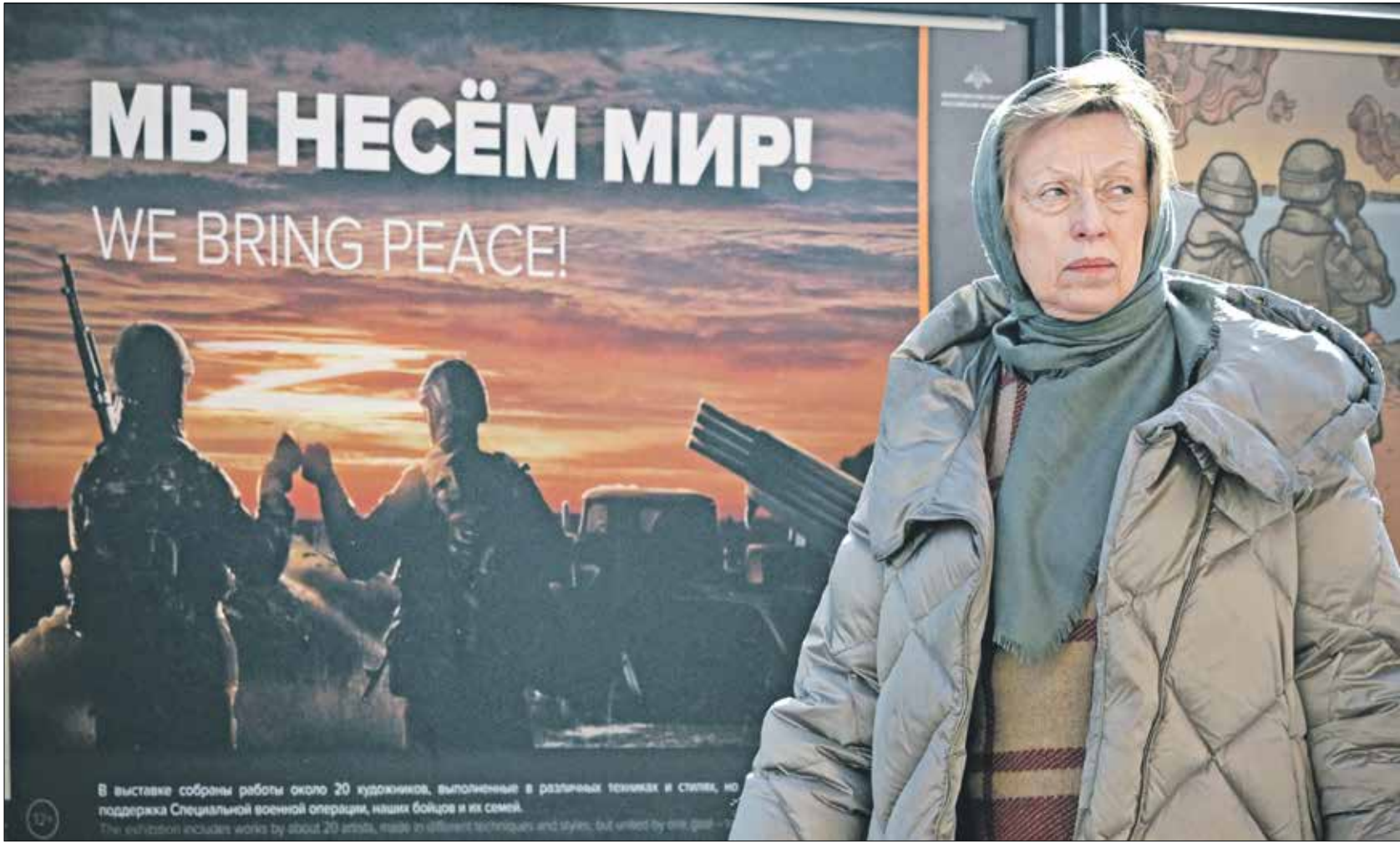
ضمت الدراسة 52 امرأة و52 رجلاً

وفقاً لدراسة نُشرت يوم 6 مارس/ آذار الحالي في مجلة PLOS ONE، فإن استهلاك مستويات عالية من الكربوهيدرات المكررة، قد يؤثر في السمات غير الطيبة، مثل جاذبية الشخص