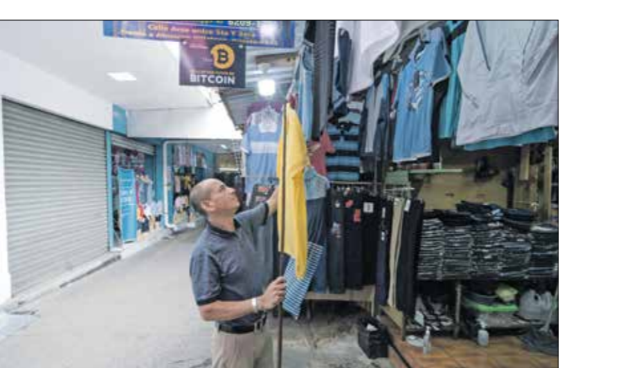
سوف يترك الضع باستخدام بيتكوين في الشاؤجوار

ونشرت «كوين شيرز إنترناشيونال» في تقرير حديث لها، أن أصول العملات المشفرة شهدت تدفق استثمارات بقيمة 2,7 مليار دولار خلال الأسبوع الماضي فقط، مع استعادة بيتكوين على التصيب