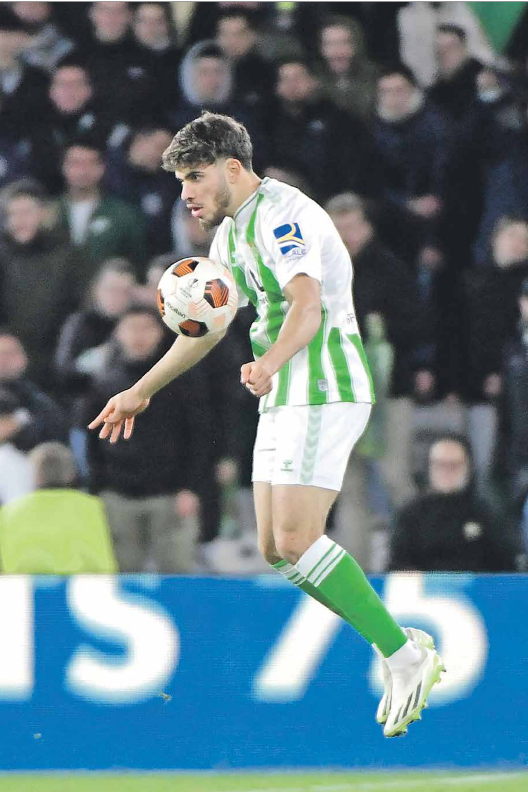
الزلزولي لم يقدّم المستوى المأمول منه مع بيتيس

تغلب الخرافة على نظيره معيذر بهدفين دون رد في المواجهة التي جمعتهما على استاد حمد بن خليفة لحساب الجولة السابعة عشرة من منافسات الدوري القطري لكرة القدم /دوري نجوم إكسسو. ورفع الخرافة رصيده إلى 34 نقطة في المركز الثاني مؤقتا، ملقضا الفارق مع السد المتصدر برصيد 37 نقطة، فيما توقف رصيده معيذر عند 11 نقطة في المركز الحادي عشر وقبل الأخير، والذي مني بهزيمته التاسعة هذا الموسم.