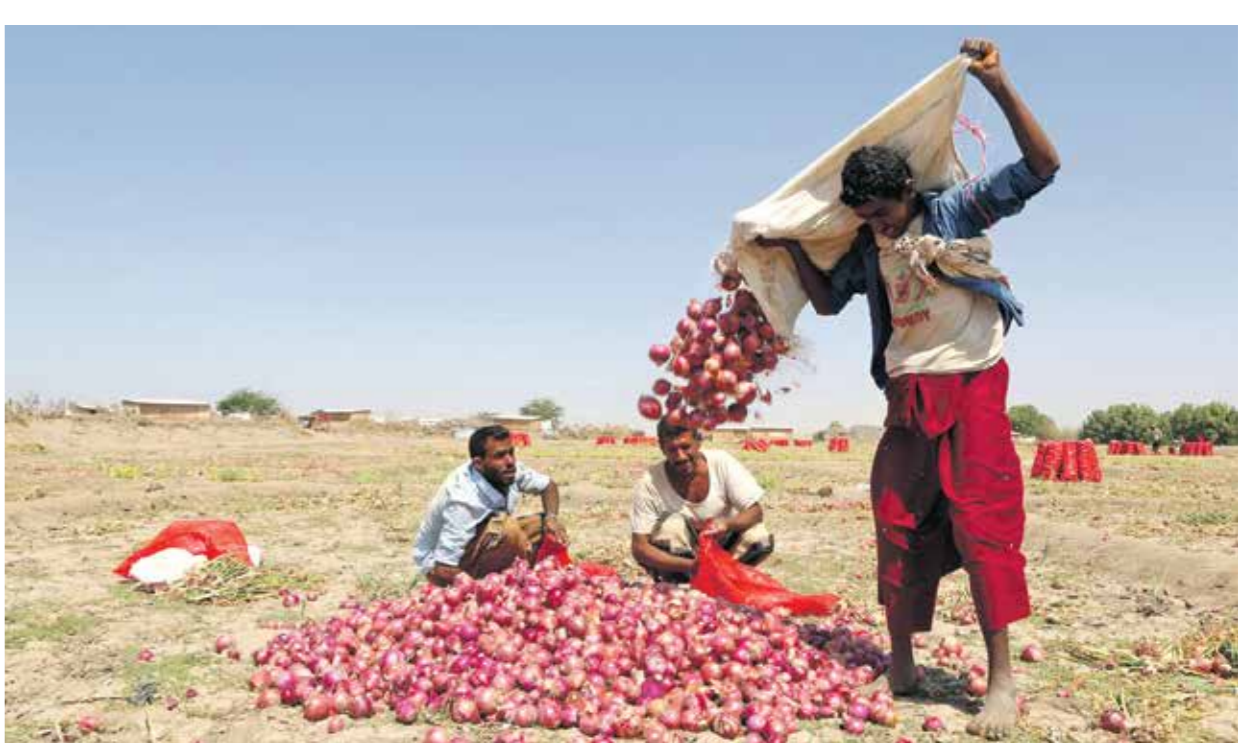
الصاعد إلى محصول إنتاج اليمن بكمية تقدر بنحو 232 ألف طن سنوياً

سلطات الجوفين بحظر تصدير السلع وتشجيع الإنتاج المحلي حفاظاً على استقرار الأسواق. وقررت الحكومة اليمنية التي تتخذ من عدن جنوب البلاد مقراً لها، إبقاء تصدير محصول البصل حتى يتم تخليص تسويقه محلياً وخارجياً مع الجهات المختصة ذات العلاقة، والزمت