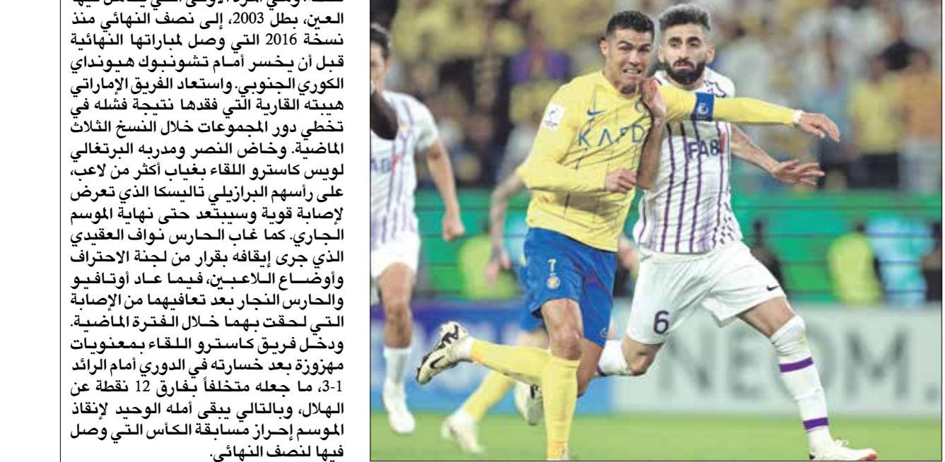
النصر واصل لظرفته في الموسم الحالي

في دور ال16 على مواطنه الفجاء بواقع 0-3 في مجموع المباراتين. في المقابل، تصنّر العين ترتيب المجموعة برصيد 14 نقطة من ست مباريات، مقابل 8 نقاط لبريسيدوليس الإيراني و7 للدحلل القطري و3 الاستقلال الطايجيكي، ثم فاز