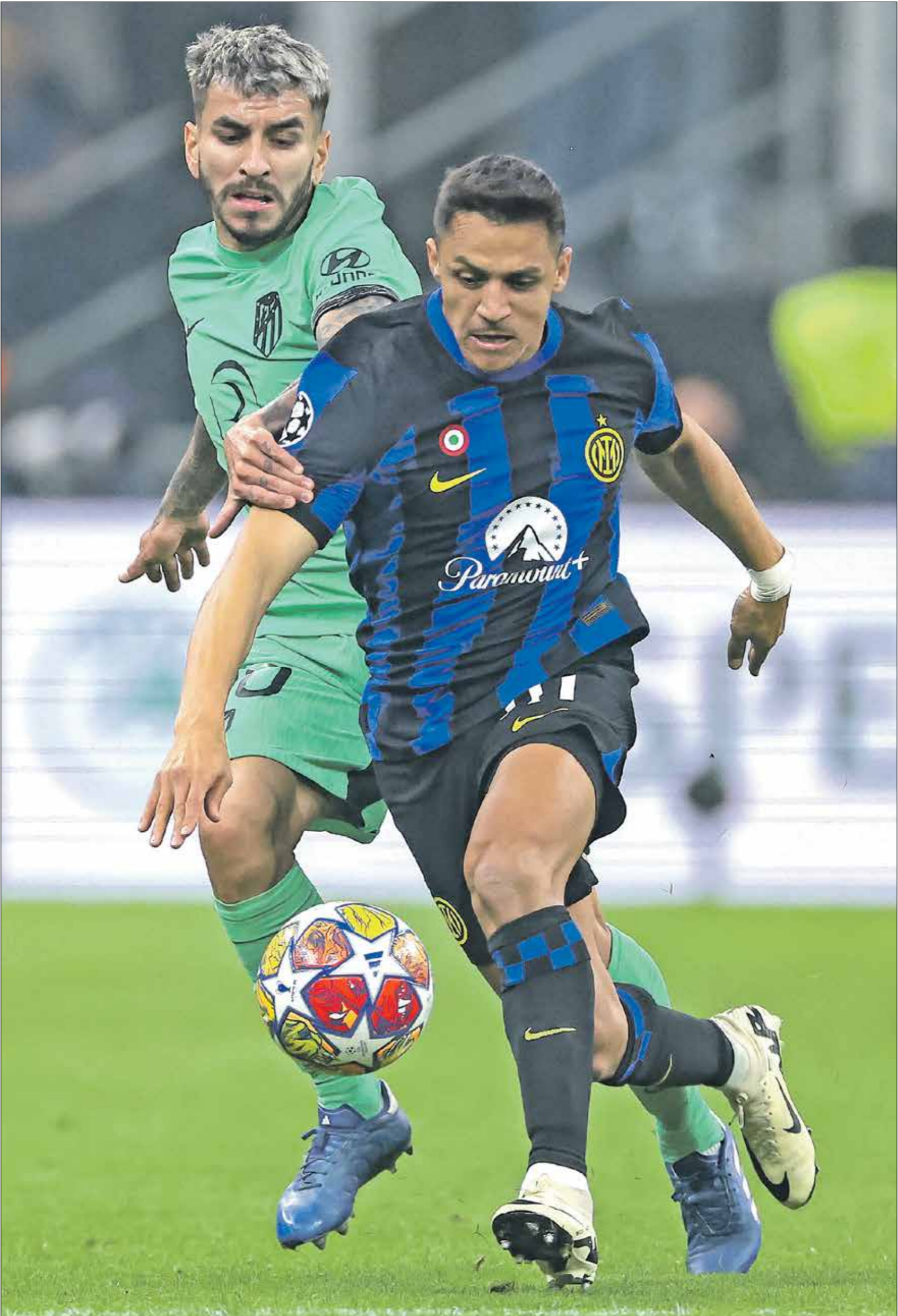
الزلزل يعزض فيه أكثر من 10 مباريات خارج ارضه