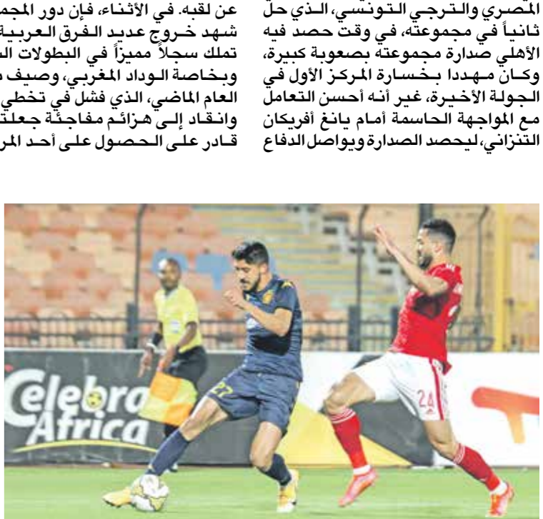
الترجي يهاني من ضعف الهجوم

شهدت نسخة دوري أبطال أفريقيا الموسم 2023-2024، تراجع الحضور العربي قياسا بالسنوات الماضية، حيث نجح فريقان عربيان فقط في التأهل إلى ربع النهائي، وهما الأهلي المصري والترجي التونسي، الذي حل ثانيا في مجموعته، في وقت حصد فيه الأهلي صدارة مجموعته بصعوبة كبيرة، وكان مهيدا بخسارة المركز الأول في الجولة الأخيرة، غير أنه أحسن التعامل مع المواجهة الحاسمة أمام باغ أفريقيا الترنزاني، ليحصد الصدارة ويواصل الدفاع