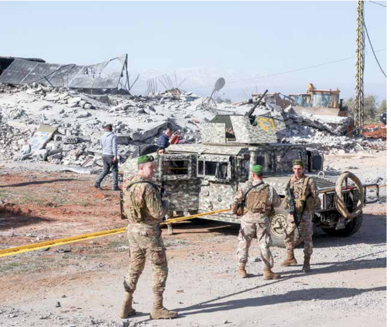
دمار كبير جراء الغارات الإسرائيلية على سرعيت، امس

وكالة الأنباء الفلسطينية الرسمية (وفا)، أن قوات الاحتلال اعتدت بالضرب المبرح على شاب قرب باب الساهرة، احد ابواب الأقصى، واعتقلته، كما اعتقلت حارس المسجد الأقصى خليل الرموني من القدس في اليوم الأول من رمضان رغم التضييق الإسرائيلي، غالبيةهم من القدس، والباقيون من فلسطينيي الداخل المحتل. وتكرت الإسرائيلية 6 فلسطينيين من الحصار