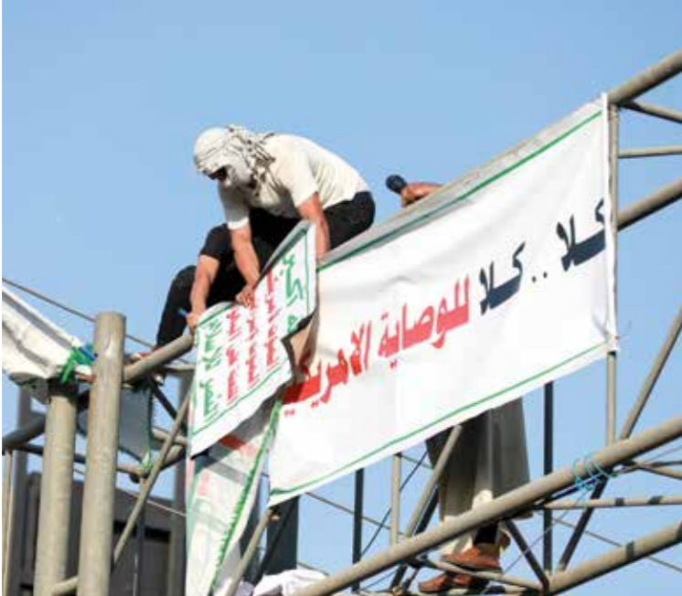
ملة تحرك ماضع للنفوذ الأميركي في العراق، يوليو 2023