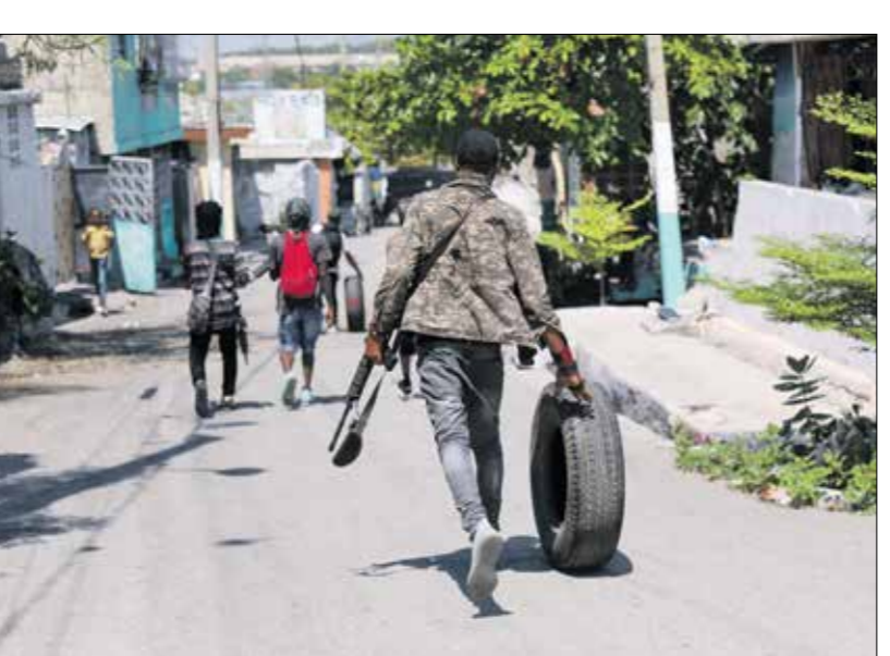
عناصر العصبات في بور أو برنس، الائتلاف

من المقرر ان يقود مجلس انتقالي هايتي في الفترة المقبلة