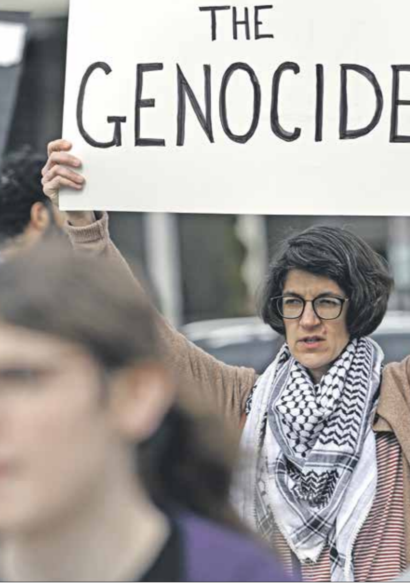
من مسيرة موجهة فلسطينيين في واشنطن الاسبوع الماضي

تندرج هذه العمليات مخطّطة ومدروسة وفق بيانات استخبارات عالية الدقة، ولم تكن مجرد تخمينات لوجود قادة عسكريين شيعية في هذه الإقليم، وكان للمتحذّث باسم الجيش الإسرائيلي دانيل شافاري، فرصة لتوضيح أهداف الغارات الجوية على مناطق سورية، إذ أعلن، في مقابلة صحافية مع جرت في 3 الشهر الماضي (فبراير/ شباط) أن إسرائيل هاجمت أكثر من 50 هدفًا لحزب الله في سورية و3400 هدف في لبنان منذ بدء الحرب على غرّة في أكتوبر/ تشرين الأول، ما يعني أنّ الحرب على وكلاء إيران والجماعات الشيعية الممتدّة على حدود الأراضي المحتلة ما تزال في وتيرة عالية.