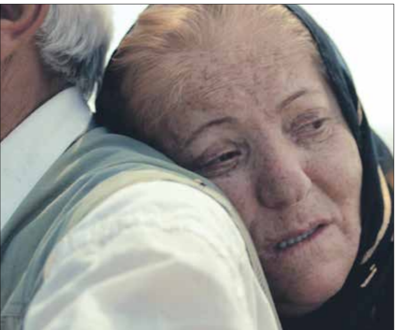
«سعادة عابرة»: لمسة حنان كريمة لمواجهة مصاعب الحياة (الملف الصحفي)

مشكلات الأدمس لم تعد تشبه مشكلات اليوم، ربما تقاطع بعضها مع بعض، لكنّها اختلفت وتغيّرت بسبب عوامل، وسيئات كثيرة، أهمها التقدم المعرفي الذي خلق أضرارا جانبية عدّة، وانعكس سلبا في مجالات مختلفة، وأثر على الأساليب التربوية والتخشّية، من جهة أخرى، تقلّص الزمن، ولم يعد الوقت كافيا لعيش حياة عادية. انحصرت الخيارات في أبعاد قليلة، ما أوجد سباقا متواصلًا ومحموما، وجعل طريق الرحلة ضبابية