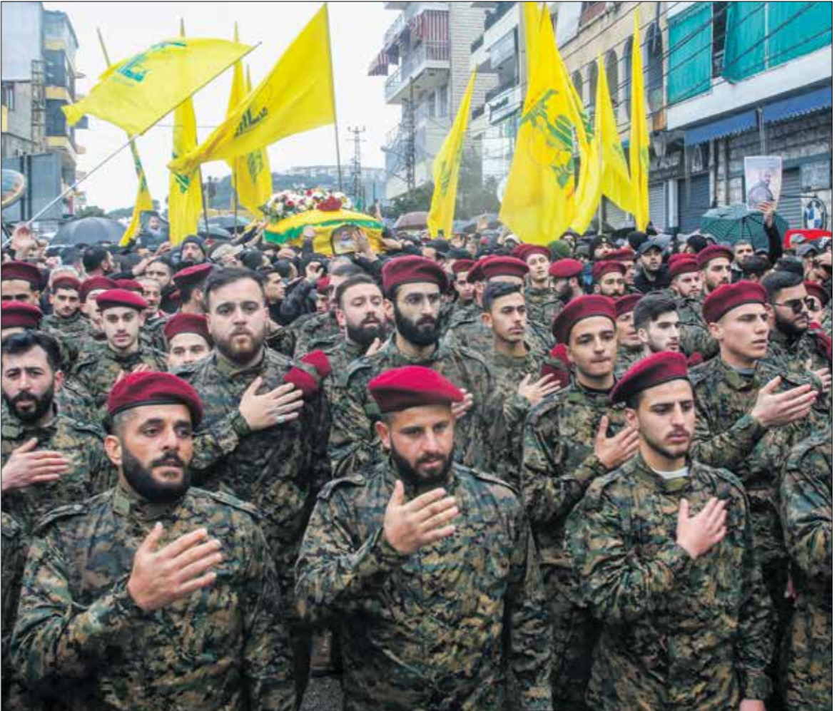
مقاتلون من حزب الله خلال تطبيق الفياضة في الحزب علي الجسب في البنية جنوب لبنان في 16 / 2024

بعد حربها مع العراق 1980-1988، شكّلت سورية حالة الاحتلال الثانية لإيران، التي تحمي نفسها من خلال محاولة نشر هيمنتها (وبالتالي الدرع) في جميع أنحاء المنطقة، وهي خلةً يتم تنفيذها وتقديمها وفق خطّة ترويج الجماعات الشيعية وفق أمر ديني مرتبط بالمرجعية الشيعية في إيران، وبناءً على ذلك، شكّلت جماعات الشيعية المنتشرة جاهدة إلى ضمان موطن قومي دائم لإيران في المنطقة السورية بشكل أساسي، والتي تعتبر سورية للتعلّقات الإقليمية الإيرانية، من خلال فرض النفوذ السياسي والعسكري والديني الإيراني من المناطق والسكان في سورية، من وجهة نظر الواقعية السياسية التي تركز على الوصول إلى السلطة والنفوذ الدولي كاهم أولويات الدول، يرى عالم السياسة كينت والتز أنّ النظام الدولي مناسفة لا مفر منها، إذ تقف قوة كل دولة فقط بالمقارنة مع قوة الدولة الأخرى؛ أي أن اللقاء يحتاج إلى دول رادئة في منطقة الصراع، تسعى نحو تعظيم قوتها من خلال السيطرة على خصومتها وإضعافهم والتحوّل إلى قوة إقليمية وهيمنة وفي حالة السياسة الإقليمية لإيران، بناءً على تحليل الأمانبي فونكر