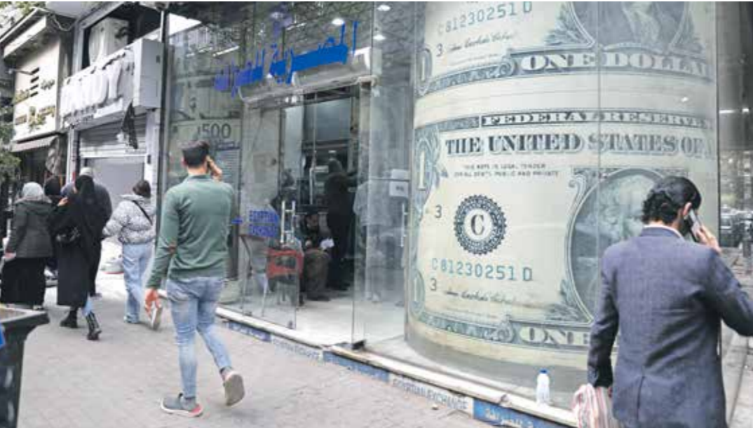
تدهور الجنيه أمام الدولار يزيد مخاوف رجال الصلحة من تضرر الاستثمار (الناظر)

يؤكد الوزير في حوارهِ الصحفي حول مشروع الموازنة، الذي سيفيها للبرنامج خلال أيام، إن الحكومة، ستلتزم بالا تتجاوز الاستثمارات العامة لكافة جهات الدولة بدون استثناء تريليون جنيه خلال السنة المالية المقبلة، لإفساح المجال للقطاع الخاص، تندو تصريحات الوزير متطابقة لتعهدات أعلنها رئيس مجلس الوزراء مصطفى مدبولي، عقب اتفاق مع صندوق النقد الدولي، لتعويم سعر الصرف والحصول على قروض بقيمة 9,2 مليارات دولار، لإنقاذ الاقتصاد المصري من التدهن، مع ذلك تظهر مخاوف رجال الأعمال من أن يتحول القطاع الخاص إلى ضحية مرة أخرى.