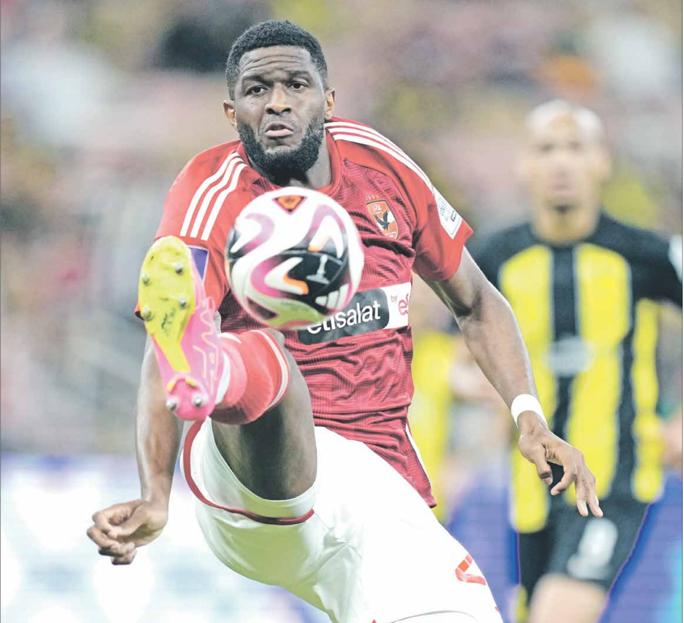
الفرنسي موديسر لم يساعد الأهلي

السبب ضعف إضافة لاعبيه الأجنبي أساسا، ولم تحضر إضافة الكاميروني واسبا إلا في المباريات الأخيرة، بعد أن فقد الفريق فرصة في التأهل ولم يعد يتحكم في مصيره، وهو ما يتخطق على غير أنه فشل أيضا أمام صن داوتن الجنوب افريقي. وقد عُرف الوداد في السنوات الماضية بحسن التعاقد مع الأجنبي في مركز قلب الهجوم، ولكن هذا الأمر انقذف بعد أن سجل هذين فقط خلال 6 مباريات، وهو ما يفسر فشله الكبير.