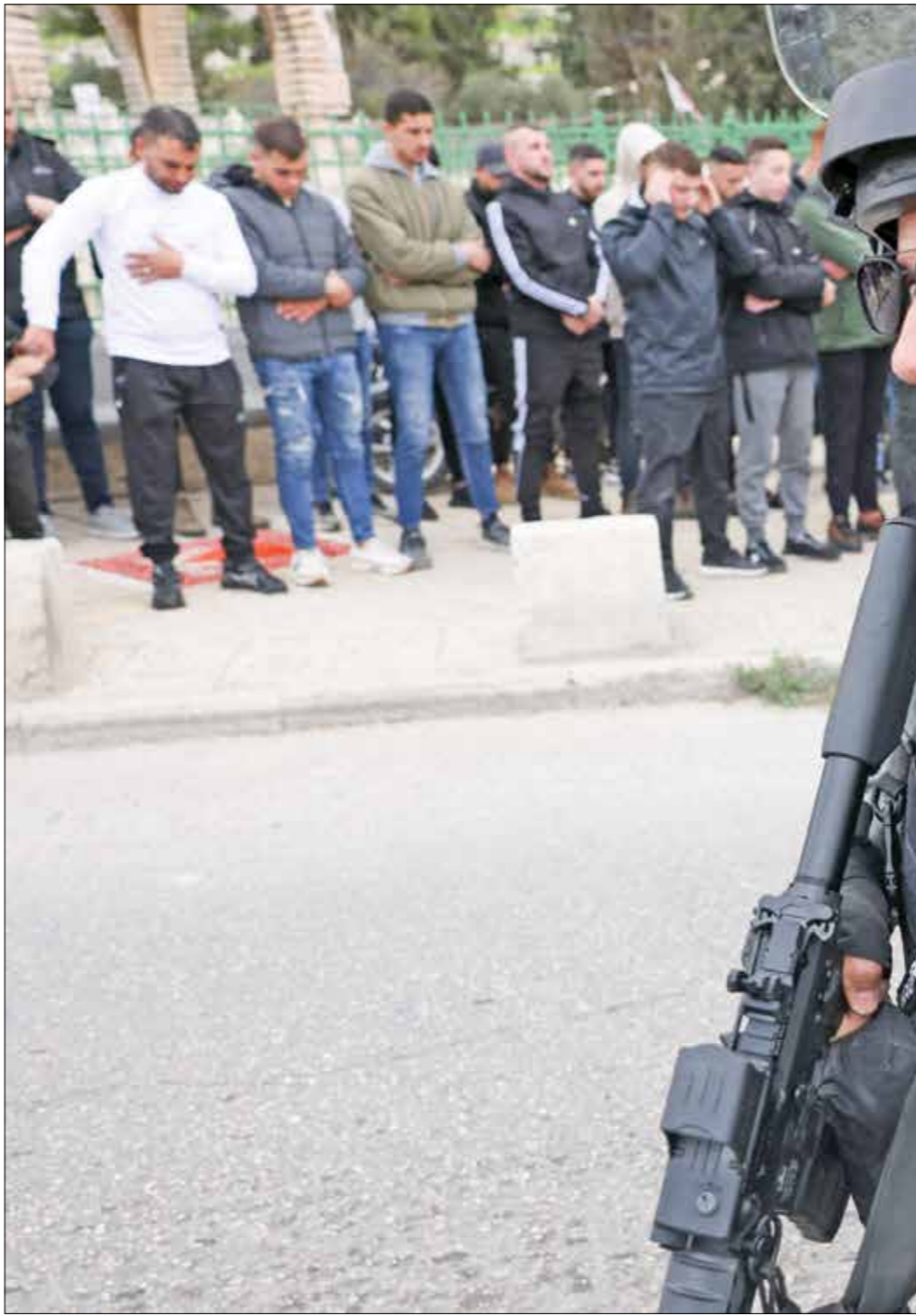
جندي للاحتلال امام شبان ملغوا من الصلاة في الأقصى، 8 مارس

شمال شرق القدس، وتقييد ايديهم للخلف وربطهم بحبل وجرهم بهانة. وكانت إسرائيل رفعت حالة التاهب إلى أعلى المستويات وعلى مختلف الجبهات، في الضفة والقدس والداخل المحتل، مع دخول شهر رمضان، الذي لطما ما دامت سلطاتها على شيطنته قبل الحرب، وبعدها. ودفعت التقييدات جزءا كبيرا من المصلين