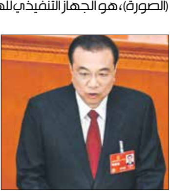
شي في البرلمان الصيني، الائتلاف

مجلس الدولة، أو ما يعرف برئاسة الوزراء التي يتولاها حالياً لي نيشانغ (الصورة)، هو الجهاز التنفيذي لهيئة العليا لسلطة الدولة، وهو أيضا الهيئة العليا لإدارة الجمهورية اللامنيية، ويخضع لرئاسة الوزراء ديوان المجلس و29 وزارة ولجنة ومصلحة حكومية، من بينها المكتب الإعلامي الذي يدير وسائل الإعلام، وجهاز التدقيق والرقابة، وخلال السنوات العتار الماضية شُحِب العديد من صلاحيات المجلس الملصحة بالحزب الشيوعي.