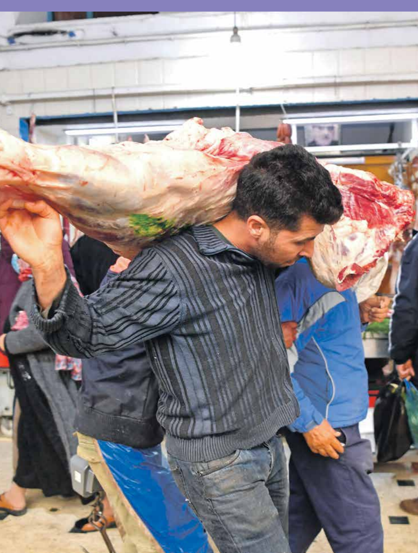
الطلب على اللحوم يزداد بما يقرب الثلث خلال شهر رمضان (تحسين لعيد / فرانس برس)