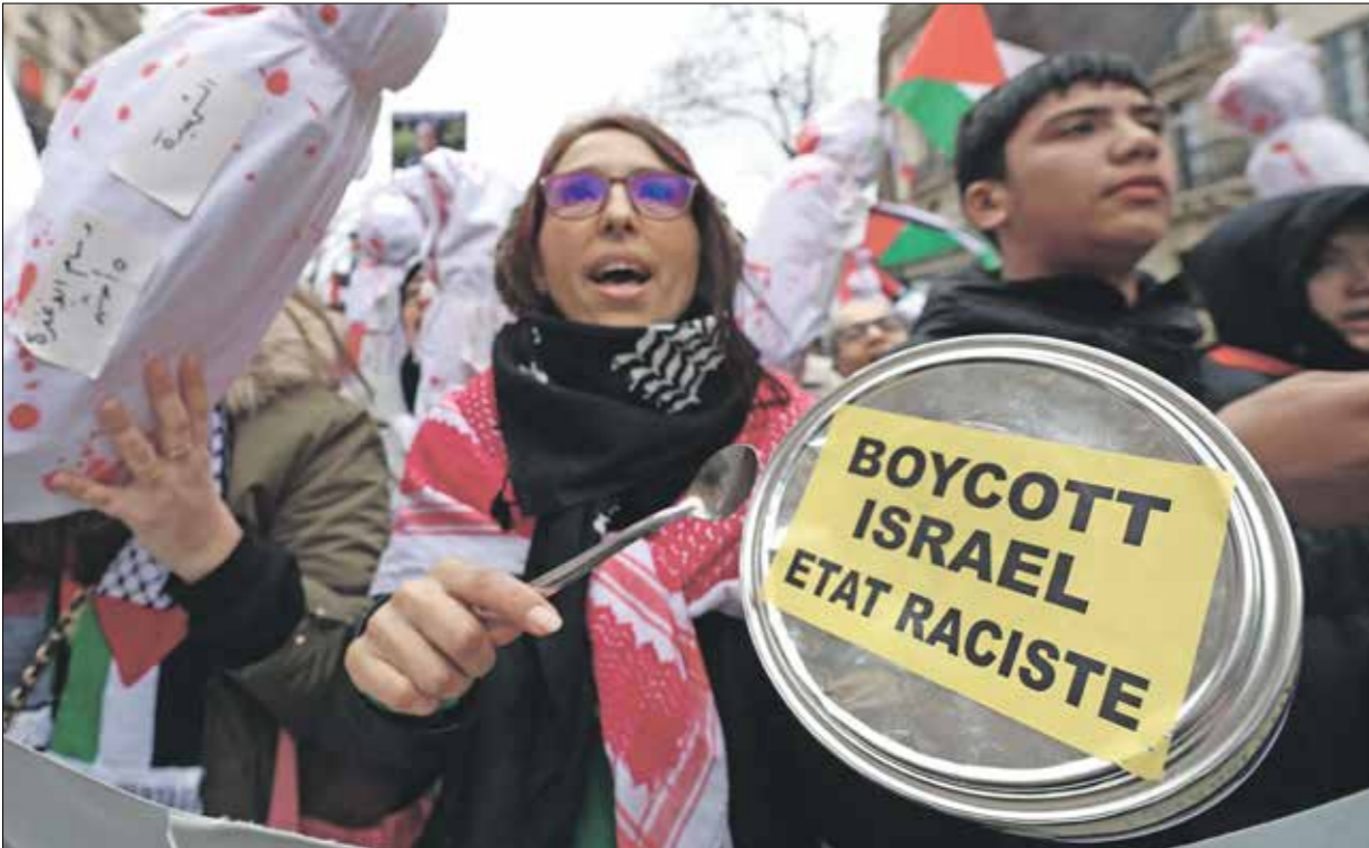
منظاهرة فم باريس

معظم المقالات تصف العدوان بأنه «حرب بين إسرائيل وحماس»