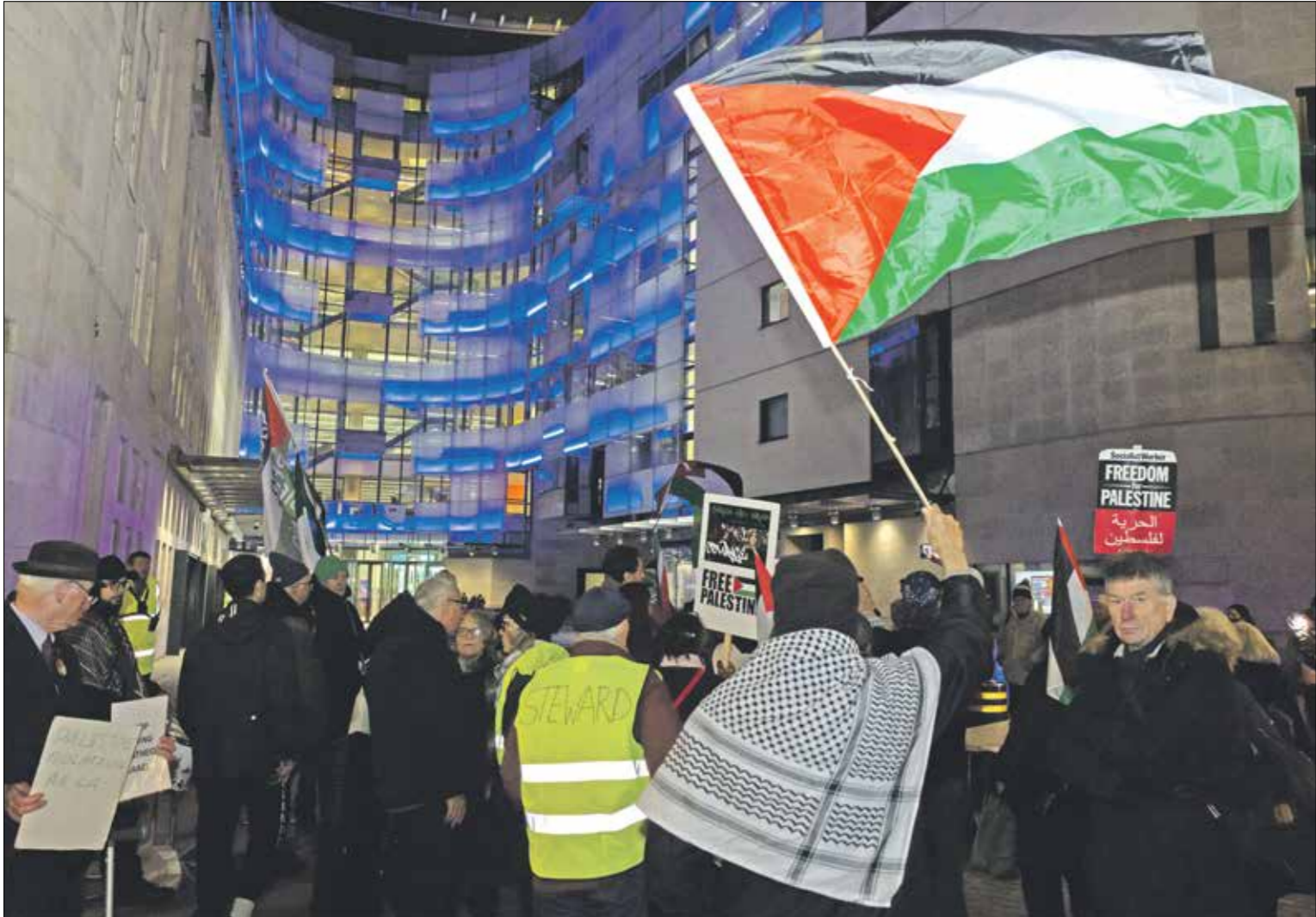
منظاهرة امام مقر «بي بي سي»

يكثر استهلاك التمور في شهر رمضان. وتعدّ دولة الاحتلال الإسرائيلي واحدة من البلدان الشهيرة في زراعة التمور وتصديرها إلى الخارج. بهذا، نُشّت حملة مقاطعة واسعة، عربياً وعالمياً، كي لا يستهلك أحد هذه التمور. بدوره، كما يوضح موقع مسبار للتحقق من الأخبار الزائفة، أن عدد من الحملات تركّزت خلال الأيام القليلة على التمور الإسرائيلية وترويج الشركات الإسرائيلية لها في العالم، وتبين وجود محاولات لتضليل جمهور المقاطعة، بتغيير ملصق بلد المنشأ للمنتجات المحسدة لشهر رمضان، مثل «فطر حساب منظمة أصدقاء الأقصى على منصة إكس، مقطع فيديو في الثامن من مارس الحالي، قالت فيه إن صناديق التمور كُتب عليها أن بلد المنشأ جنوب أفريقيا في حين تعود هذه التمور لشركات إسرائيلية. ضمن محاولات تضليل جمهور المقاطعة لإسرائيل خلال العدوان على غزة». ولم