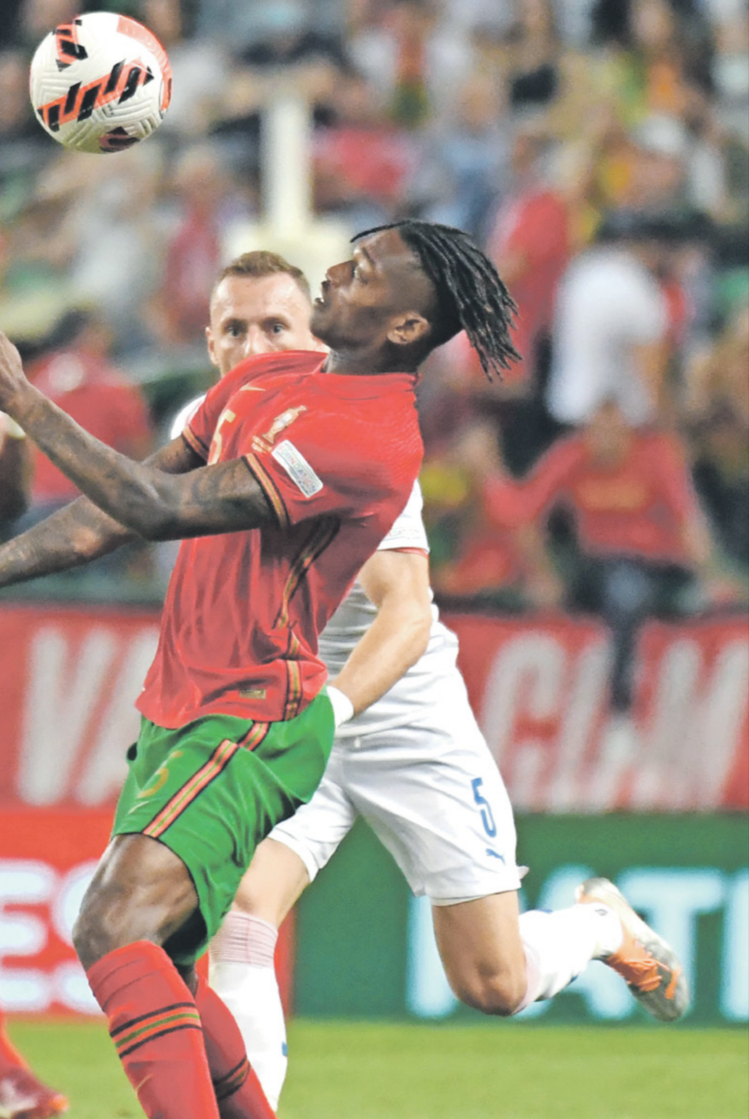
يريد منتخب البرتغال (يمين) للتحقق من الفوز على سلوفينيا وبلوغ النقطة التاسعة، ومواصلة رحلة البحث عن بطاقة التأهل.

لا يمكن لأحد أن يشكك فيها. اعلم الكثير عن كرة القدم، واستدعينا يورينتي لأنه ضمن أفضل اللاعبين (في مركزه)، كما أنه لعب باستمرار». بدوره، طالب بايلو ساراييا، الذي سجل هدف الفوز لمنتخب إسبانيا أمام سويسرا، بعدم الشك في المنتخب والثقة فيه قبل مونديال قطر 2022، مؤكداً