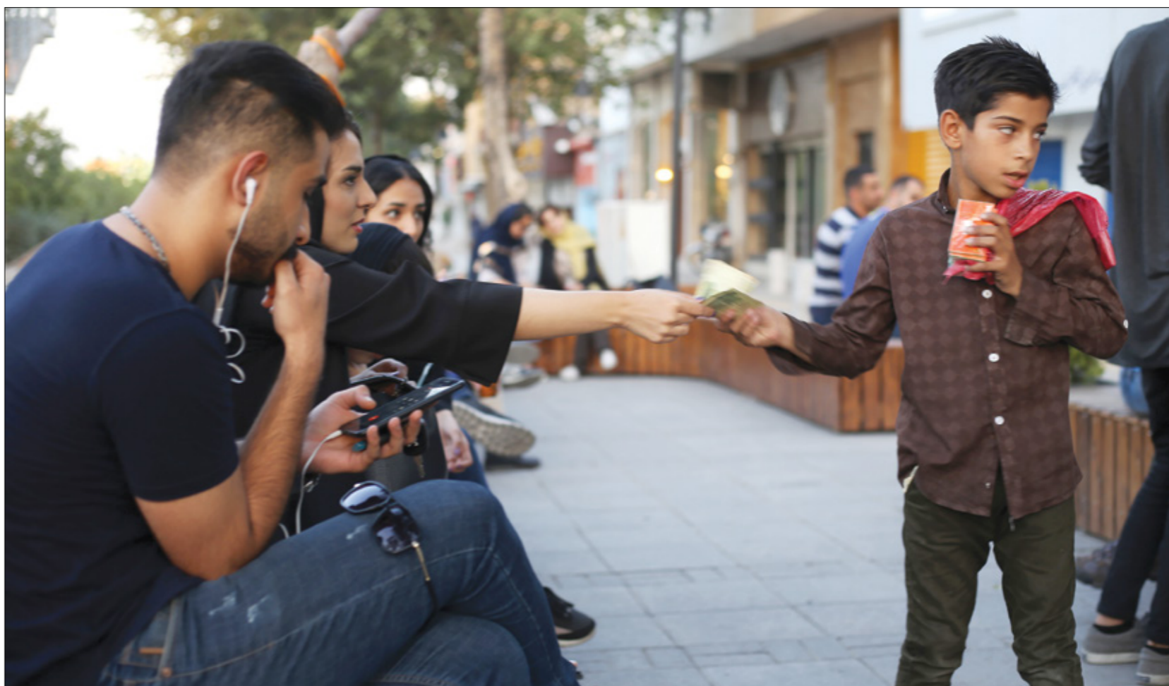
يبيع كعك في إيران