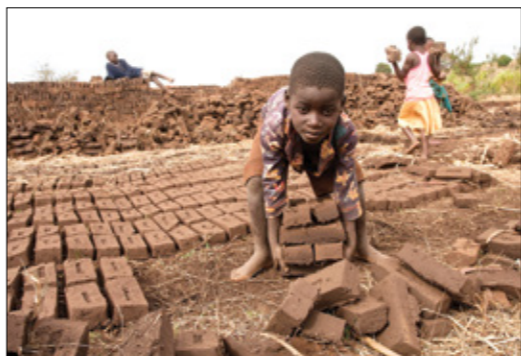
في مصنع اجدار بمالوف