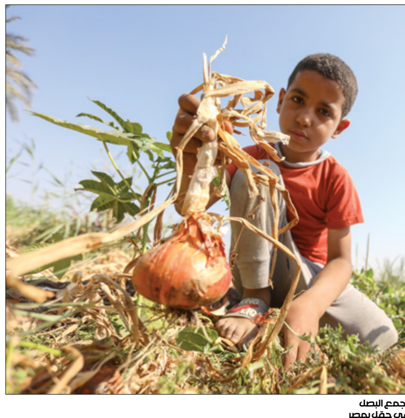
يجمع البصل في حقل بمصر