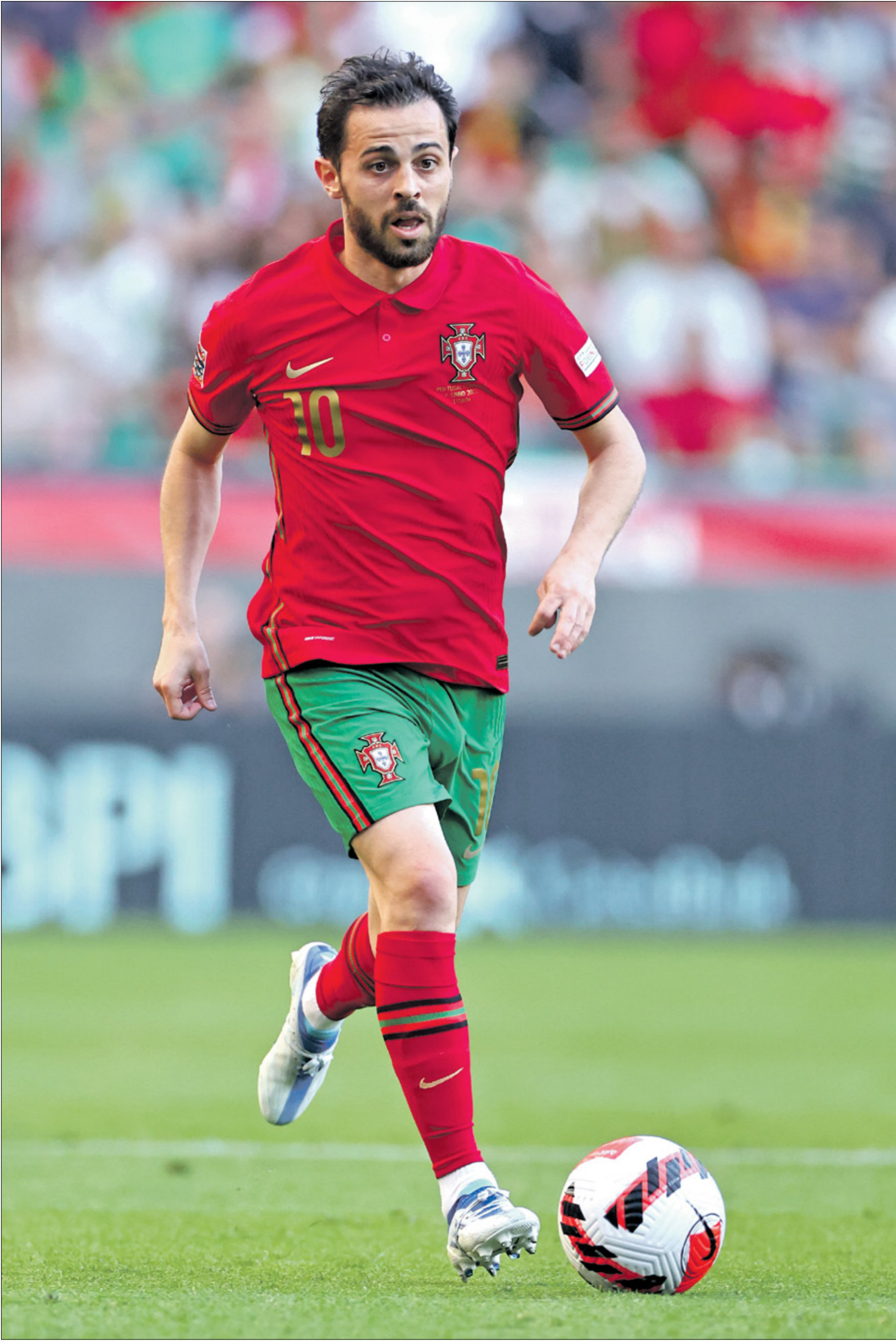
هل يُعاد برناردو سيلفا فريق مانشستر سيتي في ميركاتو الصيف (جاءت/رأيت/ Getty)