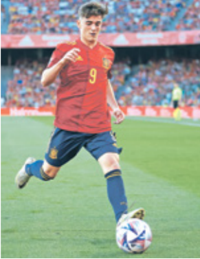
يريد منتخب البرتغال (يمين) للتحقق من الفوز على سلوفينيا (يمين)

بيرو تعلق يوم مباراة الملحق أمام استراليا عطلة رسمية أعلنت حكومة بيرو أن الاثنين الموافق لـ 13 يونيو/حزيران سيكون عطلة رسمية في القطاع العام، لأنه اليوم الذي سيلعب فيه منتخب البلد الأميركي الجنوبي أمام استراليا في الدوحة مباراة الملحق العالمي المؤهلة إلى مونديال قطر 2022. وقال وزير الثقافة اليخاندرو سالاس في تصريحات صحافية إنه «تقرر أن يكون يوم الاثنين عطلة طوال اليوم حتى يتمكن المواطنين من رؤية منتخب بلادهم يتأهل إلى مونديال قطر»، موضحاً أن العطلة ستطبق على القطاع العام، وسيكون بوسع القطاع الخاص تطبيقها اختياريًا. وأوضح المسؤول أن هذا القرار اتخذ الذي أُلجِجَ في جلسة مجلس الوزراء، أتخذ بغرض «أن ينظم المواطنين أنفسهم، وينزأوا إلى الشوارع للتعجم»، وأضاف الوزير: «نعتبر أن المباراة حدث اتحاد وقومية وهوية وطنية».