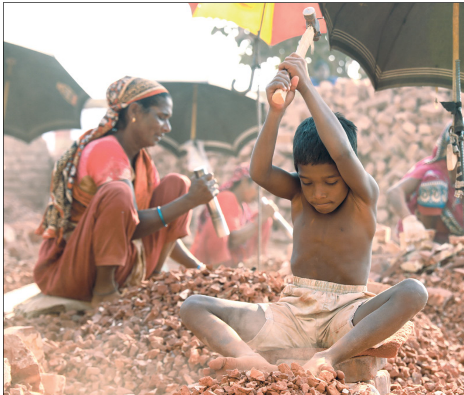
يقطع اجدار الطوب في بنغازي