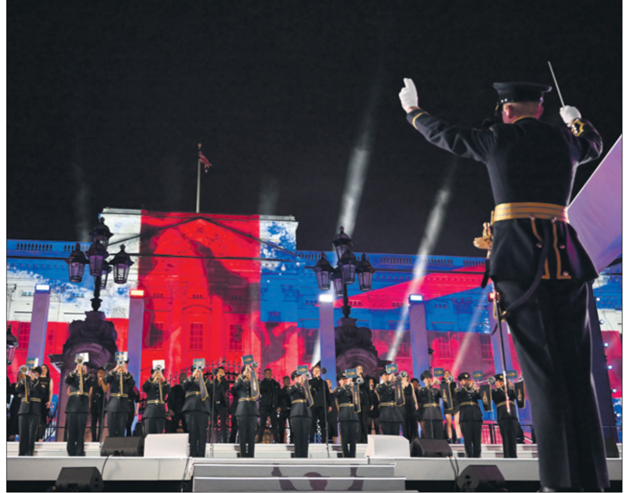
من العروض الاحتفالية

خلال أيام اربعة متتالية من الاحتفالات بمرور الذكرى السبعين على تولي الملكة إليزابيث الثانية منصبها، شهدت لندن عروضاً موسيقية متنوعة، يستعيد بعضها كلاسيكيات من الموسيقى البريطانية، وبعضها الآخر يسعى إلى التماهي مع راهن البلاد التي تعرف تنوعاً شعبياً كبيراً