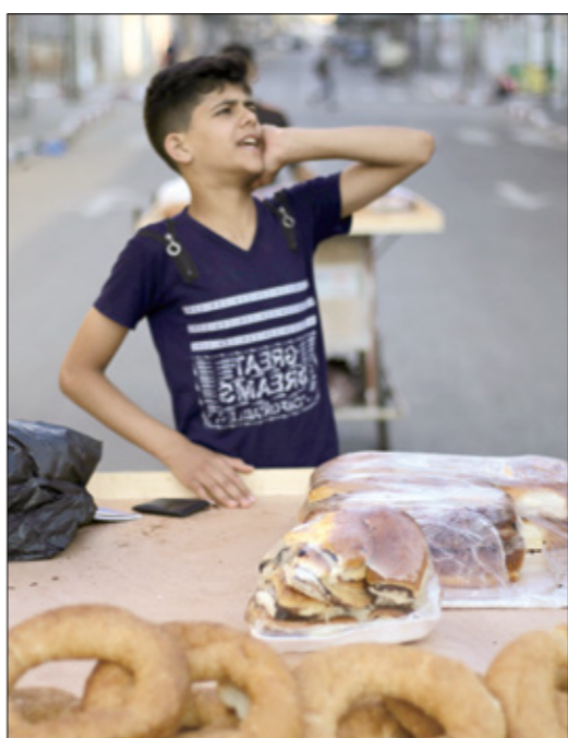
يأخذ على عربة كعك في غزة