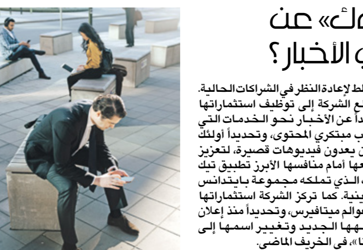
في خدمة «فيسبوك نيوز». وحذرت «وول ستريت جورنال» من أن تراجع «فيسبوك» عن الدفع لناشري الأخبار الأمريكية

توجّه الفرع الفرنسي من قناة آر تي الإخبارية الروسية إلى محكمة أوروبية، الجمعة، لمطالبة في حظر البث المفروض عليها، ضمن عقوبات الاتحاد الأوروبي المفروضة على موسكو بسبب غزوها لأوكرانيا، بحسب ما أفادت به وكالة فرانس برس. كانت وسائل الإعلام الروسية المملوكة من الدولة، والتمتّعة من «آر تي» (روسيا اليوم سابقاً) و«سبوتنيك»، قد تعرّضت لحظر بثها التلفزيوني وعلى الإنترنت في الاتحاد الأوروبي. منذ 2 مارس/ آذار الماضي، وبتهمة نشر معلومات مضلّلة، على خلفية الإجتياح الروسي لأوكرانيا. ورفض وزير خارجية الاتحاد الأوروبي جوزيب بوريل، في مارس، الاتهامات بأن التكتل الأوروبي يقطع حرية الإعلام، وقال أمام البرلمان الأوروبي: «إنها ليست وسائل إعلام مستقلة، إنها أسلحة في نظام التلاعب الذي يعتمده الكرملين».