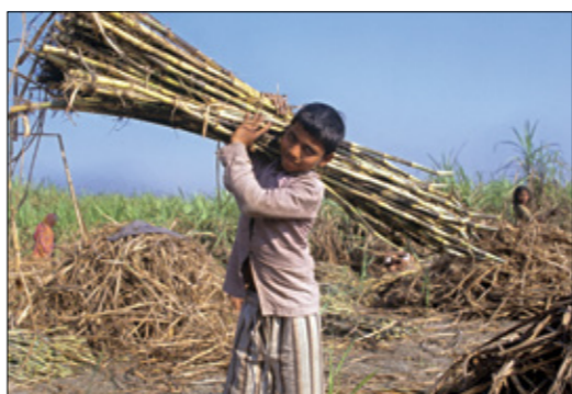
يحمل كومة اعصاب بسطة في الهد