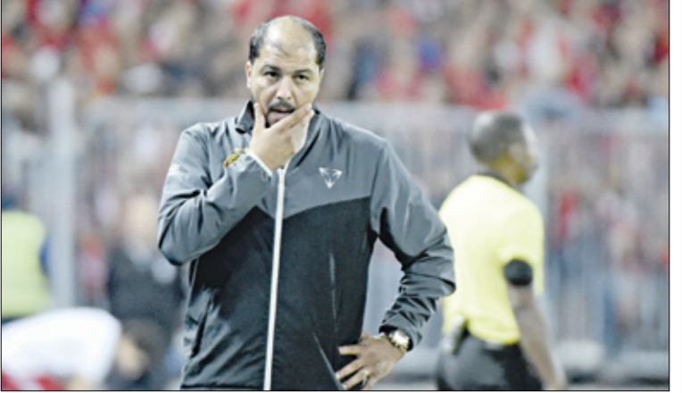
صبي الشعباني يهتف إلى تحفيظ نتيجة إيجابية في الذهاب