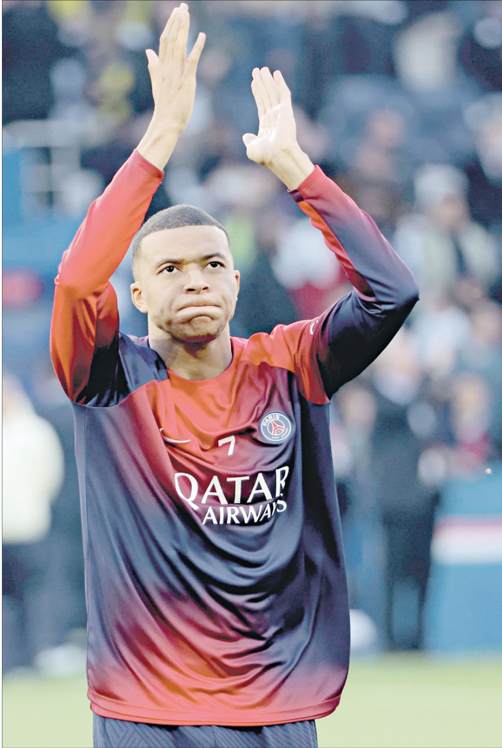
لم يكشف مبابي بعد عن ناديهِ الجديد بعد باريس سان جيرمان

يعتزم كيليان مبابي الرحيل عن باريس سان جيرمان في نهاية الموسم الحالي للعب خارج فرنسا، وفقا لما أعلنه رسمياً في مقطع فيديو نشر على الشبكات الاجتماعية، لكنه لم يعلن عن ناديهِ المقبل. وقال مهاجم باريس سان جيرمان والمنتخب الفرنسي «أود إبلاغ الجميع أن هذا آخر عام لي في باريس سان جيرمان. لن أجدد العقد، وسأنتهي مغامرتي في الأسابيع المقبلة. سأخوض آخر مباراة لي على ملعب الأمراء الأحد المقبل».