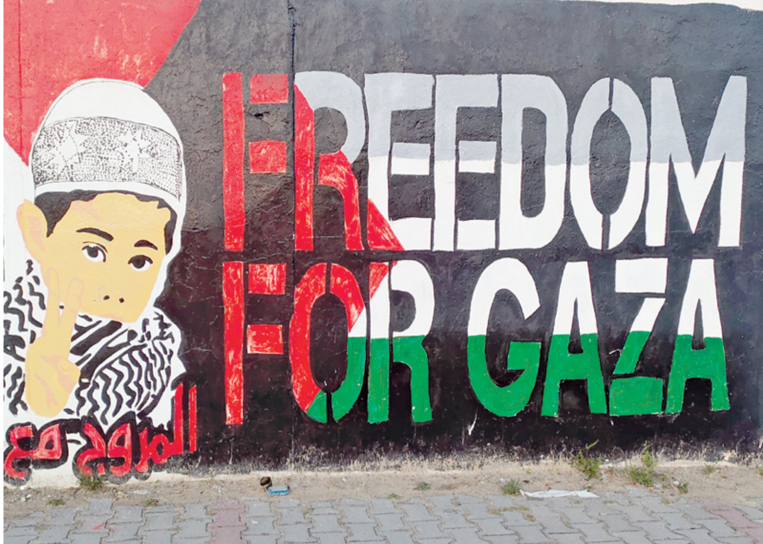
فن شوارع العاصمة النوبية (العرين/ الحديد)

هكذا شاهدنا التلفزيونات اللبنانية التي غاب الإشارات الضرورية إلى التنبيه الذي يسبق عرض هذه البرامج، في بداية القرن