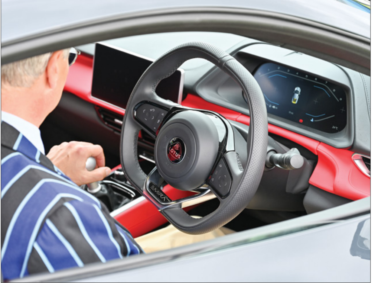
سيارة Lotus Emira الفاخرة خالك معرض Salon Privé 2023 في قصر بيلهيام في وودستوك، انكلترا. 1 سبتمبر 2023

سبق أن وعدت «كاديلاك» بأن تصبح سياراتها كهربائية بنسبة 100% بحلول عام 2030. لكن يبدو الآن أنها تتراجع قليلاً ففي حديث الصحافيين قبل أيام، صرح نائب رئيسها العالمي جون روث بأن السيارات الكهربائية وسيارات الاحتراق الداخلي «سوف تتعايش لعدد من السنوات، لكنه لم يصل إلى حد تقديم جدول زمني واضح، وفقاً لما أوردت المجلة المتخصصة «موتور» نقلاً عن صحفية «تقارير فري برس»، التي قال لها روث إن «التي، التي الجديدة التي تعلمت خلال أكثر من 30 عاماً من عمري حول صناعة السيارات هو أن هذه الصناعة لا تتبع خطاً مستقيماً ولا توجد حقائق مطلقة.»