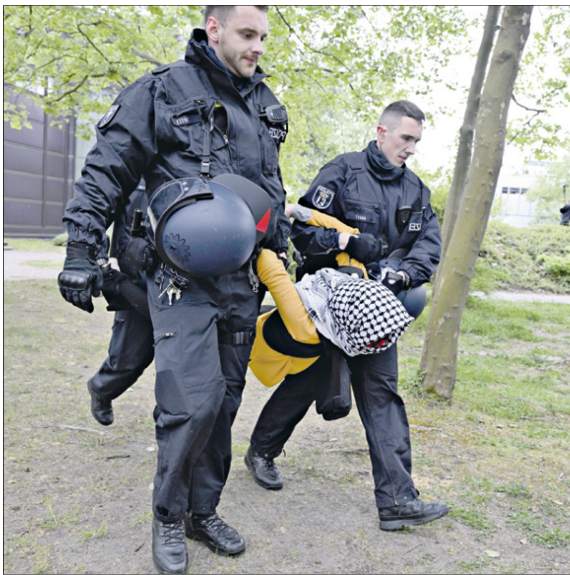
اعتقال طالبة جامعية فلسطينية مع فلسطين في برلين، مايو 2024 (الناضون)

إن الحرب الإسرائيلية «ترقى إلى حد الإبادة الجماعية»، ودعت الدول إلى فرض عقوبات وحظر أسلحة على الفور. وفي المقال نفسه، يغيب الصوت الفلسطيني من صوت الطلاب المحتجين بشكل كامل، فيستند إلى تصريح من الشرطة الألمانية، ثم إدانة وزير العلوم في ولاية سكسونيا