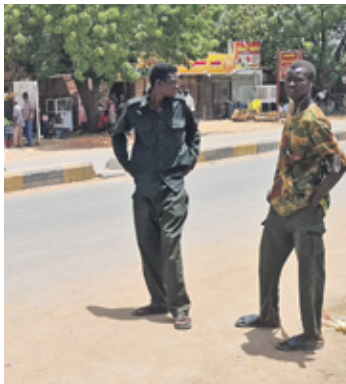
عنصران من قوات الأمن السودانية في الخرطوم مايو 2023

تشير المواقف المتباينة من «ميثاق السودان لإدارة الفترة الانتقالية التأسيسية وإنهاء الحرب» الموقف أخيراً في القاهرة إلى حجم الانقسامات في مقاربات القوى السياسية بشأن وقف الحرب والمستقبل السياسي للسودان