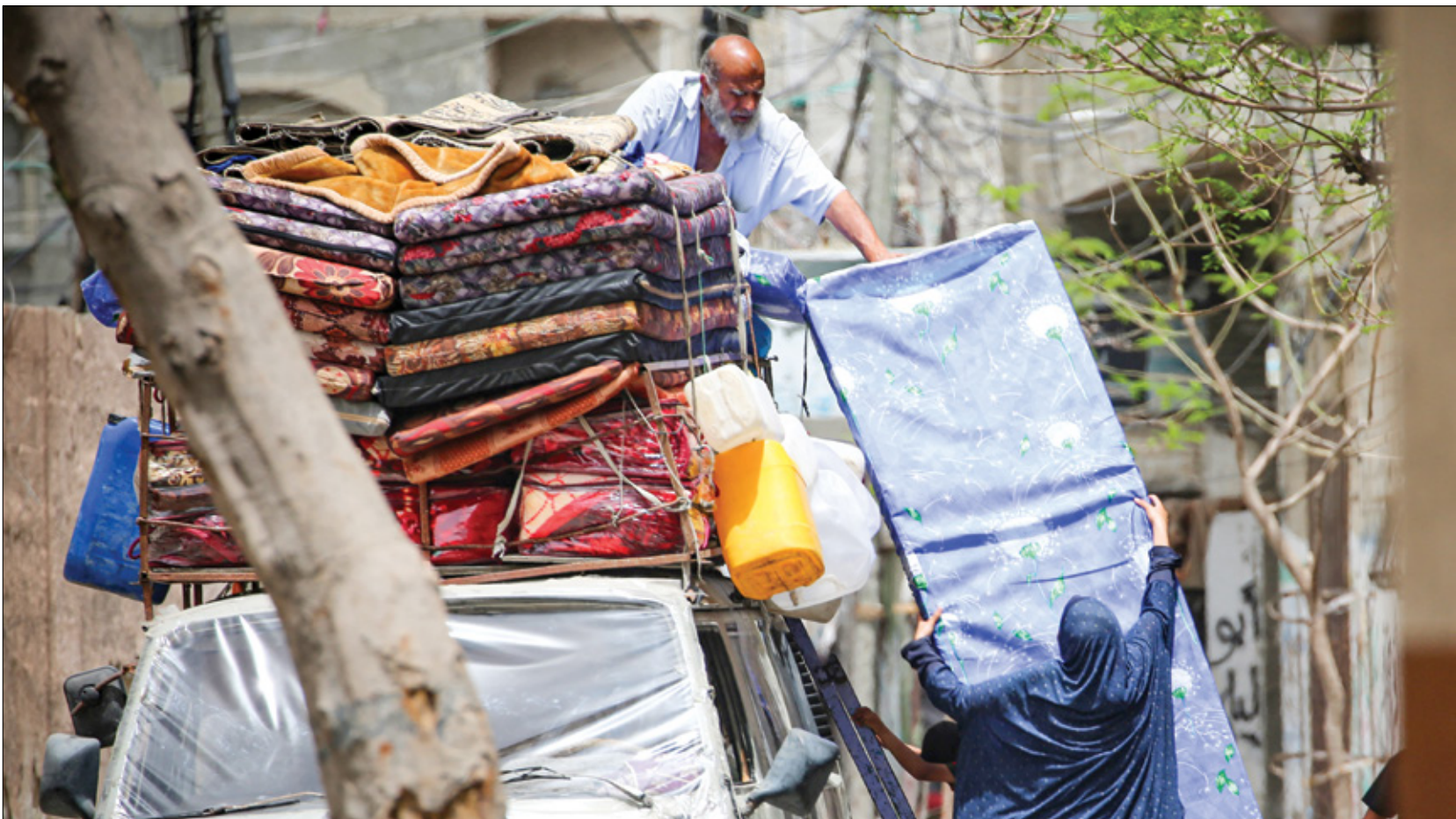
بيلتان ما يتسرع من فرش واعراض احرش