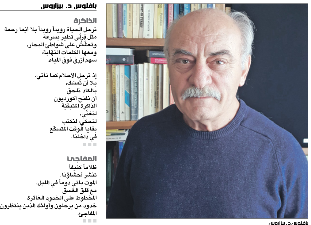
بالموس د. بيراروس