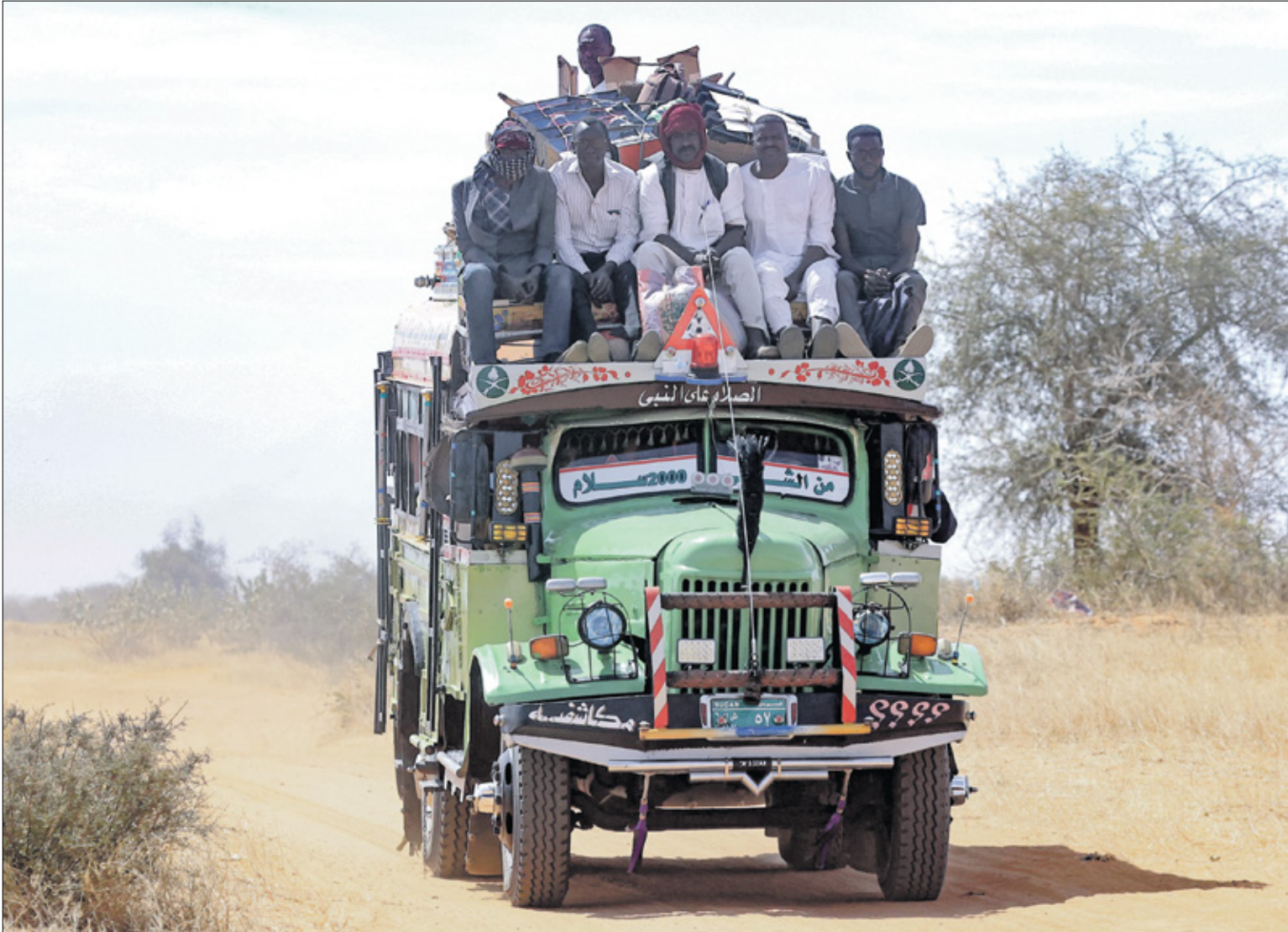
سودانيون شرقية مدينة الأبيض، يناير 2023