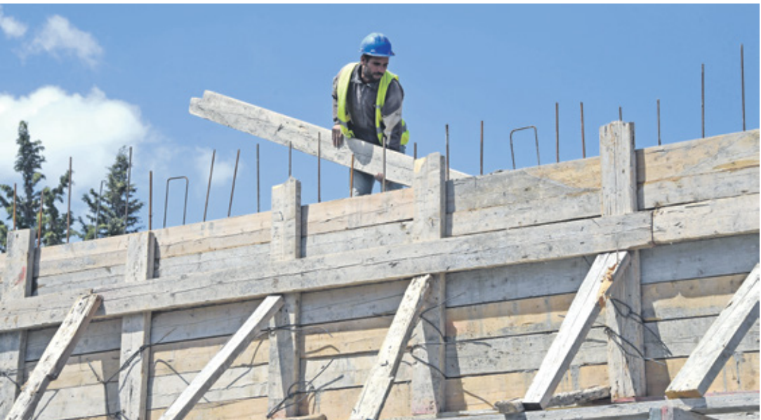
عامل بناء يد أحد مواقع البناء في العاصمة تونس، 21 يونيو 2016

وعلى امتداد العقود الأولى التي قلت استقلال البلاد عام 1956، انتفع التونسيون من اصحاب الدخل المتوسط والمحدود من مشاريع السكن الاجتماعي التي أطلقتها الدولة عن طريق شركات التطوير الحكومية، غير أن هذا الدور انحسر كثيرا خلال السنوات الأخيرة رغم محاولات عدة لإنعاشه. وفي إيريل/ نيسان الماضي، أقرت وزيرة التجهيز