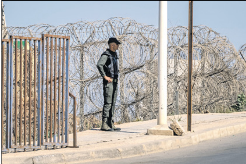
عنصر أمن مغربي على الحدود مع مليوية. 2022