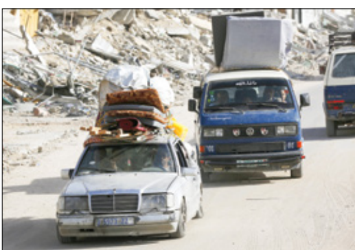
تهجير وسط الحمار (أشرف أبو حمزة، الناضون)