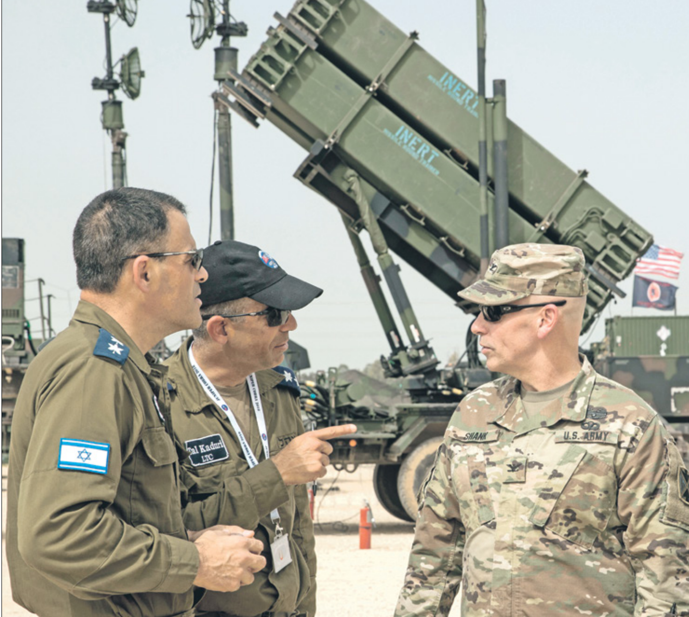
ضباط أميركيون وإسرائيليوه في إسرائيل، مارس 2018

ووفقاً للتقرير، فإنه في الفترة التي تلت السابع من أكتوبر الماضي، فإن إسرائيل الم تتعاون بشكل كامل مع الجهود الأميركية وغيرها من الجهود الدورية لتوصيل المساعدات الإنسانية إلى غزة، لكنه اعتبر أن هذا الأمر لا يرقى إلى مستوى انتهاك القانون الأميركي الذي يمنع عدم الدول التي تعزل المساعدات الإنسانية إلى المدنيين، وقال: «ما لا يمكن إنكاره هو حقيقة أنه خلال الجزء الأكبر من الفترة منذ السابع من أكتوبر، قدمت حكومة نتنياهو تدفق مساعدات إنسانية»، وقال أحد مساعدي عضو في الكونغرس، وهو يعمل في الشؤون الخارجية، لوضع وزارة الخارجية يعكس إدارة التي تواصلت إلى الفرية لا تنفي بالضرورة التزام إسرائيل بالقانون الإنساني الدولي طالما أنها تتخذ خطوات لتحقيق ومحااسبة المخالفين. وأضاف: «علق إسرائيل بشأن مثل هذه الحوات يعكس في حقيقة إن لديها عدداً من التحقيقات الداخلية الجارية». وأشارت صحيفة واشنطن بوست إلى أن التقرير أثار انتقادات، حيث وصفه البعض بأنه يفترق إلى الوضوح الأخلاقي بشأن