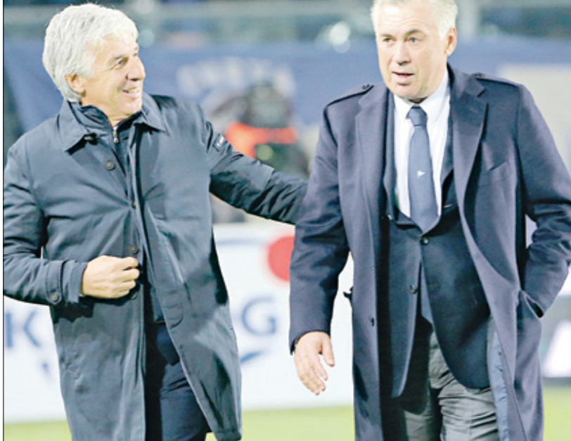
أنشيلوتي (يمين) وغاسبريني من مواجهة سابقة في بطولة الدور الإيطالي

ومن المتوقع أن يكون للمدرب إيتاليانو مستقبل رائع في كرة القدم الإيطالية، خصوصاً مع الأفكار الغنية التي أظهرها على أرض الملعب مع فريق فيورنتينا، ووصوله إلى المباراة النهائية لبطولة دوري المؤتمرات الأوروبي، بثبت امتلاكه شخصية قيادية، قد تساهم في انتقاله لتدريب فريق إيطالي كبير، بعد نهاية رحلته مع نادي فيورنتينا.