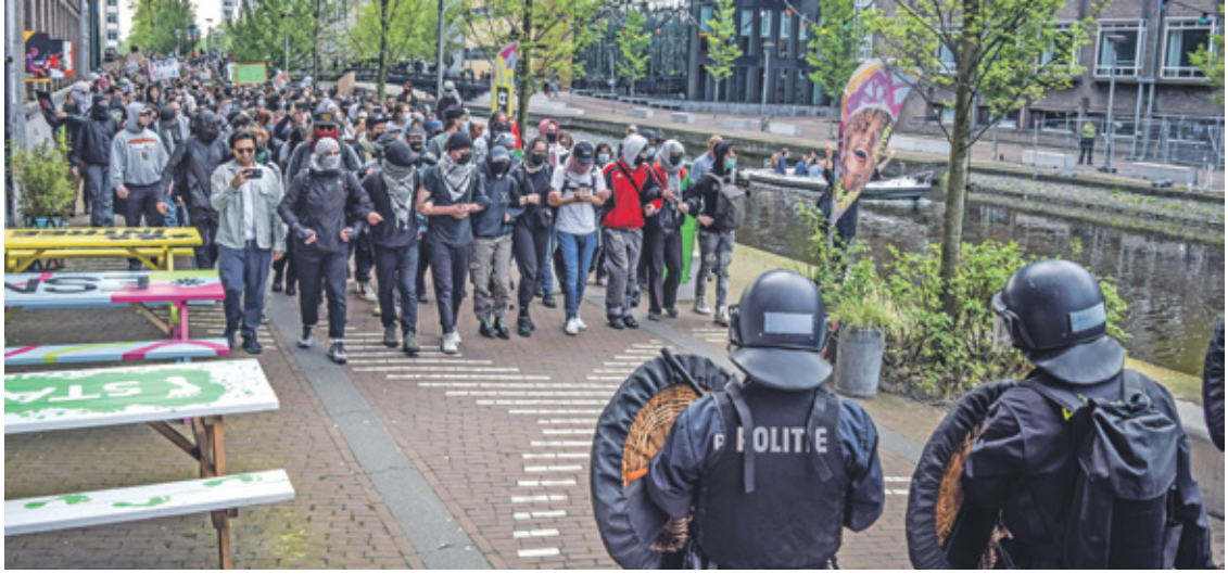
إجراءات أمنية امام مسيرة طلاب الخمس الماضي، بعد أيام من تفكيك اعتصام الطلاب (مليبي توب/الناضول)

المزدودة بمعدات مكافحة الشغب، الغاز المسيل للدموع، في وقت متأخر من الخميس الماضي، على المظاهرين قبل تفكك الخيم الذي ضم حواجز خشبية وبلاستيكية، في موازاة ذلك، قال المرصد الأورومتوسطي لحقوق الإنسان، في بيان أمس السبت، إن «الاحتجاجات الطلابية السلمية والمخيمات المتنتشرة في جميع أنحاء أوروبا» قوبلت بحملات المزدودة بمعدات مكافحة الشغب، الغاز المسيل للدموع، في وقت متأخر من الخميس الماضي، على المظاهرين قبل تفكك الخيم الذي ضم حواجز خشبية وبلاستيكية، في موازاة ذلك، قال المرصد الأورومتوسطي لحقوق الإنسان، في بيان أمس السبت، إن «الاحتجاجات الطلابية السلمية والمخيمات المتنتشرة في جميع أنحاء أوروبا» قوبلت بحملات المزدودة بمعدات مكافحة الشغب، الغاز المسيل للدموع، في وقت متأخر من الخميس الماضي، على المظاهرين قبل تفكك الخيم الذي ضم حواجز خشبية وبلاستيكية، في موازاة ذلك، قال المرصد الأورومتوسطي لحقوق الإنسان، في بيان أمس السبت، إن «الاحتجاجات الطلابية السلمية والمخيمات المتنتشرة في جميع أنحاء أوروبا» قوبلت بحملات المزدودة بمعدات مكافحة الشغب، الغاز المسيل للدموع، في وقت متأخر من الخميس الماضي، على المظاهرين قبل تفكك الخيم الذي ضم حواجز خشبية وبلاستيكية، في موازاة ذلك، قال المرصد الأورومتوسطي لحقوق الإنسان، في بيان أمس السبت، إن «الاحتجاجات الطلابية السلمية والمخيمات المتنتشرة في جميع أنحاء أوروبا» قوبلت بحملات