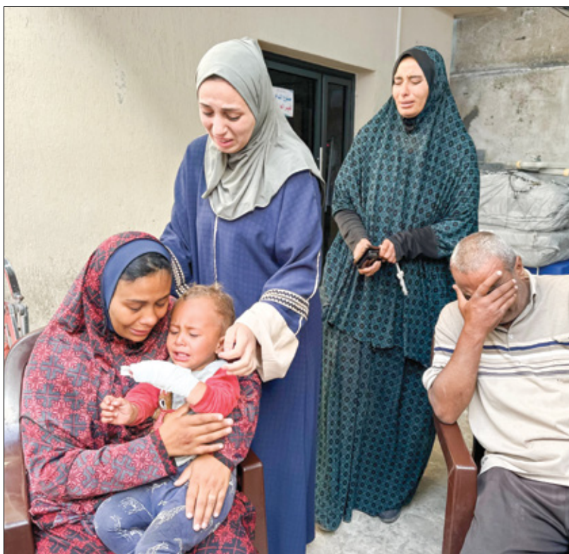
وجع فراف الأبدية جراء اقتحام ربح (دعاء إيلز، الناضون)

احتجاز المنظمات الإنسانية والإغاثية في وصف المعاناة الإنسانية التي تواجه أهالي قطاع غزة يومياً، وبدلاً من الاستجابة لمطالبها المتكررة منذ بدء العدوان الإسرائيلي في السابع من أكتوبر/ تشرين الأول الماضي، يستمر الاحتلال في عملياته العسكرية وقتل المدنيين وتهجير الأهالي من مكان إلى آخر، وكانت إسرائيل قد أعلنت، يوم الثلاثاء الماضي، اجتياح الجانب الفلسطيني من معبر رفح البري بين قطاع غزة ومصر، في إطار ما تزعم أنها «عملية الردعة أقصى جنوبي القطاع منذ الإثنين الماضي، علماً أنها شملت توغلات برية وغارات جوية. تظهر الصور الغزيين يحملون القليل من الأغراض التي تمكنوا من جلبها معهم من مكان إلى آخر، بالإضافة إلى الخيام لوضعها في الأماكن الجديدة التي سيحتفلون إليها. بداية، من دير البلح وخانيونس إلى رفح، ثم من رفح إلى دير البلح وخانيونس. في كل مرة ينتقلون إلى مكان أضيّق من الذي قبله، بعدما خسروا بيوتهم وكل ما يملكون. وربما لا يعرف البعض حتى الآن في ما إذا كانت بيوتهم صالحة للسكن أو أنها دمرت كلياً. يوماً بعد يوم، تزداد أعداد المهجرين من رفح، وإن كانوا يدركون أنهم قد لا يجدون مكاناً لنصب خيامهم المهيمنة، إلا أن الخيارات باتت ضيقة تماماً، ويبقى لهم الأمل بالا بلحل الأسوأ» (العربي الجديد)