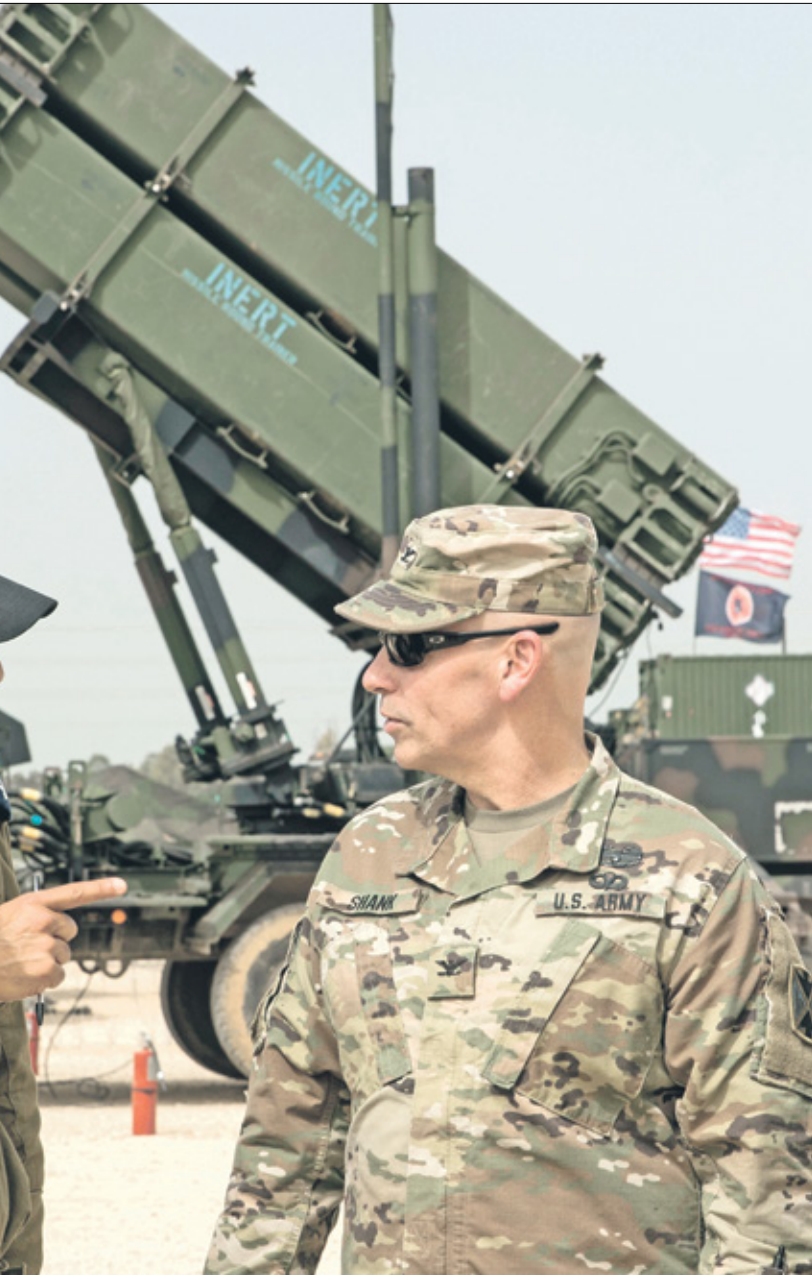
ضباط أميركيون وإسرائيليوه في إسرائيل، مارس 2018

أن آيه الإنسانية، شُترته أول من أمس، عن وزير الخارجية الإسباني خوسيه مانويل باروس، قوله إن مدريد مستعتر