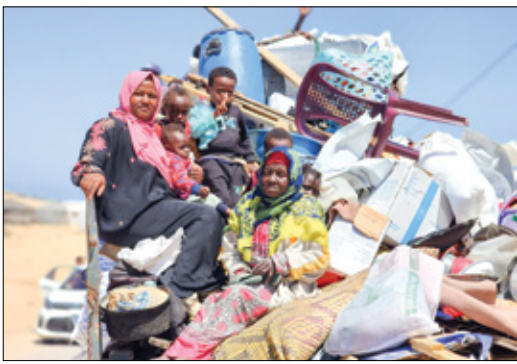
بصوت نسمع الصرة ألماني الشارع (الناضون)