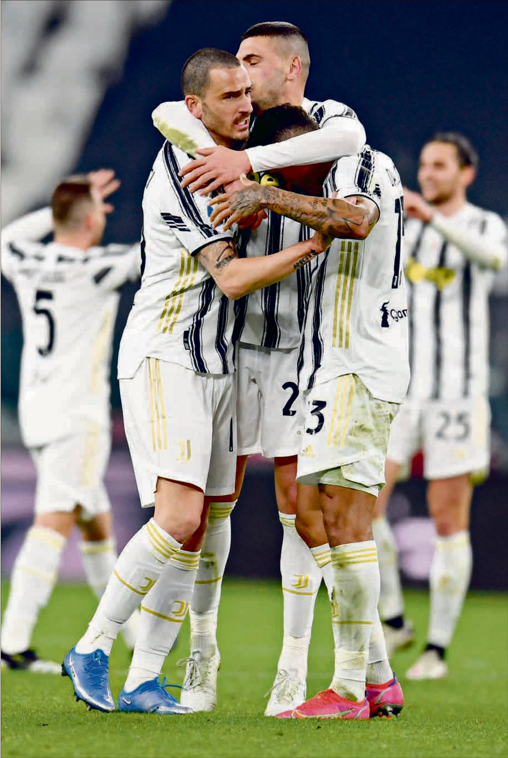
يوفنتوس فهدد قبل بداية الموسم القادم

أكد رئيس الاتحاد الإيطالي لكرة القدم، غابرييلي غرافينا، أنه سيتم استبعاد فريق يوفنتوس عن اللعب في الدوري إذا لم يلتزم باللوائح ولم يتراجع عن فكرة المشاركة في بطولة دوري السوبر الأوروبي. وقال غرافينا خلال مؤتمر صحفي: «عندما تطالب الاندية بالمشاركة في الدوري الإيطالي لكرة القدم فعليها ان تقبل بلوائح المنظمات الدولية. وبالطبع، إذا لم يوافق عليها يوفنتوس، فسيتم استبعاده عن المسابقة».