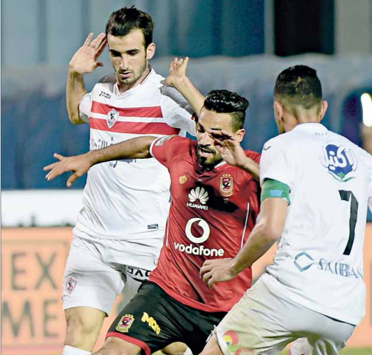
التعادل المهم قمة الفريقين في الدوري المصري

وجاء الشوط الأول متوسط المستوى، إذ بدأ قويا في أول 25 دقيقة، هدد خلاله الأهلي المرمى بفرصتين عبر محمد شريف وحسين الشحات؛ مرت الأولى بجانب المرمى وتصدى للثانية محمد عواد حارس المرمى، وفرصة للزمالك عبر محمود عبد الرزق شيكابالا من تسديدة قوية تصدى لها حارس الشناوي وفشل معها أشرف بن شرقي في المتابعة وأهدر هو الآخر بدوره فرصة إضافية، بعدما غابت الخطورة على المرمى، وانحصرت الكرة في الوسط، وسط مخاوف من جانب الفريقين، وقبل نهاية الشوط الأول قاد