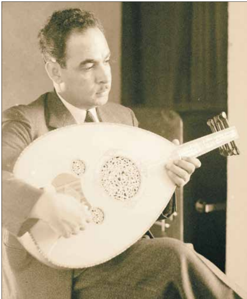
عازف عود فلسطيني في إذاعة القدس عام 1936

اجتذب إليه كثير من وجوه الغناء في العالم العربي، ومنهم من صنع شهرته انطلاقاً منها، مثل: محمد عبد المطلب، الذي لم تلق حملاته الأولى في مصر أي نجاح، فانقلت إلى باقا والقدس ليحصد من خلال حملاته وتسجيلاته هناك نجاحاً كبيراً.