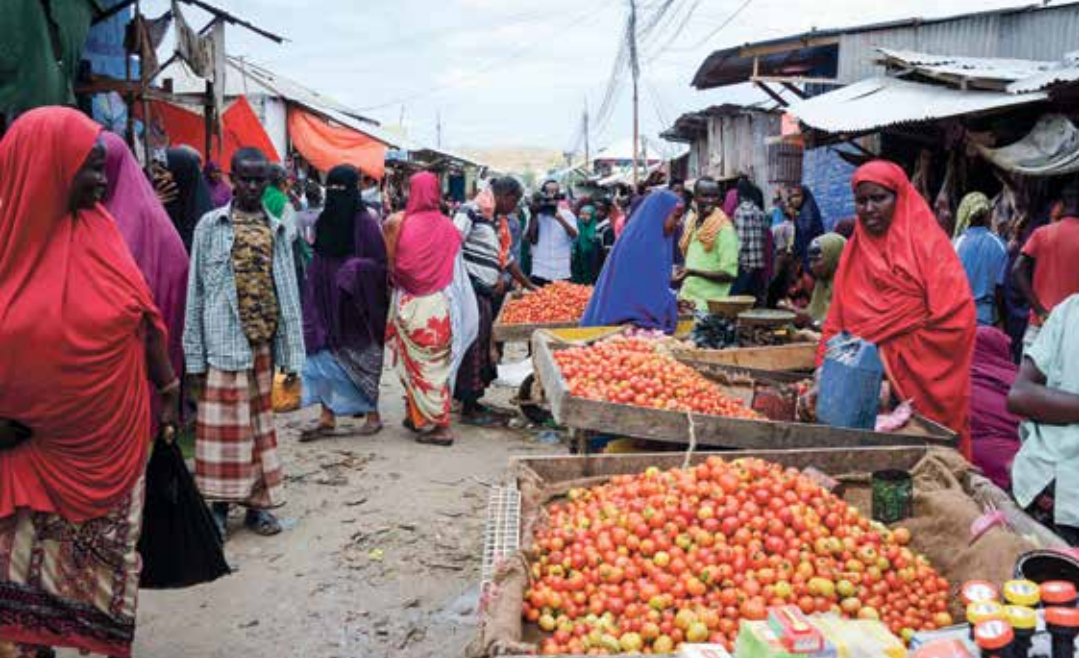
صغوف على حواكبة الأسر

وتكشف مصدر صومالي في وزارة الخارجية والشعوان الدولي لـ «العربي الجديد» أن الوزارة لاحظت انخفاضاً في حجم التحويلات المالية بناءً على التقارير الواردة والتحريات التي أجرتها مع عدد من المسؤولين في قطاع الحوالات في البلاد. كما تراجع مبادرات منظمات الشتات التي تطلق عادة حملات خيرية للاسر الفقيرة، بسبب عدم قدرتها على جمع التبرعات بسبب كورونا. وفي هذا الصدد، قال عديي إسماعيل، وهو فني صومالي يعمل في مجال الترفيه ويعيش في السويد في حديث مع «العربي الجديد» إنه «لم يعد باستطاعتي إرسال الأموال بنفس الغدر كل شهر إلى أهلي في البلاد، لأنني فقدت وظيفتي