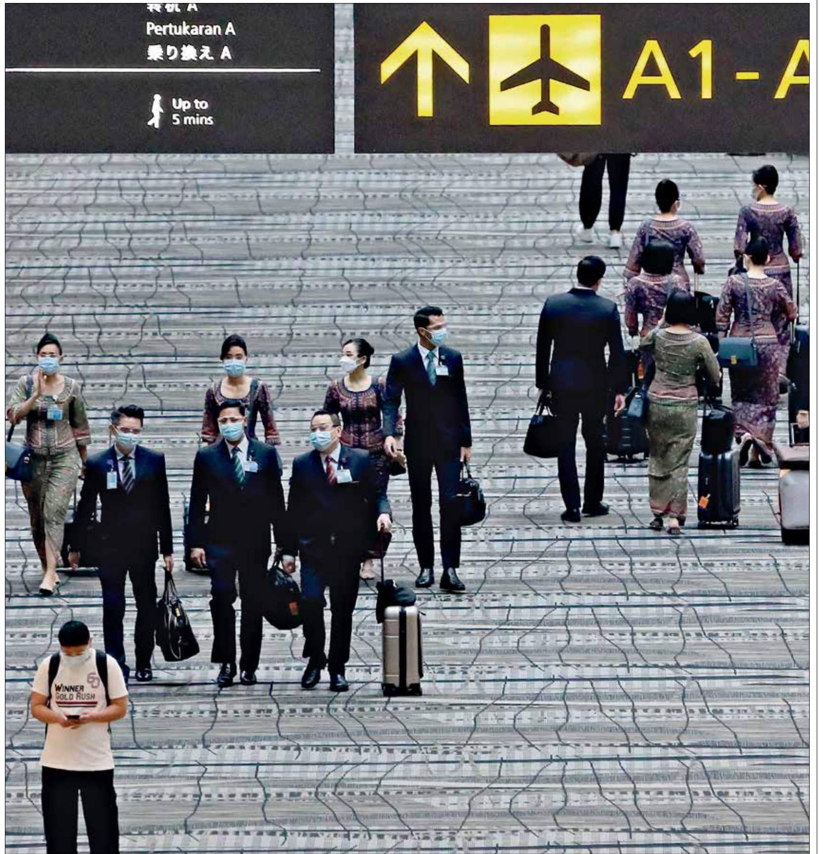
(سهيم عبد الله / Getty)

التاسعة صباحاً ولغاية 15 أكتوبر/تشرين الأول المقبل الساعة 12 ليلاً مع إمكانية التحديث من أجل تحميل بطاقة الهوية لغاية 31 ديسمبر/كانون الأول 2021. وأشار نعمة إلى أن المستفيدين الذين لا تحقق لهم الاستفادة من مشروع الدعم، «جميع أفراد الأسرة اللبنانية المقيمين حالياً في لبنان لفترة تقل عن 60 يوماً متواصلة في العام باستثناء من هم دون سن 23 عاماً، الأسرة التي يفوق دخلها السنوي الإجمالي مهما كان مصدره 10 آلاف دولار أو ما يعادلها بحسب سعر الصرف في السوق الموازية، العائلة التي يفوق إجمالي ودائعها المصرفية مبلغ 10 آلاف دولار أو ما يعادلها بحسب سعر الصرف في السوق الموازية، ما يعني 200 مليون ليرة لبنانية على سعر صرف 20 ألف ليرة لبنانية تعادل وديعة مصرفية بقيمة تقريبية 50