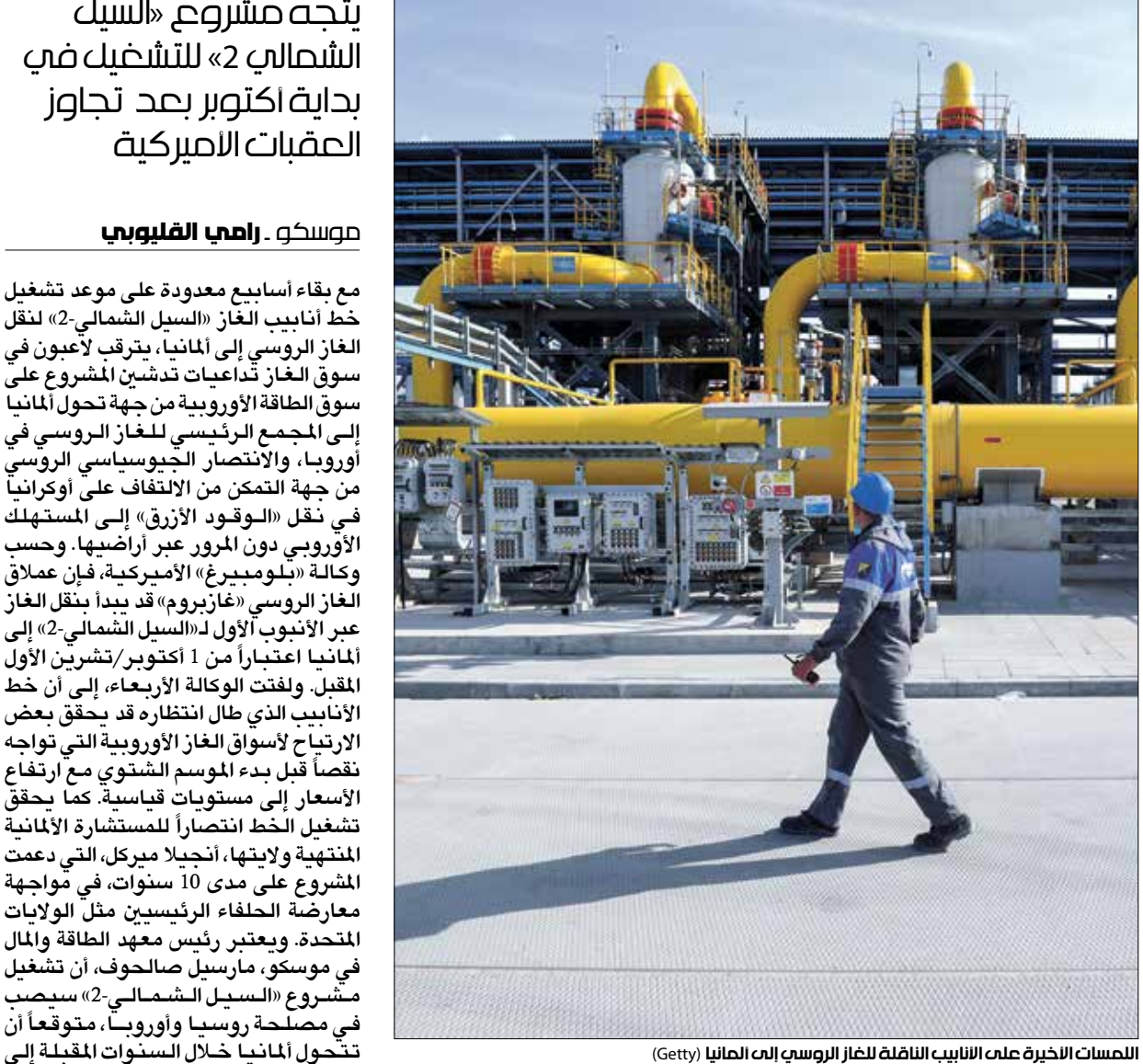
المصنات الاخرى على انابيب الناقله للغاز الروسي إلى ألمانيا

يتجه مشروع «السيك الشمالي 2» للتشغيل في بداية أكتوبر بعد تجاوز العقبات الأميركية