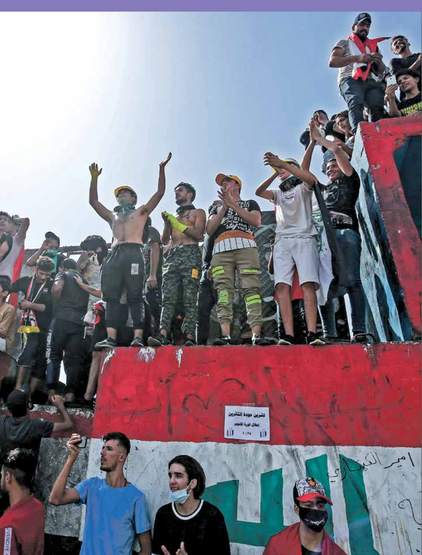
يبلط الحراريون منذ سنوات جوبير الوظائف