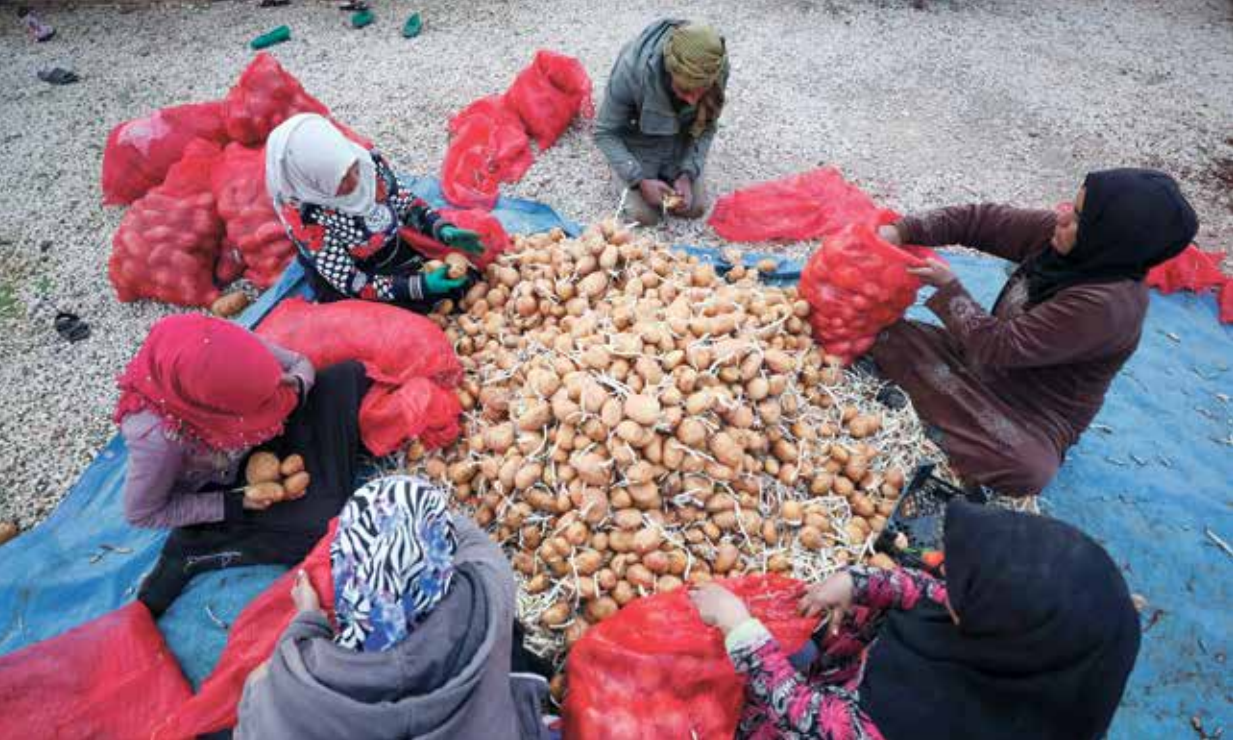
مهود الموسم الزراعي يوزر على الأسعر (بحر حذور، لمراس برس)

تراجع الإنتاج يضغط على الاستيراد ويجلب النقد الاجنبي