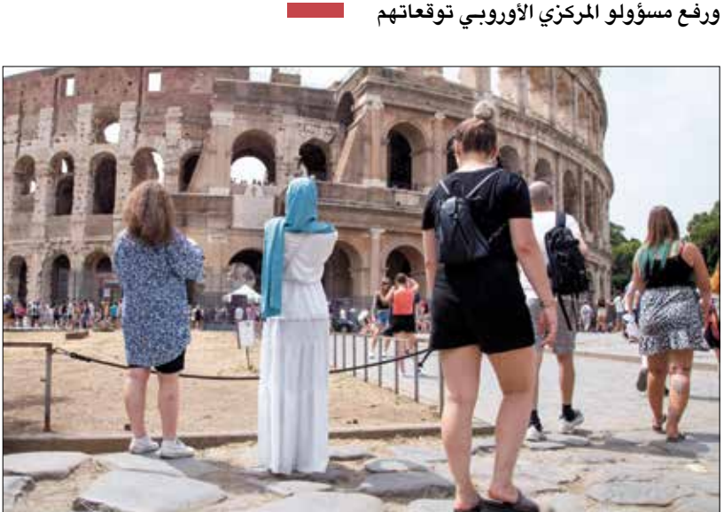
تراجع الساحة في إيطاليا بسبب جائحة كورونا

الربقاء على شراء سندات بقيمة 1,85 ترليون يورو تحت حارس 2022