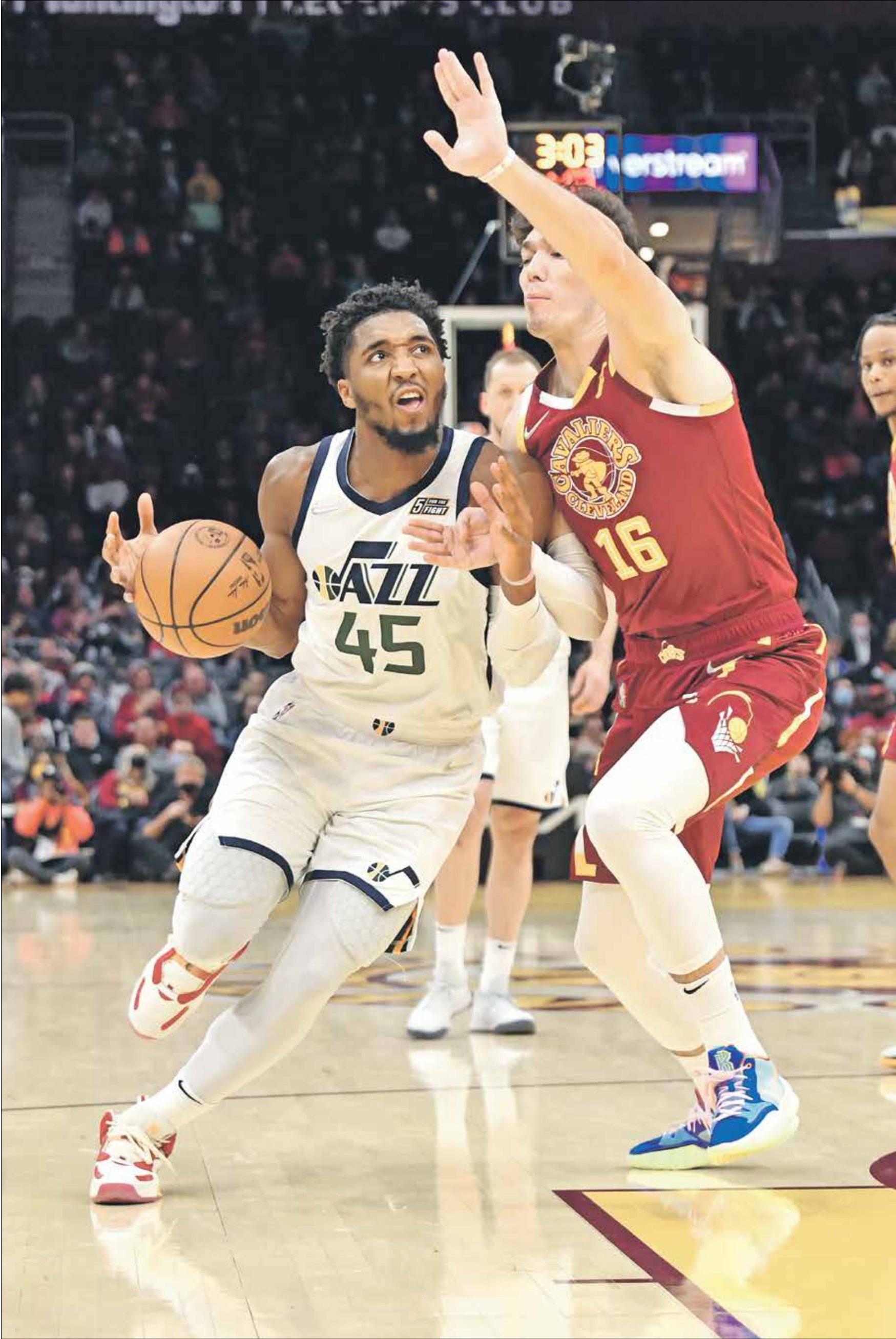
حقق يوتا جاز فوزه الرابع توالياً في الدوري

تابع فريق يوتا جاز، صاحب الترتيب الثالث في المنطقة الغربية، انتفاضة في منافسات دوري كرة السلة الأميركية، وذلك بعد تحقيقه انتصاراً جديداً، وهذه المرة على منافسه كليفلاند كافاليرز (109-108)، ليؤكد مواصلته سلسلة النتائج الإيجابية. وبهذه النتيجة، حقق فريق يوتا جاز فوزه الرابع توالياً في بطولة الدوري خلال 23 مباراة لعبها حتى الآن.