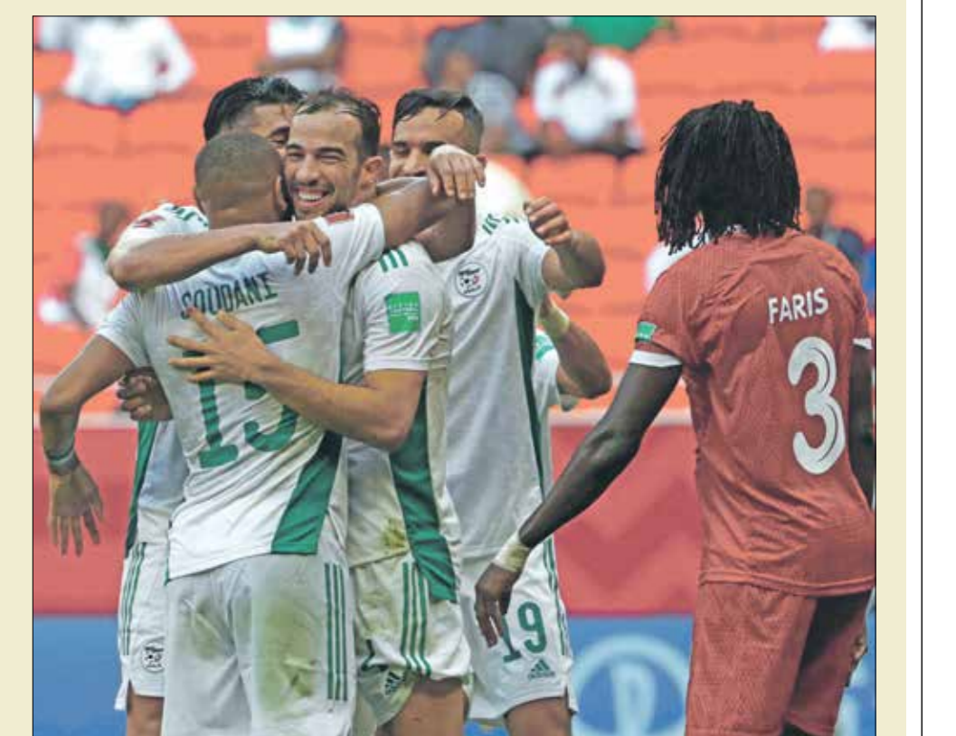
هذه يستمد بلعمرى مستواه ويشارة ضد مصر