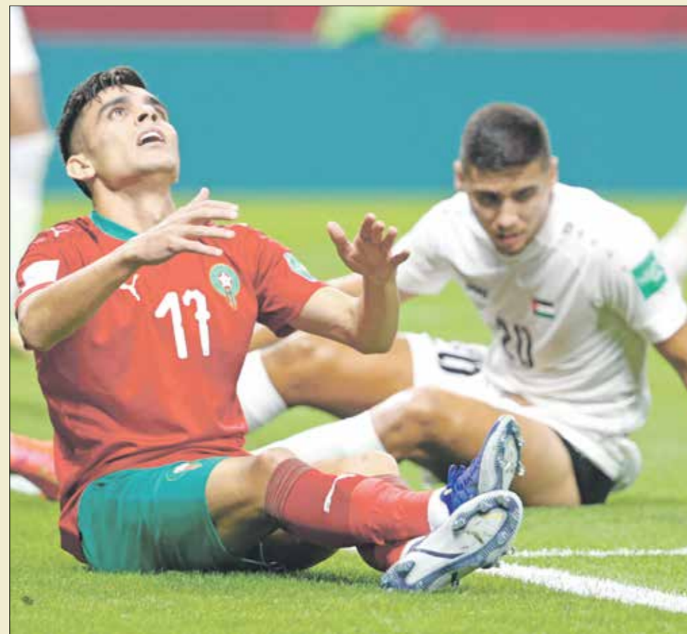
واجه بن شرقي الكثير من الصعوبات

يُعتبر النجم المصري حسام حسن أحد نجوم نسخة عام 1992 من بطولة «كأس العرب»، فقد ساهم بتوقيع منتخب بلاده بلقب البطولة آنذاك، وفي المباراة النهائية التي جمعت المنتخبين المصري والسعودي يومها، تقدم «الفرعانة» بهدفين وعادلت السعودية