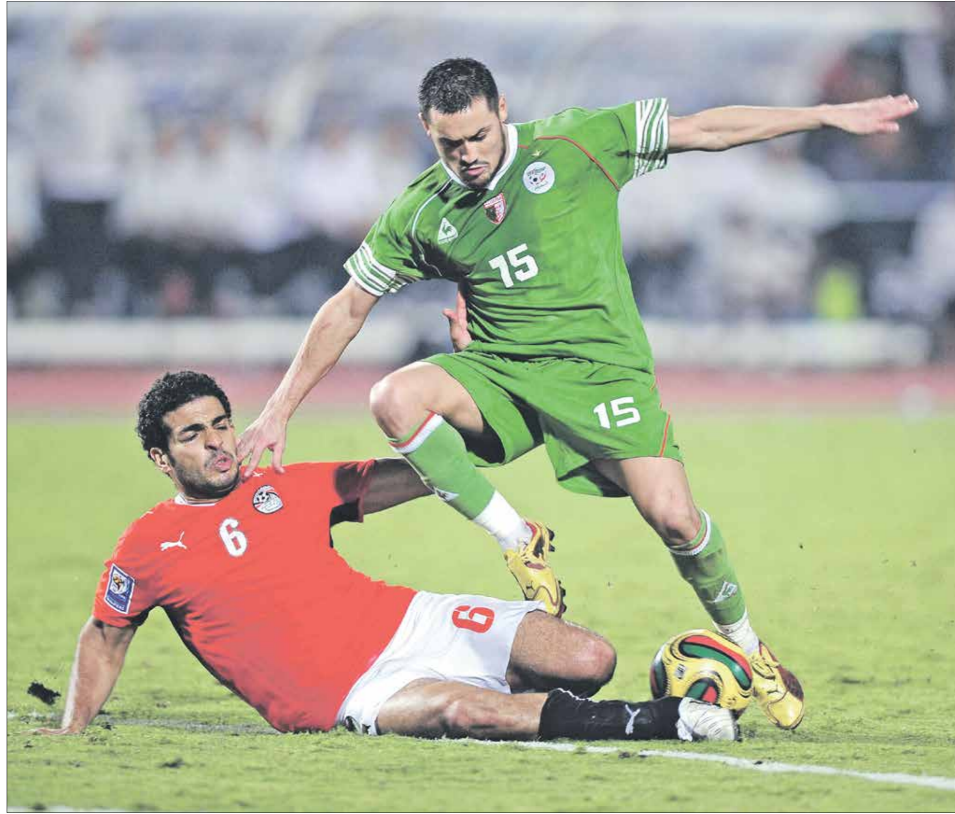
قمة جزائرية، صربية من أجل الصدارة وتجنب المغرب

منافسة ثلاثية على البطاقة الثانية في المجموعة الثالثة