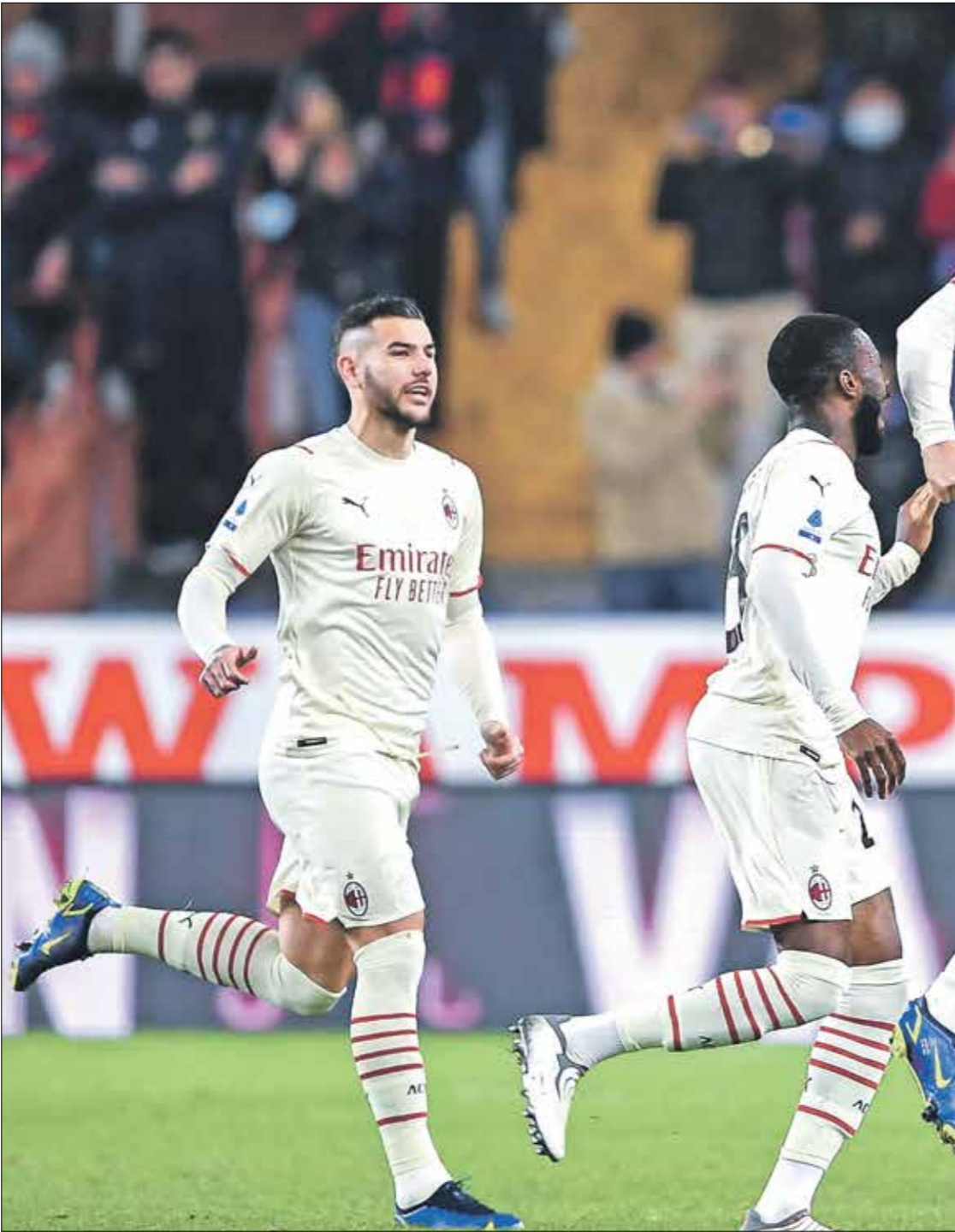
ميلان يهزم بورتو في وقت مبكر ضد أتلانتا