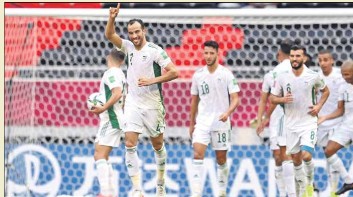
سجل النجم بلعمرى هدفاً في البطولة