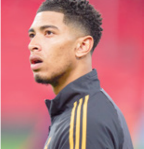
العهد يبحث عن لقب الثاني في البطولة العربية

اقترب فريق الحسين إريد من حسم لقب بطولة دوري المحترفين الأردني لكرة القدم للمرة الأولى في تاريخه، بعد فوزه على ضيفه الأهلي (2- 1) في المباراة التي جرت على استاد عمان الدولي في إطار مباريات الجولة الثالثة عشرة من للسامية. وسجل محمود مرضي ومجدي الطاهر في الدقيقتين (19 و39) هدفي الحسين إريد، ومحمد مراعية في الدقيقة (57) هدف الأهلي. ورفع الحسين إريد بفوزه الثاني توتالياً والسادس عشر في المسابقة مقابل تعاديلين وصفر هزائم، رصيده إلى 50 نقطة في صدارة الترتيب العام، وحافظ على فارق النقاط الخمس عن أقرب منافسيه الفيصلي صاحب المركز الثاني قبل أربع جولات على النهاية. وبات الحسين إريد على بعد 8 نقاط من تحقيق حلم التتويج باللقب.