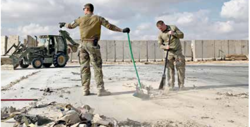
لم يطر الهجوم على قاعدة عين الأسد مع خسارة البعث