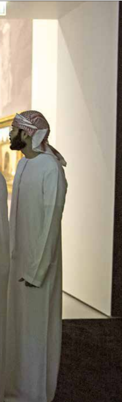
كان بونابرت مهتما بالشرق (مجموع خالد الناصول)

كانت نظرة بونابرت تتجاوز الحجاز، حيث كان غالب بن مساعد يحاول صد اندفاع غالب بن مساعد، كان بونابرت يتخطى إلى شريف مكة على أنه حليف محتمل ضد البريطانيين، وأيضاً ضد العثمانيين، الذين كانت لهم علاقات صعبة معه، وإن ذلك من شأنه تشجيع شريف مكة على الانقلاب على سلطانة، كما عبر عنه بونابرت بعبارات سيكون لها رواج فيما بعد بكثير: «ماذا تتخضع الأمة العربية للاترارة!.. أريد مصر قبل أن يصبح يملوسا متحركاً في قلب ويغداد من 1802 إلى 1810، قد تكرر أيضاً في كتابه «تاريخ الوهابيين من الثورة إلى نهاية الأراء» (أراد كراباند 1810)، فشل الدولة السعودية الأولى في الاستيلاء على جدة عام 1803، ولم على عكس ذلك نجاحها في ذلك في 1806، في سنة 1803، كلف بونابرت كورانسين، الذي كان يعرفه جيداً، بمهمة دبلوماسية لدى رئيس الدولة