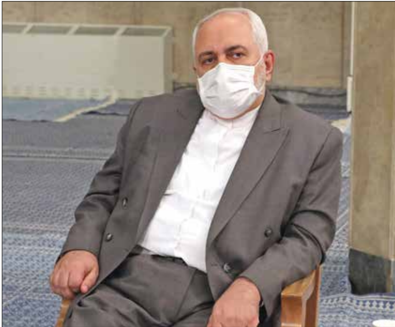
ظريف غير مسنود بخلفية أمنية

ارتبط اسم ظريف بالملف النووي والمفاوضات بين إيران والمجموعة السداسية الدولية، والتي أفضت إلى الاتفاق النووي عام 2015. فالاتفاق جلب له شهرة وشعبية في إيران، تفوق شعبية روحاني، لكن هذا لم يشكل كل الصورة عن ظريف، بل كان الجانب الطاعي منها حينها، والجانب الآخر هو غضب تجاهه بدأ يتراكم في الوسط المحافظ، خصوصاً من قبل المتشددين، الذين لم يرق لهم الاتفاق النووي، فعارضوه بشدة واعتبروه «خيانة».