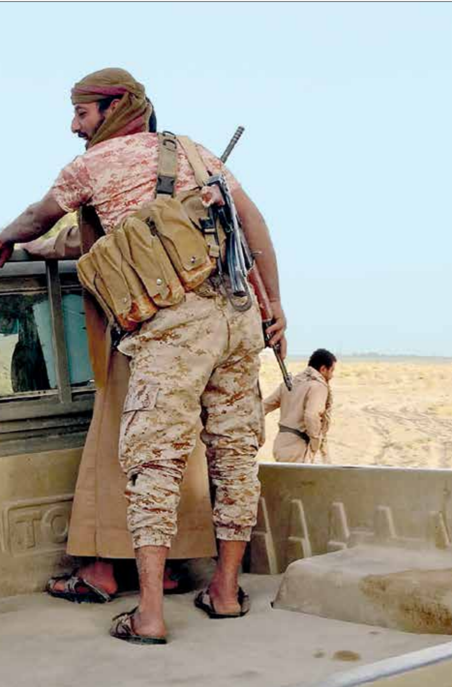
سطر الصراع في مارب

عبد السلام: الطروحات لا تفيد بتحقيق سلام بل تطيل الحرب