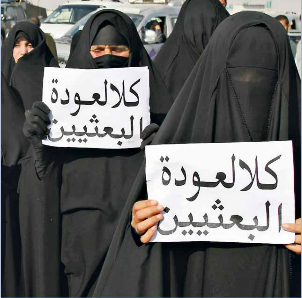
أقر قانون «اجتثاث البعث» عام 2005

مع اقتراب موعد الانتخابات التشريعية في العراق المقرر في أكتوبر/ تشرين الأول المقبل، عاد ملف اجتثاث حزب البعث إلى الواجهة، وسط اتهامات لجهات حزبية نافذة باستغلاله لاستهداف منافسيها، فيما يقول مراقبون إن هذا الملف يتم تطبيقه بانتقائية