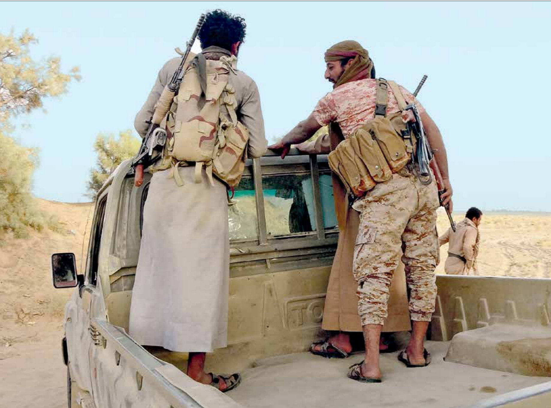
سطر الصراع في مارب

خطوات الحاسمة التي من شأنها إجبار الحوثيين على الإصغاء الجاد لدعوات السلام، وذلك من خلال الترتيب لعقد جلسة