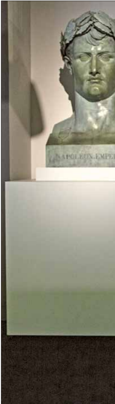
كان بونابرت مهتما بالشرق (مجموع خالد الناصول)

توقفت خطط التحالف الفرنسي-الوهابي وقد قام هذا الأخير، الذي كان يعرف لاهتمام بونابرت بأمور الشرق، بإبلاغه بالموسم، قام الفضل الأول، الذي كان وقتها في باريس، بإضحاخ مشروع الإمبراطورية. طلب من البارون، في رسالة مؤرخة في 28 سبتمبر 1803، «توجيه خطاب إلى الأقسطنطينية مع رسالة بالشفقة إلى عميلنا حلب، لإعلامه بأنه قد تم تأكيد الاستيلاء على مكة وجدة، وأن يتخذ الوسائل لمراسة قائد الوهابيين، وأن يכת له في الأول ببساطة لأن التكتات الأوروبية عن الوهابية، والتي كان مطلعاً عليها، كانت قدتها كنوع من البروية المسلحة. كان كورانسين المصراة وليس ذلك الإصلاح السياسي الديني الخفيف الذي سيعبر عنه فيما بعد. ما إذا جاؤوا إلى سورية ومصر سيكفون على يقين من أنهم لن يتعرضوا للنهب». من دون أن يجعل بونابرت من الوهابيين القادة المحتملين لنهضة سياسية عربية كان يدعو إليها، وأكثر من ذلك من دون التخطيط لحملة ما نحو شبه الجزيرة العربية بحرية كانت على اقتراحاته، لم يقتصر تعاضل الإمبراطور، لمعرفة هؤلاء الحلفاء المحتملين ضد البريطانيين على المجال السياسي، والدليل على ذلك، أول كتاب فرنسي حول الوهابيين