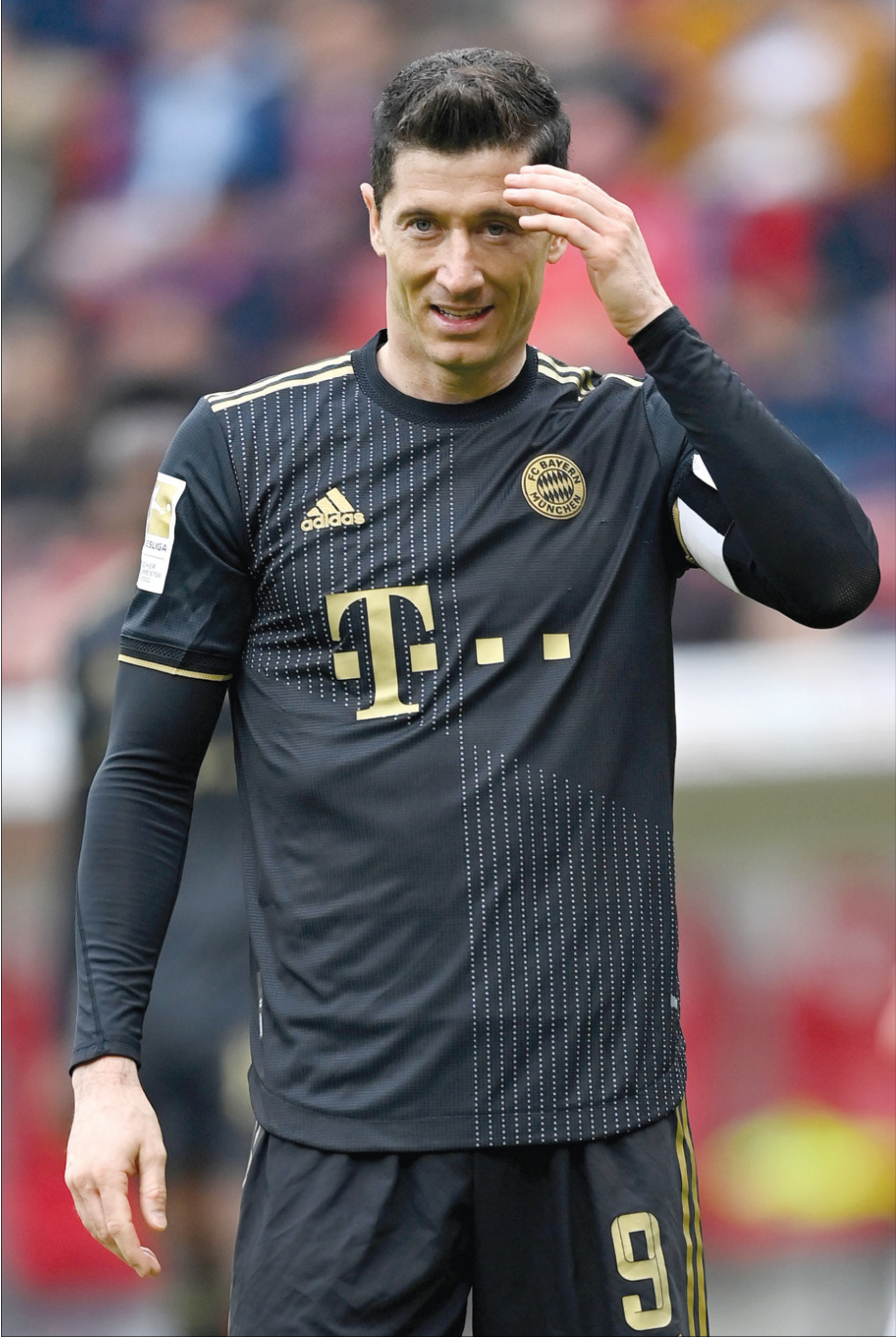
الإشاعات ربطت ليفاندوفسكي بنادي برشلونة

أكد الرئيس الفخري والمهاجم السابق لنادي بايرن ميونخ أولي هونيس، أن المهاجم الدولي البولندي روبرت ليفاندوفسكي سيبقى في صفوف عملاق بافاريا في الموسم المقبل. وكان ليفاندوفسكي الذي ينتهي عقده مع بطك ألمانيا في المواسم العشرة الماضية في حزيران/ يونيو 2023 عبّر عن رغبته في الرحيل للاتحاق بنادي برشلونة الإسباني.