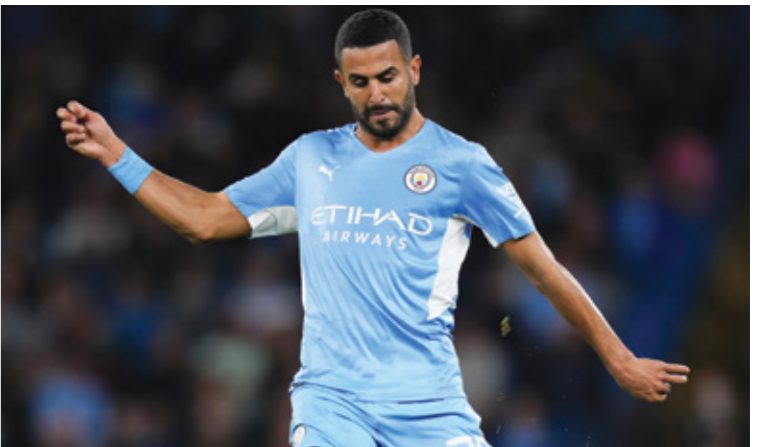
يلعب مانشستر سيتي على ملعب جمعه ريال مدريد

ويدرك المدرب بيد غوارديولا صعوبة مهمة نادي مانشستر سيتي، لأن الفريق الإنكليزي تعادل وحيداً، لكن المجموعات أمام نادي ريال