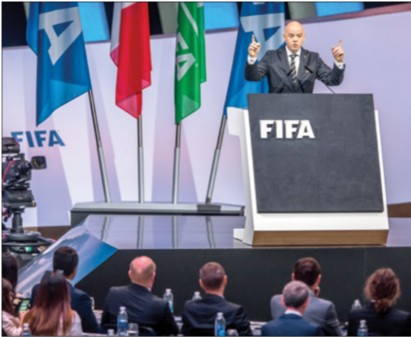
قرار فيفا دزم الجزائر تم خوض مباراة جديدة ضد الكاميرون (أفري)

وعليه يتكفي الاتحاد الدولي لكرة القدم بقرارات مالية وقوانين الضمائية فقط دون الأخذ بعين الاعتبار الاعتراض الذي قدمه الاتحاد الجزائري لكرة القدم، والذي كان يامل في إعادة المواجهة بسبب الأخطاء التحكيمية التي ارتكبتها الحكم الغامبي، بإتكارها وساماً، وكانت الجماهير الجزائرية تحلم بمواقفة فعا على إعادة المباراة ضد الكاميرون من أجل محاولة التأهل إلى بطولة كأس العالم 2022، خصوصاً في ظل الحصرة الكبيرة بعد الخسارة (1 – 2) من الإقصاء بسبب فارق هدف واحد خارج الأرض، ويهينن القرارين أكد الاتحاد الدولي لكرة القدم تأهل كل من السنغال والكاميرون إلى مونديال 2022 بشكل رسمي، وهو القرار الذي كان متوقفاً في وقت سابق نظراً لتاريخ تعامل الاتحاد مع مثل هذه الحالات