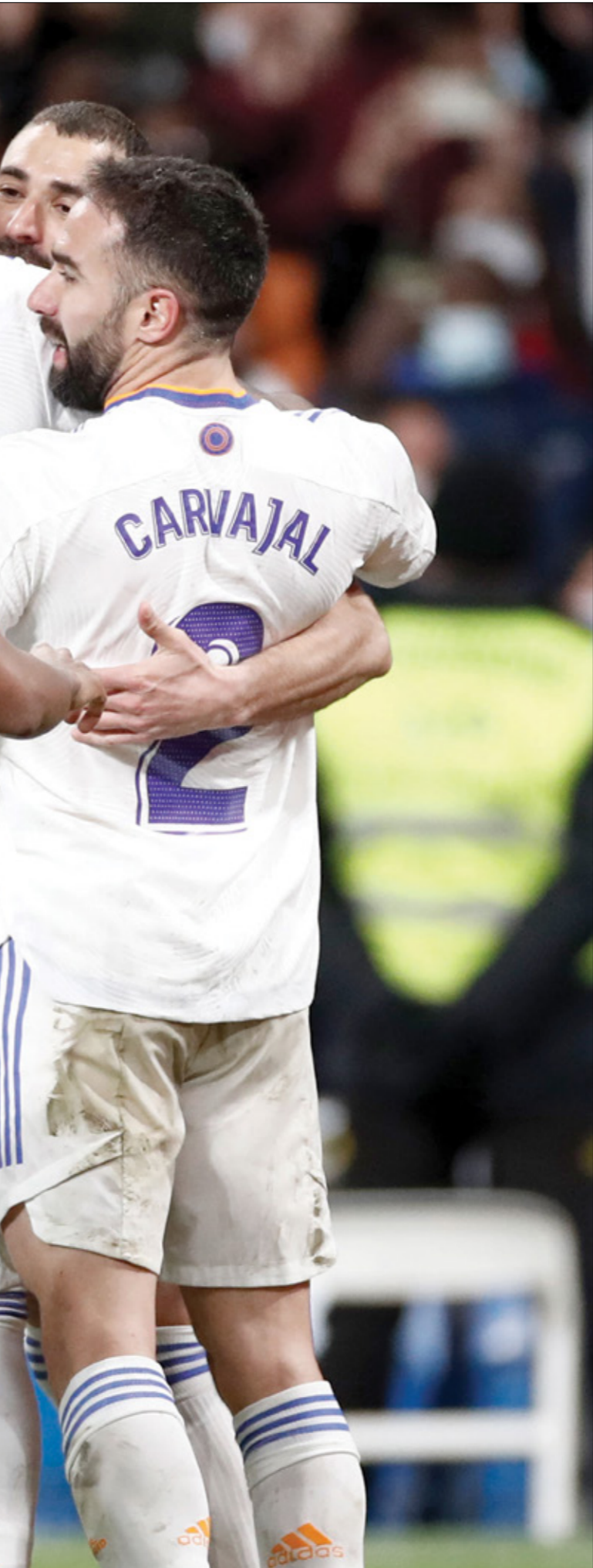
ريال مدريد يربد بلوغ نهائي أبطال أوروبا

ووضعت القرعة التي سُحبت الجمعة، نادال وديوكوفيتش المحصن الأول عالمياً على المسار عتبة، ما يعني أنهما قد يتواجهان قبل النهائي، بالإضافة إلى وجود الإسباني القادم بقوة كارلوس ألكاراس الذي دخل نادي اللاعبين العشرة الأوائل في التصنيف العالمي بعمر الثامنة عشرة فقط، بفعل توجيحه بدورة برشلونة الأسبوع الماضي وتعود المباراة الأخيرة لنادال، المصنف رابعاً عالمياً، إلى 20 آذار/ مارس الماضي، عندما خسر في نهائي دورة أنديةا ويلز الأمريكية