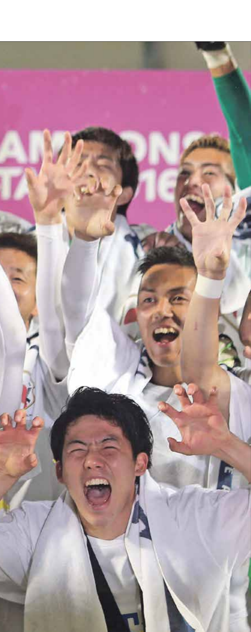
منتخب اليابان توج بنسخة 2016

وعُشفت اللجنة المشرفة على الجائزة عن قائمة اللاعبين المرشحين للتتويج بهذه الجائزة السنوية، والتي تكوّنت من 11 لاعباً مرشحاً للحصول على هذه الجائزة، من بينهم ثلاثة لاعبين عرب، فينصت إلى المغربي أشرف حكيمي البالغ من العمر (25 عاماً، ويوجد الجزائري نبيل من طالب من