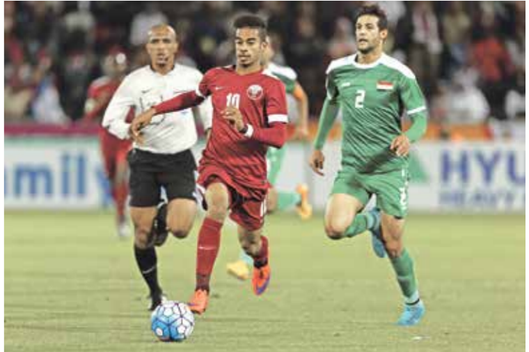
اكرم عفيف كان من أبرز نجوم البطولة (تالو التلو/ Getty)