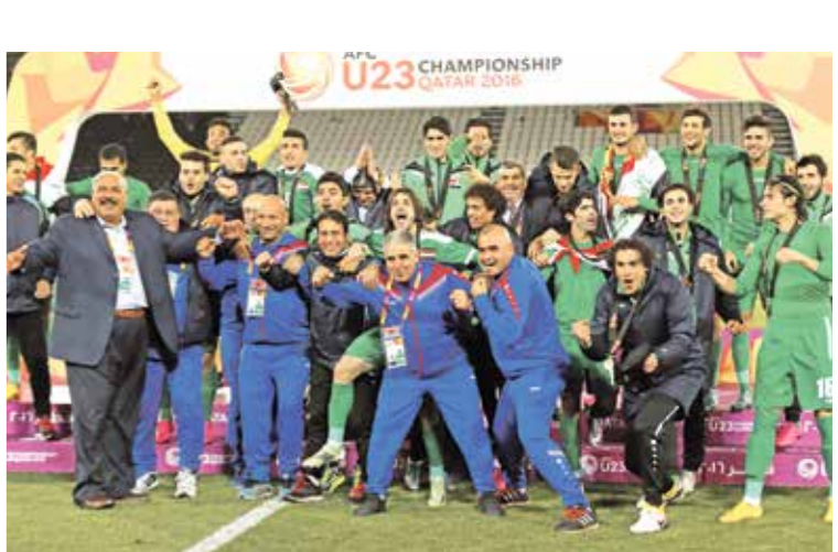
منتخب العراق حلف لثأر

تسعى المنتخبات الآسيوية لتسجيل حضور مميز في النسخة السادسة لبطولة كأس آسيا تحت 23 عاماً قطر 2024، التي تنطلق منافساتها في الدوحة يوم 15 إبريل/نيسان الجاري بمشاركة 16 منتخباً. حيث تواصل الدوحة احتضان اهم البطولات الآسيوية، وذلك بعد أسابيع قليلة من احتضان بطولة آسيا على ملاعب موندبال 2022، ما ساهم في تطوير المستوى الفني للبطولة وتمتعت أيضا عام 2016، وتوج بلقبها منتخب