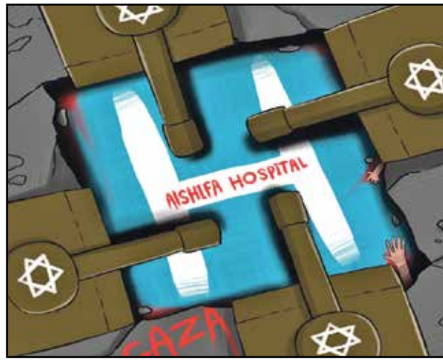
تدمير مجمع الشفاء الطبي في غزة