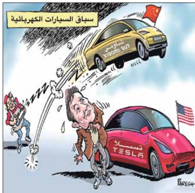
بارش ناث، كينغ كار تونز