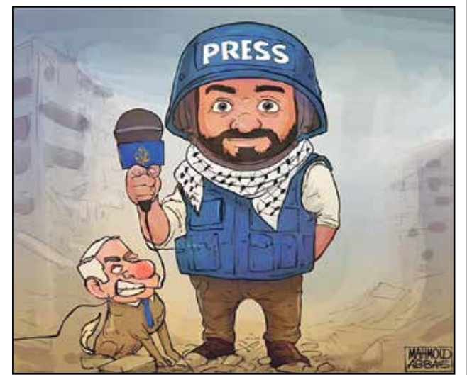
تتياهو ومحاوله إسكات قناة الجزيرة (محمد عباس، فيسبوك)