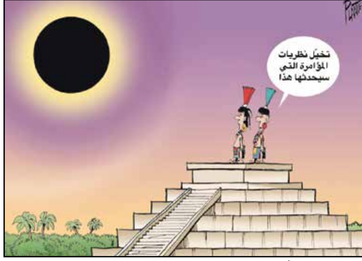
القدماء كانوا أكثر تعقلًا منا في تفسير الكسوف (بروس بلانتي، كينغ كار تونز)

وبعد مداوات منهكة، تذكروا خلالها أغنية فيروز، قرروا أن خير وسيلة للخلاص من المازق هي تسمية جسرهم البري (جسر العودة) .. لكن لا أحد يدري كيف سقطت (المدال) وظهرت (الراء) وأصبح الاسم (جسر العودة).