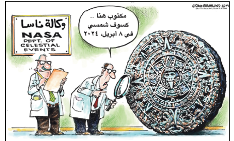
تاويلات القدماء للكسوف ما زالت مؤثرة (ديف غرانلوند، كينغ كار تونز)