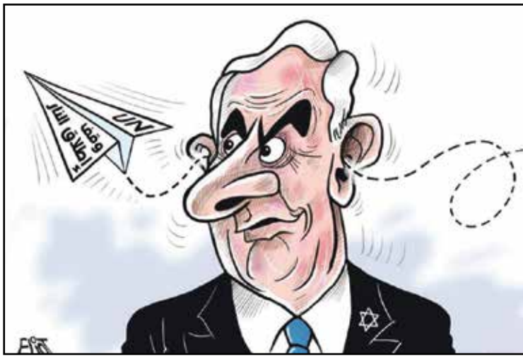
تتياهو وفرار وقف إطلاق النار الورقي (البيوت، الوطن القطرية)