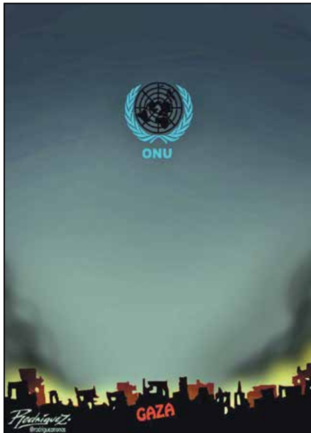
كسوف وكالة الغوث في غزة هو الأهم (التونيو رودريغز، كار تون موفمنت)

النصف الغربي من كوكبنا على موعد مع كسوف شمسي كامل ونادر، سيلقي بظله الطويل في 8 إبريل/ نيسان الجاري. هذا الكسوف لم يفوته الرسامون الساخرون للتعليق عليه وربط الأحداث السياسية والحياة عموماً مع هذا الحدث الفلكي المميز، ولا سيما أن منصات التواصل الاجتماعي وانتشار الأخبار الكاذبة ونظريات المؤامرة حول الكسوف هولت وزادت الإثارة بشأن هذا الحدث.