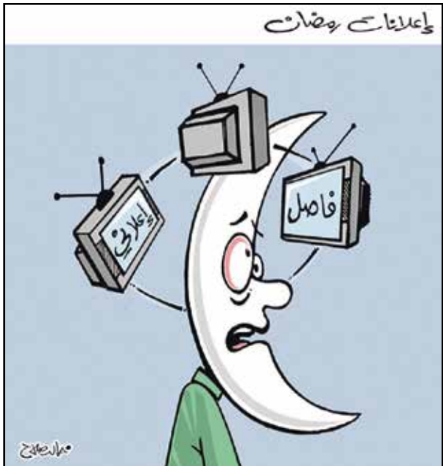
إعلانات رمضان تستولي على الموسم التلفزيوني (خالد صلاح، المصري اليوم)