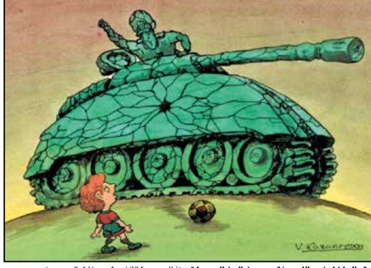
حفء الطفء في اللعب اقوم من الجنراك وديابته (فلاديمير كارانسكي، ذات المصدر)

هي حفلة الجلد الأولى في حياة هذا الجلال التي لم تنته كالمعتاد. صحيح أنه مارس مهمته بإخلاص منقطع النظير، ليس لأن الضحية أصيب بالشلل جزاء الجلد المزج، فهذه قضية تكررت كثيرًا، ولا يمكن اعتبارها سابقة في عمل الجلال المخلص لعمله، بل لأنه رفع العضا إلى الأعلى أزيد مما ينبغي، فاصابت وجهه وتسببت بخدش في جبينه. لم يكتف الجلال في البداية للخدش، بل أكمل مهمته حتى النهاية. لكن عندما زاد نزيف الدماء من جبينه، اضطر لمراجعة الطبيب المقيم في مديرية التعذيب، الذي تفحص الجرح وضمده، غير أنه قال للجلال إن من طبيعة هذا الجرح أن يترك أثرًا دائمًا لا يزول مع الزمن، ولذا عليه أن يتعايش معه. وعندما علم مديره بالأمر استدعاه، وقال محاولاً تهوين وقع النبا عليه: لا بأس أيها الجلال المخلص. يمكنك أن تعتبر هذا الأثر وسامًا على جبينك، كما يسعدني أن أبلغك بأن ما حدث لك يصنف كإصابة عمل تتيح لك الحصول على تعويض وفيير. على عكس «المجرم» الذي أصيب بالشلل تحت عصاك المباركة، فلن يحصل على أي تعويض لقاء «جرائمه». شعر الجلال بالسرور بادئ الأمر، غير أن السرور سرعان ما تحول إلى وجوم، عندما أكمل المدير حديثه: عمومًا أنصحك بإبقاء الضماد على جبينك إلى الأبد، وأجب كل من يسالك عنه بأنك أصبت به وأنت «تدافع عن الوطن». وأجب كل من يسالك عنه بأنك أصبت به وأنت «تدافع عن الوطن».