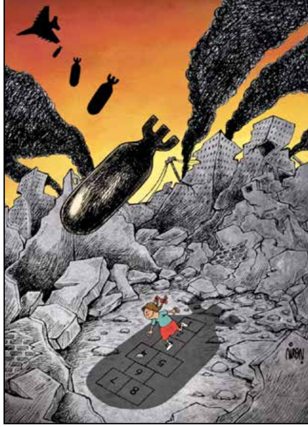
طفلة تلعب صارت هدفًا للطائرات الحربية العمياء (ايام بورومند، ذات المصدر)