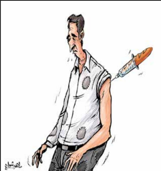
لفاح لقمة العيش مطلوب ايضاً