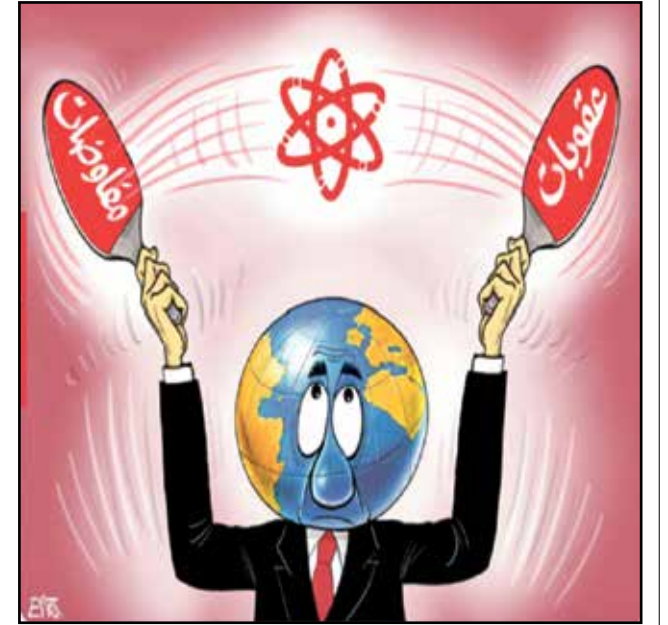
العقوبات او المفاوضات في الملف النووي الإيراني؟