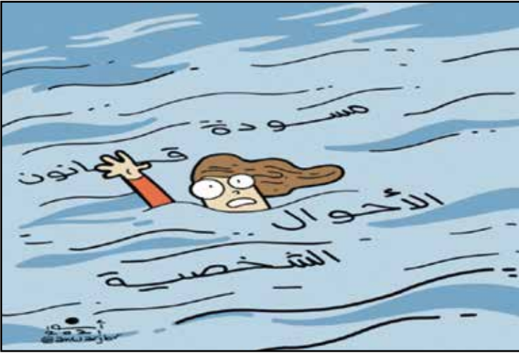
مسودة قانون الاحوال الشخصية في مصر تظلم المرأة