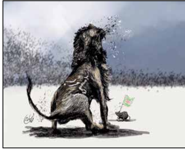
معرفة مارب (اسامة طالب، فيسبوك)