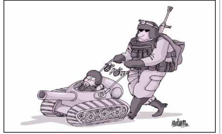
الحرب تلتصق الاطفال على ثقافتها المدفوعة (الفريدو مالتيريا، ذات المصدر)

الأطفال هم أكثر الفئات الاجتماعية تأثرًا بمآسي الحروب وويلاتها، وأجسادهم الصغيرة الغضة وبراءتهم تكون دائمًا أول ضحايا النزاعات المسلحة، ومن هنا تصرخ ضمائر كثيرة حول العالم بأهمية تجنيد الأطفال ويلات الحروب. هنا باقة من أربعة رسومات تعالج معاناة الأطفال في خضم الحروب، وضرورة ضمان حق اللعب للأطفال حتى في ظل الحروب.