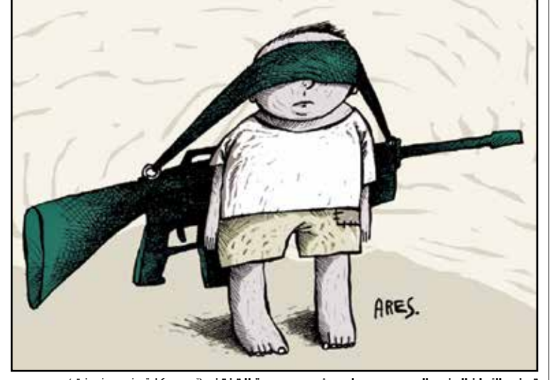
تجنيد الاطفال في الحروب وجعلهم اسرى جريمة لا تغفر (اريس، كارتون موفمنت)