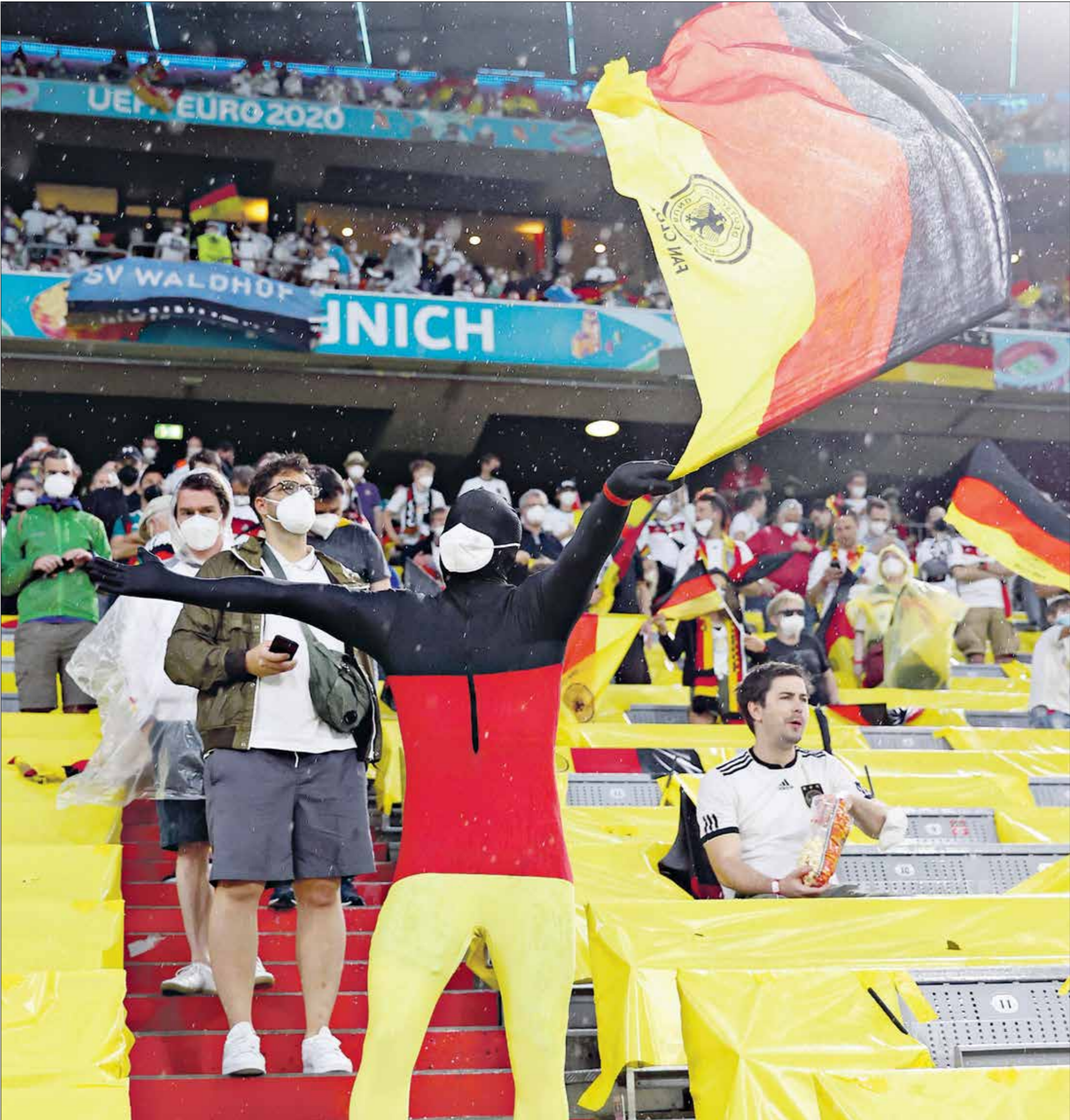
يستقبل ملعب «البايز أرينا» عددًا من مباريات الدوري

قال اللاعب في تصريحات لصحيفة ماركا الإسبانية، بشأن تعويضه لغريمالدو: «إنه لن دواعي سروري إن أرت الرقم 3 لأن غريمالدو كانت لديه مسيرة مذهلة في بنفيكا، أما في ما يخصني فقد تأقلمت جيداً في البرتغال ويرجع ذلك إلى أنه من منطقة غاليسيا الحدودية مع البرتغال، لذلك