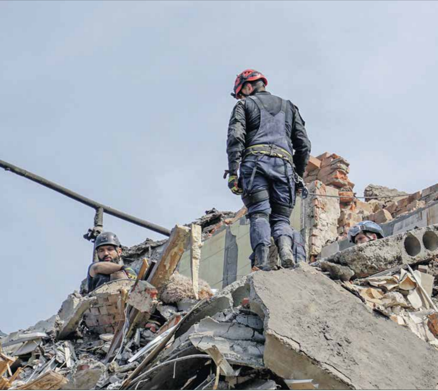
مت المصعب الروسي على حاركيف الجمعة الماضي

أرادت واشنطن وجيرمن زيارة بيلينكي إلى كيف إلى قيمة رمزية صريحة، ولقيل كل شيء من أجل إساءة الضمان ومحاولة الاعتذار من الأوكرانيين، بسبب تخلفها عن الوفاء بتعهداتها التي قطعتها على نفسها منذ فترة ما قبل حرب أوكرانيا، ومخضعها «أو واشنطن لن تسمح لروسيا بهزيمة أوكرانيا»، ولولا صواريخ فرنسية وبريطانية، لرسالة إلى روسيا بمنع من الداخل الأوكراني، وليس عن بعد، بالتأكد على الالتزام مع كيف ومع ذلك لم يبتخر الروس،