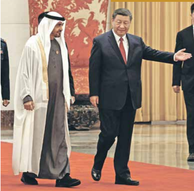
الرئيسان الصيني والامراتي في مكتب الخميني (اليسار) وونغ تراس (يسار)