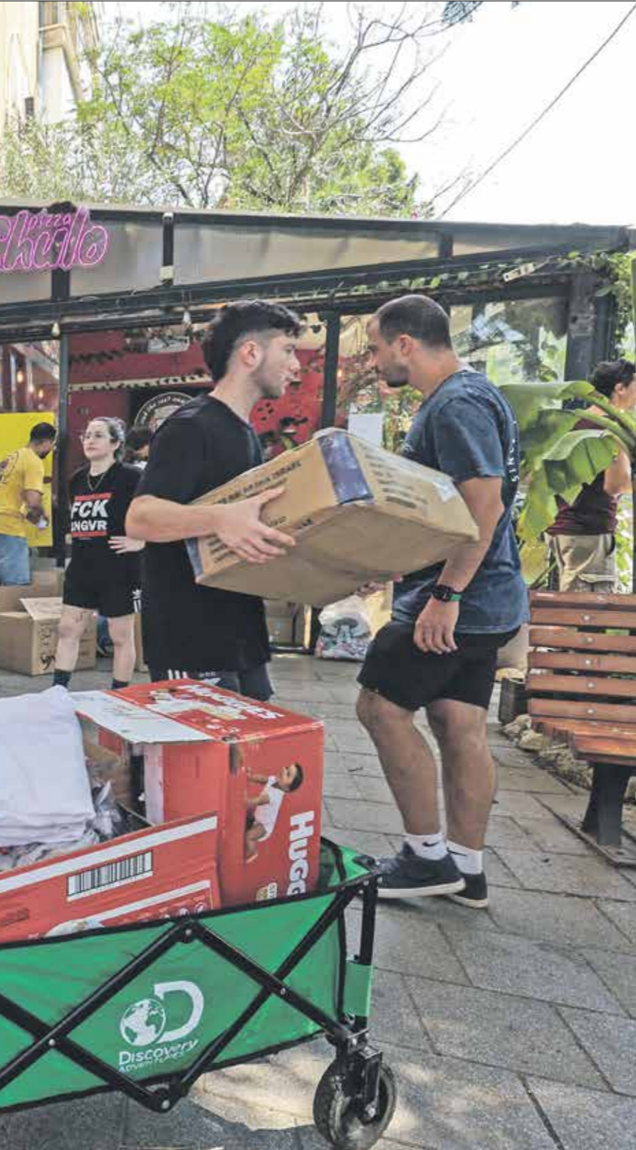
اسرائيلوب يتسوقوم من مءر فب فب اءبب، 10 أكتوبر 2023 (فرايس برس)

أنه تسبب في مشكلات نفسية وزوجية وأخرى طالوت حياتهم العلية، وأشارت الصحفة إلى أن طول مدة الخدمة في الجيش كانت له أيضا انعكاسات سلبية على الاقتصاد الإسرائيلي، إذ قدرت وزارة المالية تكلفة أيام الإحتطاب في الحرب بنحو 4,4 مليارات ءولار، لكن التكلفة ارتفعت بء سبعة أشهر إلى 8,17 مليارات ءولار، ولا تزال الحرب مستمرة.