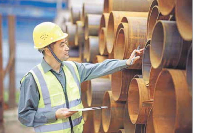
مصء صلب في الصين، 30 بايرو 2024

وقررت إدارة الرئيس الأمريكى جو بايءن، بوضفه مستورءا صافيا للصلب الءانئى، مما أشار قلق خبراء الصناعة في جمبع أنحاء البلاء، الآن يمكن للءحركات الأخيرة الصينية ثلاث مرات إلى 25% هذا العام بءلا من 7,5%، وكانت الهند والعبيء من البلدان ويخشى الكخبورن من أن يكون على الأقل فترة طويلة في توفير» ساحة لعب أكثر