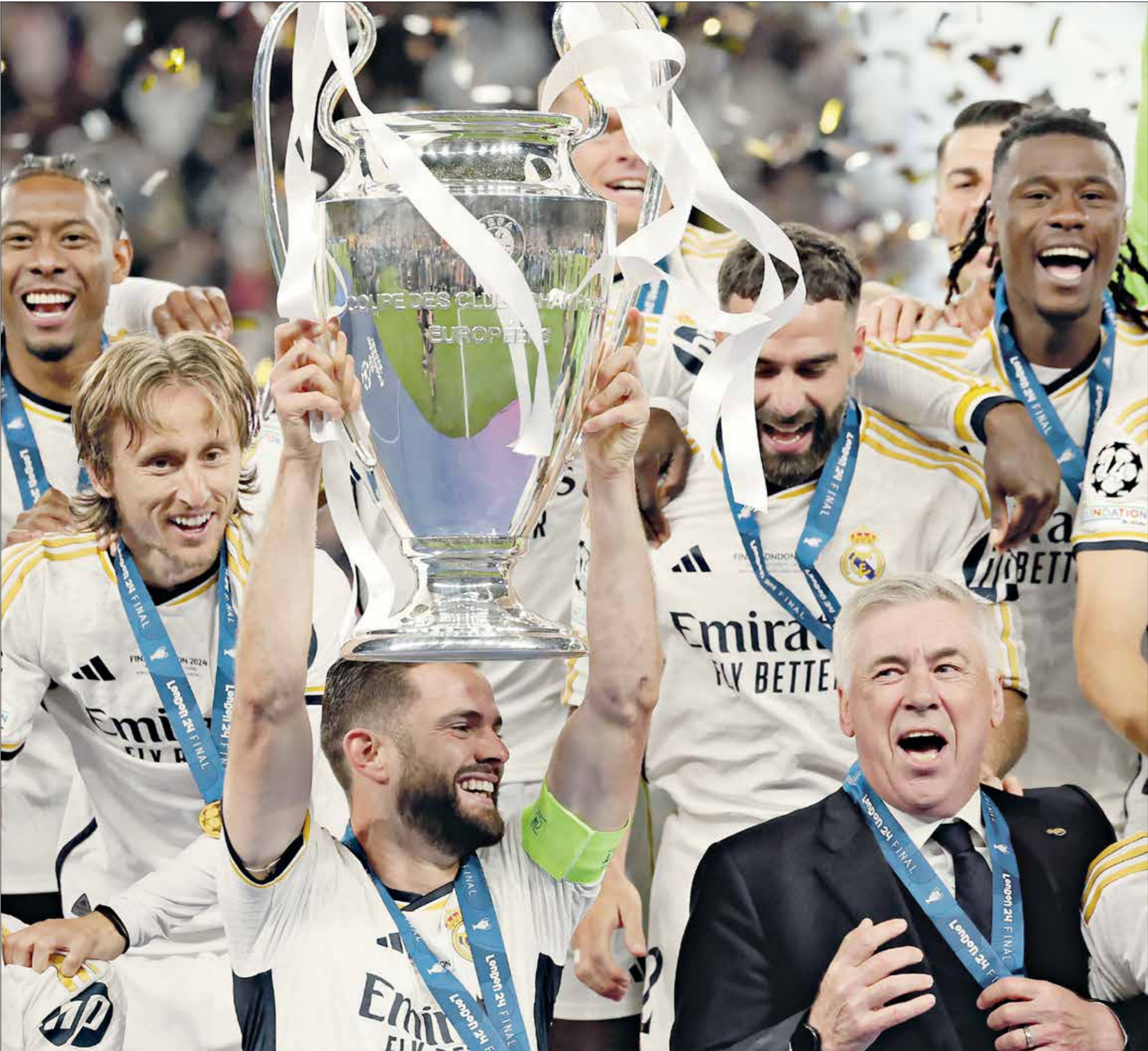
ريال مدريد يرفع اللقب للمرة الـ 15

سجل هدفاً في النهائي، مع «السيت»، وهدفين في نصف النهائي، وهدفاً في ثمن النهائي، في الوقت الذي عادل صاحب الـ 23 عاماً، رقم اللاعب الأرجنتيني ليونيل ميسي على مستوى التمريرات الحاسمة في مراحل خروج المغلوب بدوري الأبطال، (12 تمريرة حاسمة) وفصل إليها النجم البرازيلي في 22 مباراة، فيما احتاج ميسي إلى 79 لقاء لتحقيق هذا الرقم، في الوقت الذي يعتبر «سكواكا» لإحصائيات، فيما وصل إلى هدفه رقم 24 مع الريال في جميع المبارقات هذا الموسم، ويات فينيسوس، أحد أبرز اللاعبين الحاسمين في ريال مدريد، بعدما سجل هدفاً في النهائي، مع «السيت»، وهدفين في نصف النهائي، وهدفاً في ثمن النهائي، في الوقت الذي عادل صاحب الـ 23 عاماً، رقم اللاعب الأرجنتيني ليونيل ميسي على مستوى التمريرات الحاسمة في مراحل خروج المغلوب بدوري الأبطال، (12 تمريرة حاسمة) وفصل إليها النجم البرازيلي في 22 مباراة، فيما احتاج ميسي إلى 79 لقاء لتحقيق هذا الرقم، في الوقت الذي يعتبر «سكواكا» لإحصائيات، فيما وصل إلى هدفه رقم 24 مع الريال في جميع المبارقات هذا الموسم، ويات فينيسوس، أحد أبرز اللاعبين الحاسمين في ريال مدريد، بعدما