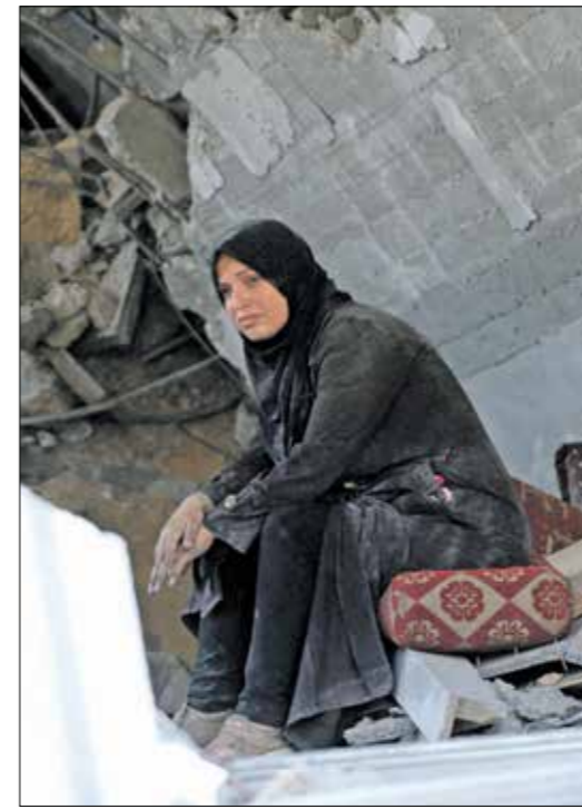
حسرة على الحال