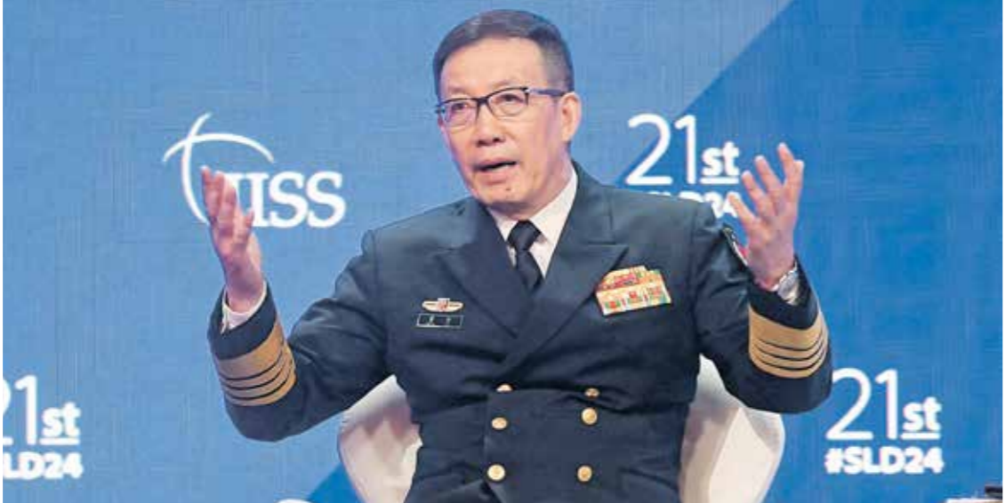
وزير الدفاع الصيني ملحدلا الملحمه الصين امس (هناك تيوبون تراسن برس)