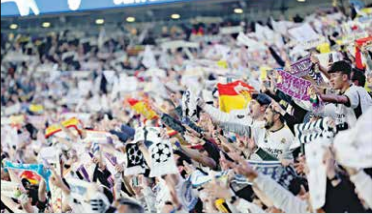
النادي الملكي يلقى دعماً جماهيرياً كبيراً

نجوم نادي ريال مدريد سيطرتهم على خط الوسط، ونجحوا في استغلال أخطاء منافسهم، عقب قيام جود بيلينغهام بخطف الكرة، وأعطائها على طين من ذهب إلى زميله فينيسوس جونور الذي لم يجد صعوبة في وضعها في شباك الحارس في الدقيقة 83، ليساهم البرازيلي في حصد ريال مدريد لقب بطولة دوري أبطال أوروبا للمرة الـ 15 في تاريخه، وفرض المدافع الدولي داني كارفخال (32 عاماً)، نفسه، نجماً في النهائي، بمساهمته الفعالة في انتصار فريقه. ورفع الظهير الإسباني رصيده إلى ستة ألقاب في دوري أبطال أوروبا، شغادلاً الرقم القياسي (رقعة عدد من لاعبي الريال)، الذي يملكه مواطنه فرانيسكو خنتو الذي كان أول لاعب يفوز بهذه المسابقة في ست مناسبات، كما أن كارفخال هو أول لاعب في تاريخ الريال يخوض ست مباريات نهائية، أساسياً مع الفريق، في دوري الأبطال، ويعيش واحداً من أفضل المواسم في مسيرته مع النادي الملكي، والتي كانت قبل سنوات مهددة بالفشل، حين واجه صعوبات أعادت بروزه مع الفريق، ورحل معاراً إلى باير ليفركوزن الألماني ليعود أقوى.