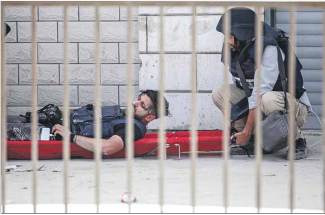
يستهدف الاحتلال الصحافيين بشكل مباشر