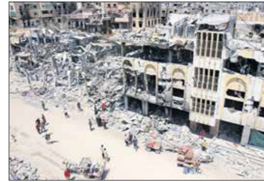
الفاض والفاض