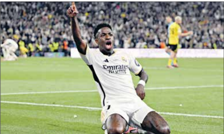
فينيسوس كان أبرز لاعبي ريال مدريد في فوز ريال مدريد على بوروسيا دورتموند

لبضع الكرة برأسية مثقفة في شمال حارس مرمرى فريق بوروسيا دورتموند، الذي فشل في التصدي لها، وسط فرحة كبيرى نجمه داني كارفخال تسجيل الهدف الأول في الدقيقة 74، بعدما استغل الرقابة الدفاعية المفروضة عليه، وارتقى في الهواء