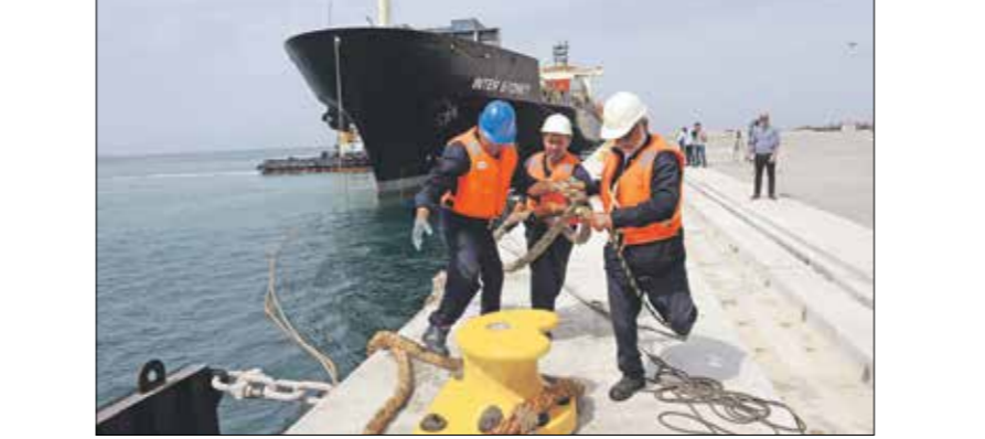
مبابة شالبارع في إيران، 25 فبراير 2019