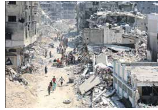
دمار على حد النظر