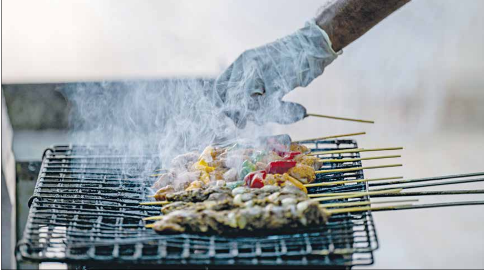
داخل أحد المطاعم السودانية في القاهرة، مايو 2024

مع اندلاع الحرب في السودان ولجوء الآلاف إلى مصر هرباً من الموت، افتتح عدد من السودانيين مطاعم موزعة في مختلف أحياء القاهرة، محاولين تقديم تجربة مختلفة للزبائن المصريين