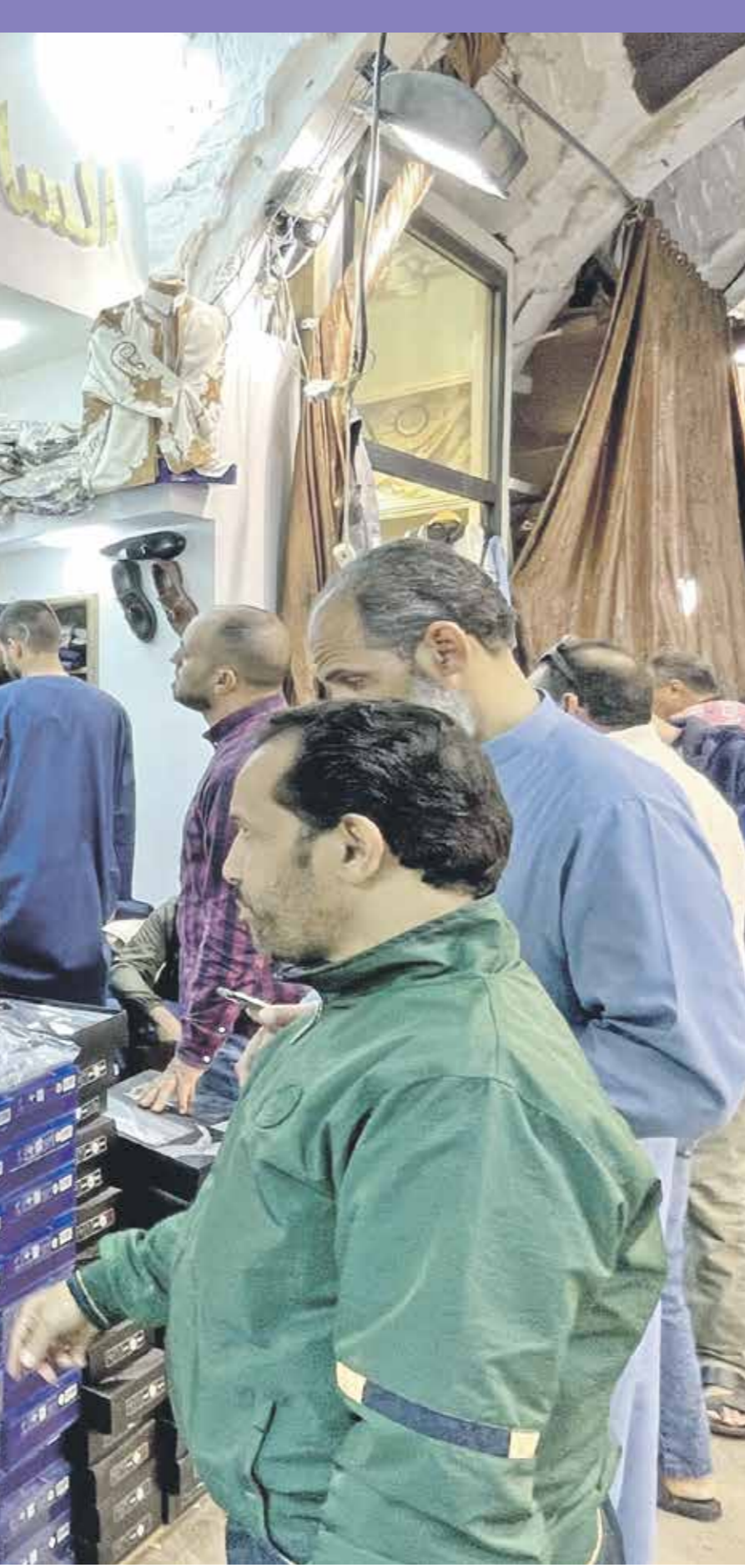
سوق الرينة في العاصمة طرابلس (حارم تركية،الاسواق)

يدعم رئيس الحكومة مصطفى مدبولي، خطة حكومية لرفع أسعار الكهرباء والمحروقات، في تصريحات رسمية، أطلقها الأسبوع الماضي، من دون أن يحدد موعداً لتنفيذها، في إطار خطة نفذها منذ يومين لخفض