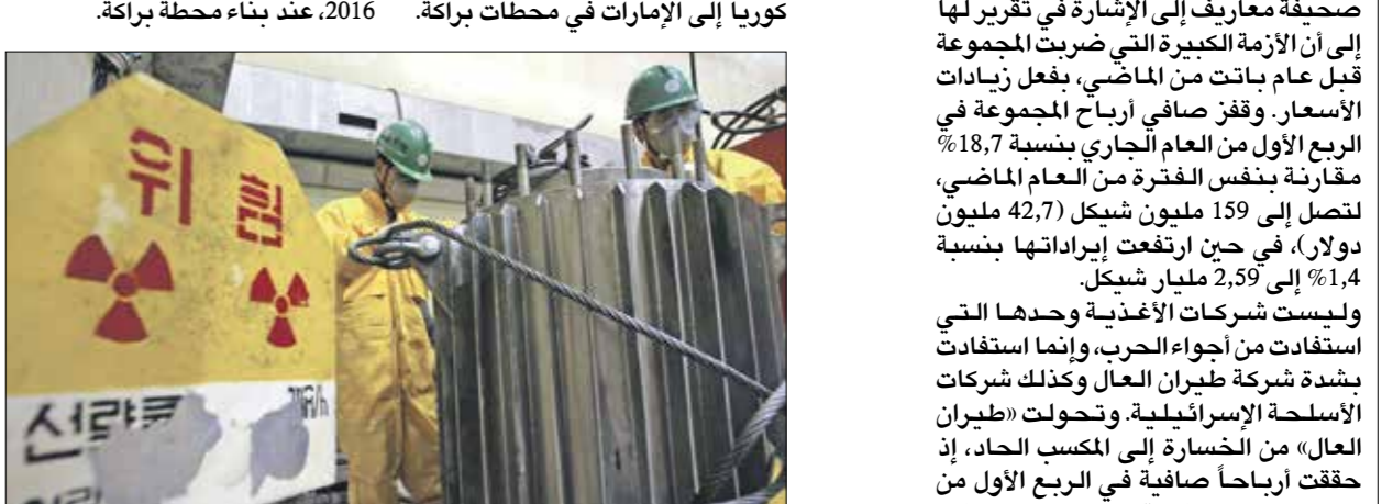
مفاعة تجريبية في المصءة الكوربى لإنتاج الطاقة الءرية في بئوك

وليست شركات الأغذية وحدها الةبى استغفات من أجواء الحرب، وإنما استغفات بشدة شركة طيران الءال وكذلك شركات الأسلحة الإسرائيلية، وتحوّلت «طيران الءال» من الإسرائيلية إلى المكسب الءاء، إذ حقق أرباحا صافية في الربب الأول من العام الءارى بقيمة 80,5 مليون ءولار،