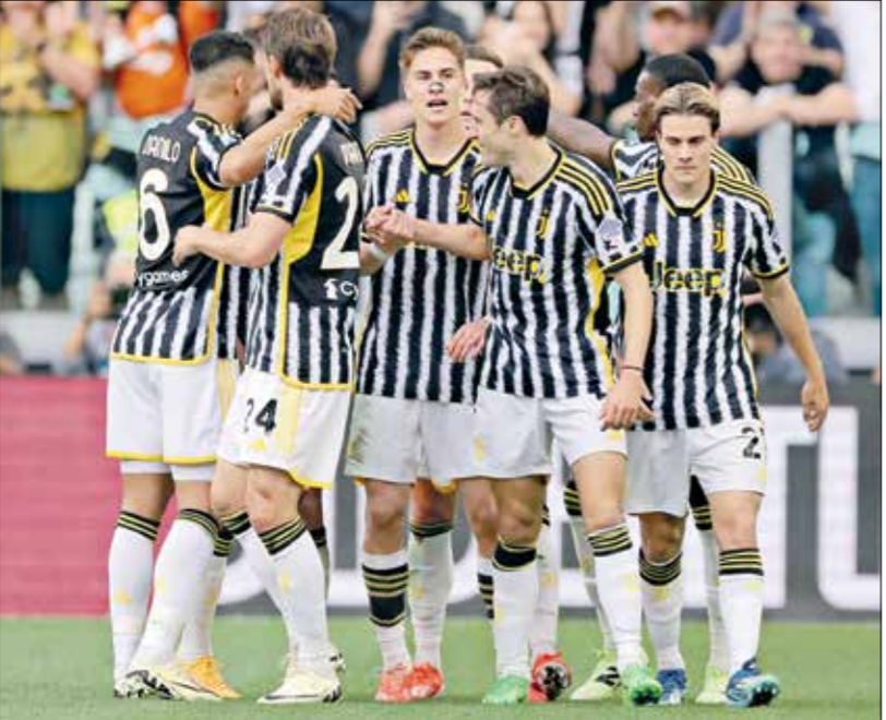
يوسفلوس السحب رسمياً من السوريلخ

وأعلنت أندية عدة، عام 2021 إطلاق مشروع السوريلخ، الذي يضمّ أفضل الأندية في مختلف الدوريات، وهو مشروع يُنافس دوري أبطال أوروبا، لكنّه أقصى الكثير من الفرق، مع تقديمه عوائد مالية كبيرة إلى الفرق المشاركة، ما يؤثر في مكاسب بقية المسابقات التي يشرف عليها الاتحاد الأوروبي لكرة القدم.