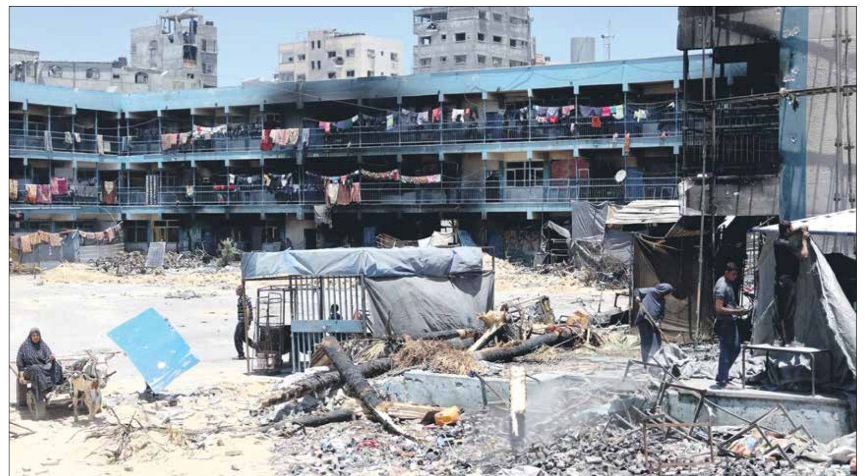
مدرسة محروقة لـ«الونروا»