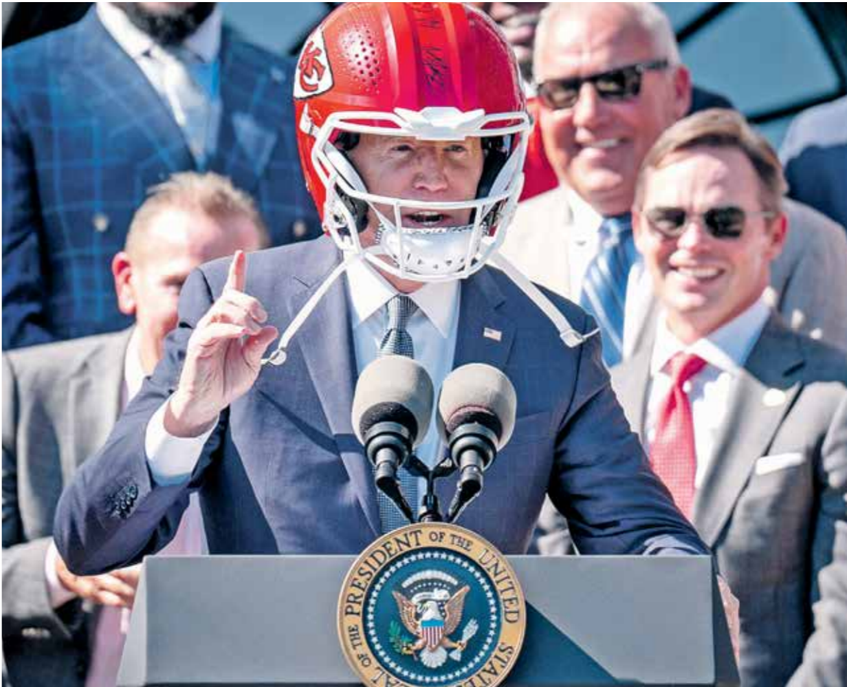
بايدن ذلك لثائه ريفياً فيها في البيت الأبيض، يوم الجمعة الماضي

16% من ناخبي ترامب قالوا إنهم لئ يصوتوا له في حال جرت إدانته