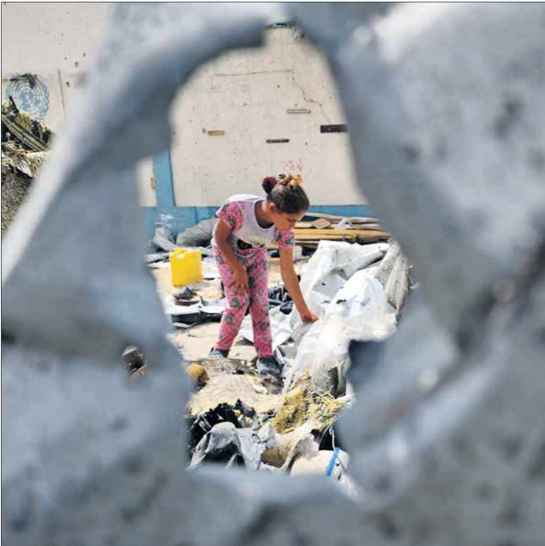
بعد المجزرة في رفح، مايو 2024

عَنْ نائِبِ رَئِيسِ الوَزارَةِ الأيرلندي، ميشيل مارتن، إدانته الغارة الجوية الإسرائيلية على مخيم للاجئين الفلسطينيين، ووصفه إياها بـ«الهمجية»، وحتى «نيويورك تايمز» التي انحازت بشكل واضح لرواية الاحتلال منذ السابع من أكتوبر، نشرت مقالاً بعنوان: «اجساد منقذمة وصرخات»