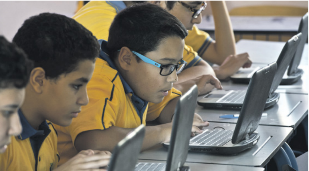
صفص بيكات الإنترنت في المدارس