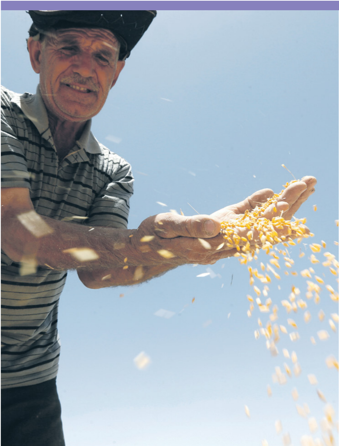
محافظ م تراجيح إنتاج الحبوب بسبب انخفاض المطار