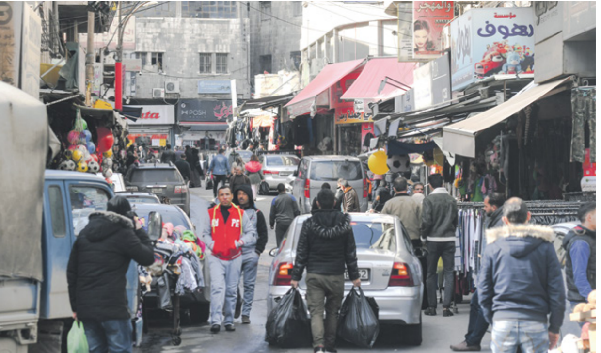
ارتفاع حصيلة الإصابات بفيروس

وما زال حجم التحديات، بحسب مراقبين وتقارير رسمية، وجود بيئة خصبة لعمليات غسل الأموال وتمويل الإرهاب، من أهمها التشابك العالمي مع بلدان مجاورة، ما يتيح إمكانية تحويل الأموال بطرق متعددة. وأظهرت نتائج التقييم الوطني لمخاطر غسل