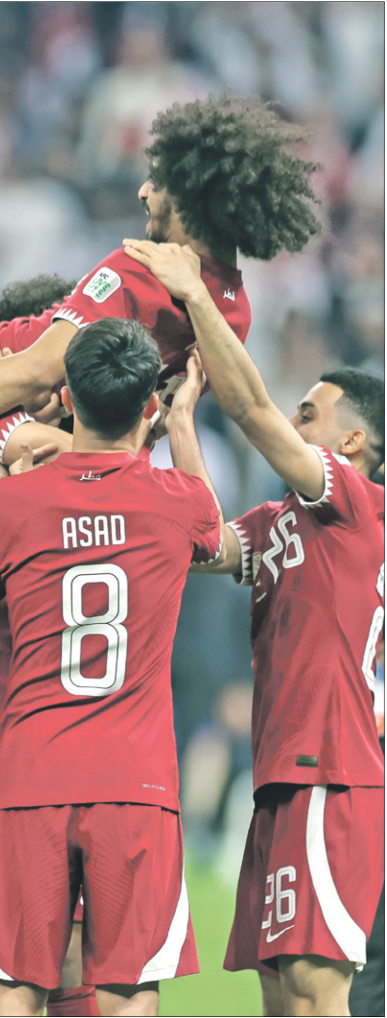
دافع منتخب قطر الحادي عشر على صدارة مجموعته

مع ختام مباريات الجولة الرابعة، فقدت خمسة منتخبات فرصة المنافسة من أجل العبور الدور الثالث، ومن ثم ستحصر كل أنماها الآن في الاستعداد للمشاركة في الدور النهائي من تصفيات كأس آسيا 2027. في المجموعة الرابعة، تعرض منتخب الصين تايبيه لخسارة الرابعة على التوالي، وفي