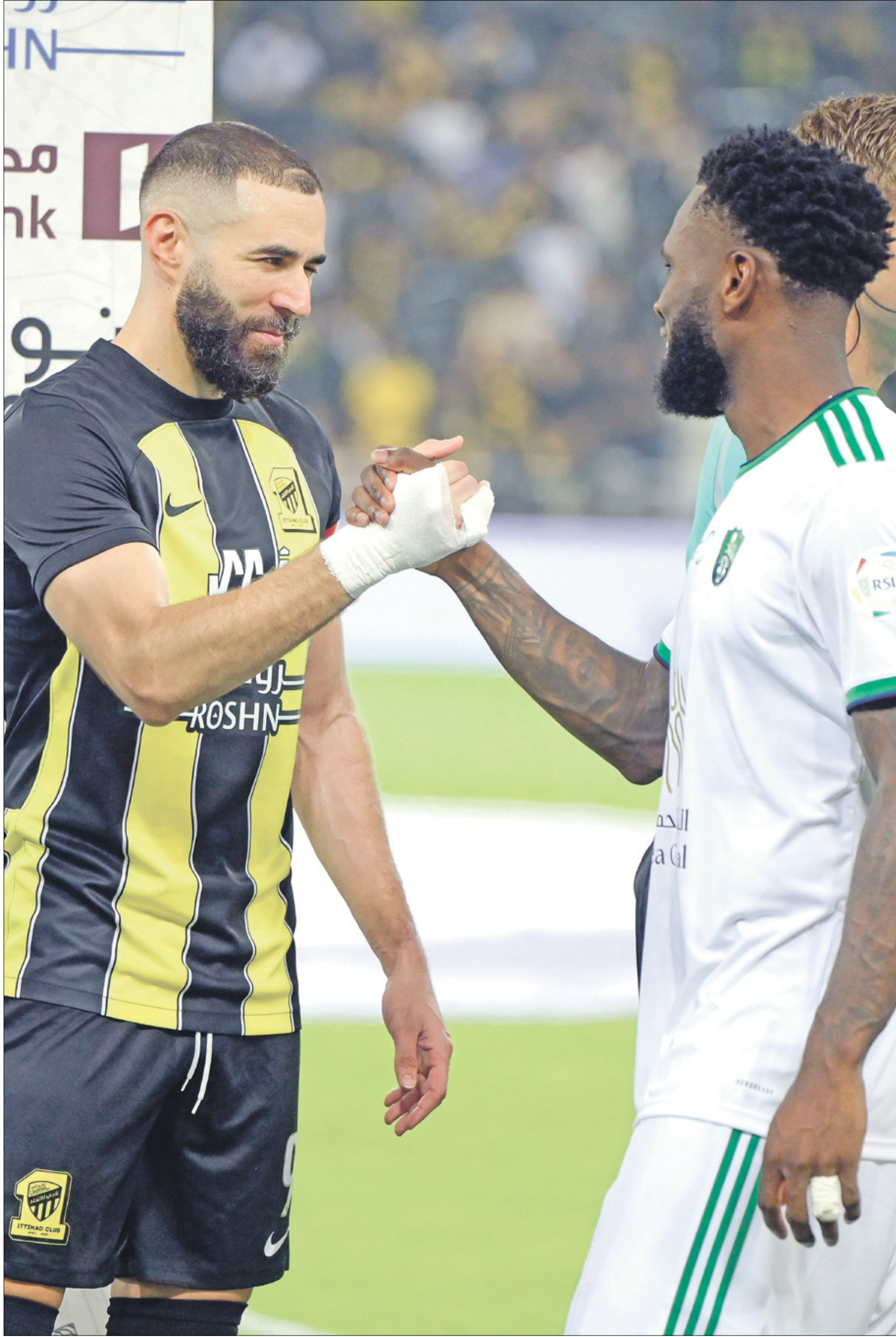
الفرقان يهتفان لاعبين مميزين قادرين على صناعة الفارق

تتجه الأنظار، الأثنين، إلى ملعب «مدينة الملك عبد الله الرياضية» الذي سيكون مسرحاً لديربي جدة الساخن بين الأهلي ثالث الدوري السعودي والاتحاد الرابع وحامل اللقب. ويسعى الأهلي إلى تصحيح مساره عقب الخسارة أمام النصر والتعادل مع الاتفاق في المرحلتين الأخيرتين، ما سمح لجاره بتقليص الفارق بينهما إلى نقطتين بعد فوزه في 3 مباريات متتالية. وكان الأهلي حسم ديربي الذهاب بهدف وحيد سجله الإيفواري فرانك كيسييه.