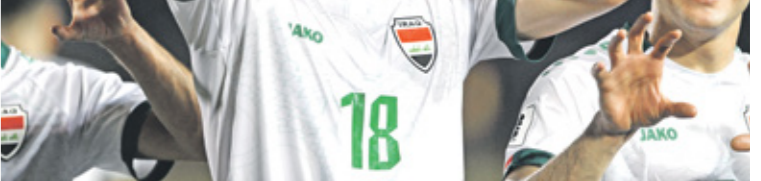
قدم الصراف اداءً مميزاً في التصفيات

آسيا 2027 في السعودية. جاء ذلك في ختام مباريات الجولة الرابعة من الدور الثاني في التصفيات الآسيوية المشتركة لكأس العالم 2026 وكأس آسيا 2027 في السعودية. وفي الآن 12 مقعداً سوف يتم حسنها من خلال إقامة مباريات الجولةين الخامسة والسادسة في شهر حزيران/