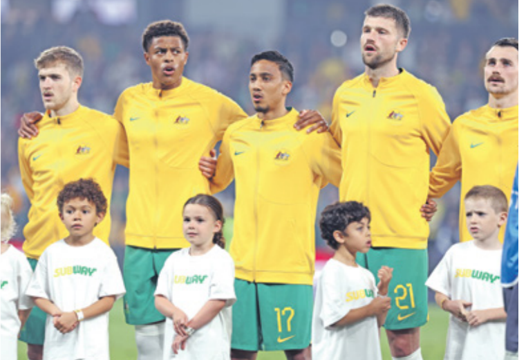
ضمّت منتخب أستراليا التاهة عن المجموعة التاسعة

ومضمت منتخبات قطر بحللة كأس آسيا 2023، وإيران وأوزبكستان والعراق والإمارات وأستراليا الحصول على أحد المركزين الأول أو الثاني في مجموعتها، ومن ثم التقدم إلى الدور الثالث من تصفيات كأس العالم وكذلك التأهل إلى كأس آسيا 2027 فقد نجح منتخب قطر في مواصلة التراجع على صدارة المجموعة الأولى، بعدما حصد الفوز الرابع على التوالي، ليرفع رصيده إلى 12 نقطة، متقدماً بفارق 8 نقاط أمام الهند وأفغانستان. في المقابل وصلت إيران وأوزبكستان فرض تطوقهما في المجموعة الخامسة، بعدما وصل رصيد كل منهما إلى 10 نقاط من أربع مباريات، وذلك من ثلاثة انتصارات مقابل التعادل في المواجهة التي جمعت بينهما. منتخب العراق من جهته حصد الفوز الرابع على التوالي في المجموعة السادسة، ليؤكد تفوقه عبر التقدم بفارق 5 نقاط أمام نونديسيا الثانية و9 نقاط أمام فيتنام التي تحتل المركز الثالث، كما وأصل منتخب الإمارات تفوقه في المجموعة الثامنة بعدما حصد انتصاره الرابع، ليرفع رصيده إلى 12 نقطة، بفارق 3 نقاط أمام البحرين الثانية و9 نقاط أمام اليمن الثالث، وأخيراً ضمن منتخب أستراليا التأهل عن المجموعة التاسعة بعد تحقيق انتصارين متتاليين أمام لبنان ليرفع رصيده إلى 12 نقطة، بفارق 5 نقاط أمام فلسطين الثانية و10 نقاط أمام لبنان صاحب المركز الثالث.