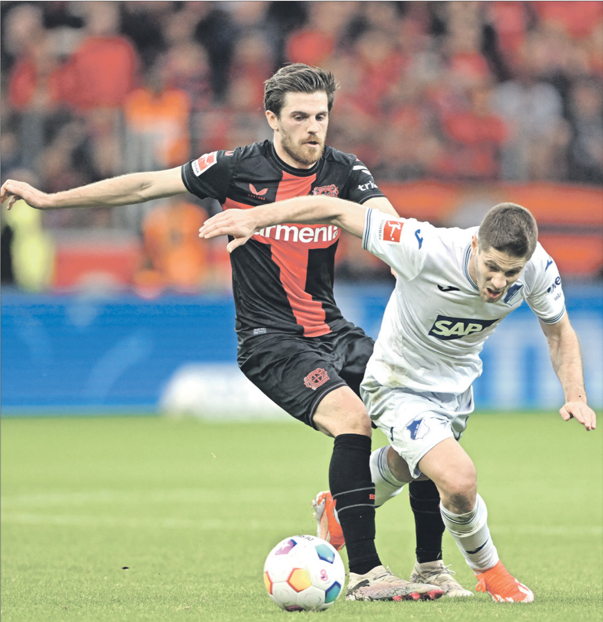
لرييؤخ ليفركوزن يلعب البوندسليغا سابقاً (أيا فاستنتر، فانس برلين)

ضيفه ماينتختن. وقاد رالف هاستهوتل فريقه فوفلسبورغ في أول مباراة له معه في دكة المدربين إلى الفوز على ضيفه فيردر بريمن المنقوص 0-2. وخاض بريمن الضعيف، من المراكز الأوروبية بفوزه على ضيفه بوروسيا مونشنغلادباخ 0-3، في حين تعادل اينتراخت فرانكفورت من دون أهداف مع ضيفه أونيون برلين.