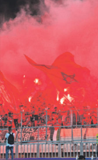
برناكي سيجاول إعادة الوداد إلى مكانه الطبيعي

وتابع المصدر نفسه بأن تعاقبات جديدة، وسكوتون لاعبين مميزين، سيكون زمة تيطاً بيسدي مستحقات مالية عاقلّة وتسوية بعض مشاكل الجاهدين المتهمّل في الحفاظ على قوة الفريق في الاستحقاقات القادمة المحلية والقارية والدولية، خصوصاً مع مشاركة الوداد في بطولة كأس العالم للأندية 2025 في الولايات المتحدة. وسيعمل الوداد الرياضي جاهداً للمنافسة على جميع الألقاب في الموسم المقبل، بعدما اقترب من الخروج خالي الوفاض هذا الموسم، ولن يتحقق ذلك إلا بتدعيم صفوفه بلاعبين لهم قيمة كبيرة، وترابط جميع ركائزه في محاولة إنجاز المشروع الرياضي الذي طرحه الرئيس الجديد. كما أشار برناكي بعد انتخابه رئيساً لنادي الوداد إلى أنّه سيعمل جاهداً للحفاظ على ظهور الفريق المميز قارباً وعالمياً، وأيضاً العودة به إلى مكانه المحسّن، سواء إدارياً أم رياضياً، وقال برناكي: «نتنظرنا استحقاقات كبيرة، ونادي الوداد الرياضي لن يديره شخصان أو 3، وعلية مطلب من جميع الوداديين ترك الصراعات جانباً، والعمل كجسد واحد من أجل تحقيق الهدف المطلوب». يُذكر أن الوداد حقق لقب الدوري 22 مرة خلال تاريخه وهو رقم قياسي، في حين تُوج ب3 ألقاب في دوري أبطال أفريقيا.