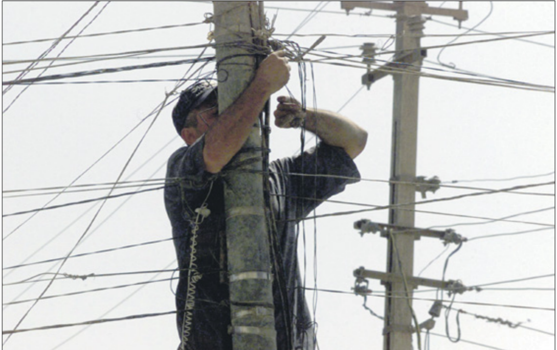
يعداد لجنة أزمة الكهرباء عبر الأسلاك من حول الجوار صباح جمرا

والتي ستعزز أمن الإمدادات الكهربائية في الجانبين، والذي سيكون جزءاً رئيسياً من السوق العربية المشتركة للطاقة مستقبلاً. ولفت إلى أنه مع تطور مراحل الربط على المدى المتوسط، يمكن أن تصل قدرة التزويد إلى 500 ميغاواط.