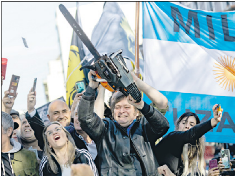
ملهى ليلي في تل أبيب، إسرائيل، خلال الاحتفالات بعيد التحرير

وبحجة التقشف الاقتصادي أيضاً تريد حكومة ميلي إيلان المعهد الحكومي «إنداء» التخصصي بالعمل ضد التمييز وحماية حقوق المرأة وتعزيز الحقوق الجنسانية، ما يطرح أسئلة جوهرية عما يريده الرجل في ذلك في بعض المؤسسات الحكومية. وسط غياب البقن الشعبي بما يحمله لهم المستقل، ومع أن الرجل أبقى على وزارات تقليل المناصب الإدارية، وبالتالي توفير جزء من الإنفاق الحكومي على الرواتب العامة.