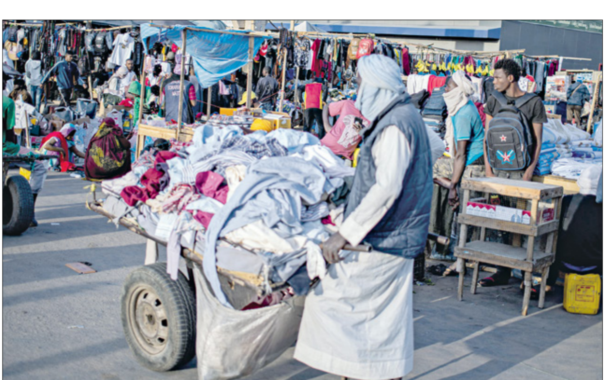
الغاز فرصة للإقلاع الاقتصادي وحل المرات الصعبة

الحجري المشترك مع السنغال، ويصل الإنتاج السنوي من حقل أحميد الكبير إلى 2,5 مليون طن من الغاز لسال سنويا، وسط توقعات متفائلة بان يتشكل إنتاج الغاز الموريتاني فرصة كبيرة للإقلاع الاقتصادي في بلد يعاني من ارتفاع مستويات الفقر والبطالة