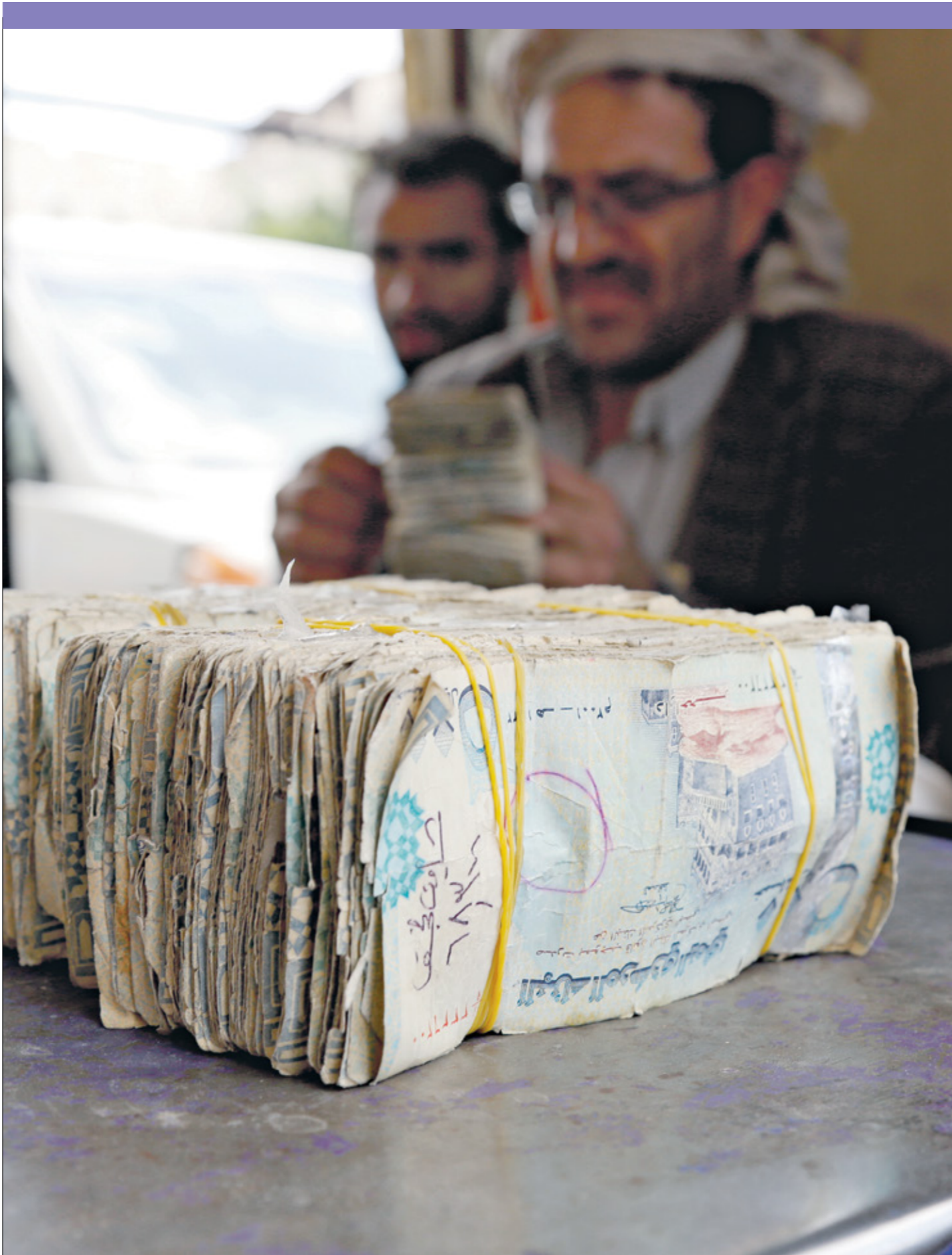
لثم فحيمات كبيرة من العملات الورقية

تقدّر احتياطيات الحقل المشترك بين موريتانيا والسنغال بـ25 تريليون متر