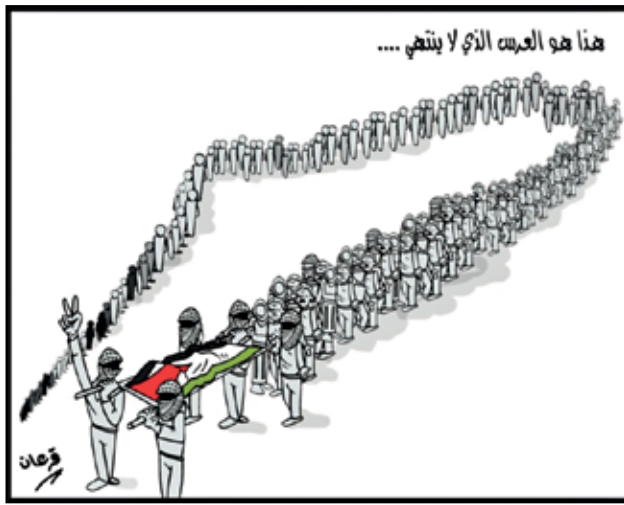
شهداء فلسطينية تضحية مستمرة