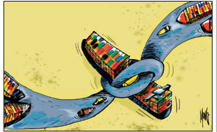
قناة السويس وعقدة السفينة العالقة (رامون بانيز/كار تون موفمنت)