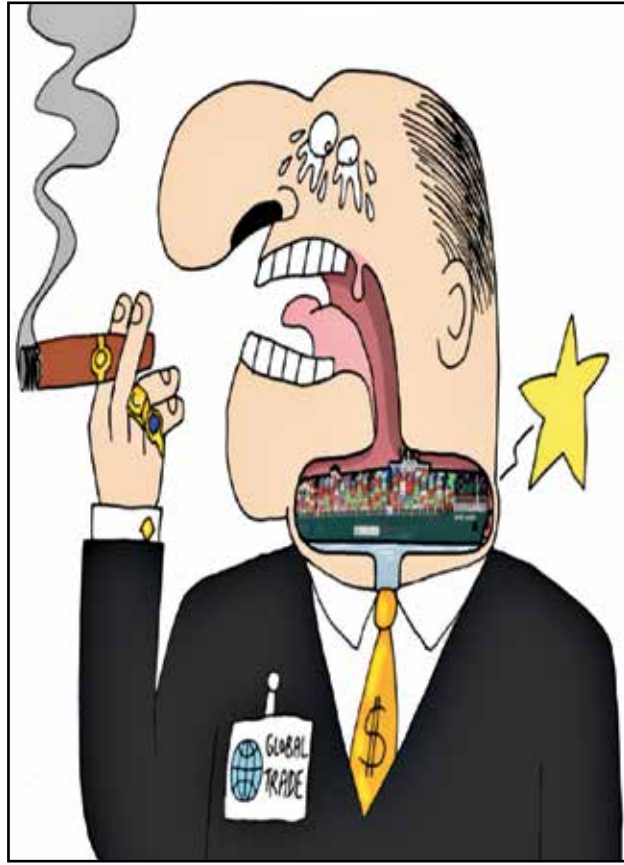
التجارة تختف بسفينة عالقة (ستيغان بيراي/كار تون موفمنت)

كانت لحادث جنوح سفينة الشحن «إيفر غيفن» في قناة السويس ردود فعل كثيرة، وأثار سياسية واقتصادية، من مختلف أنحاء العالم، بينها كانت آراء الساخرين في أكثر من بلد وفي أكثر من مستوى، فقد حفلت منصات التواصل عالمياً بالعديد من الصور والتعليقات الساخرة، وكان لرسمي الكاريكاتير أيضاً نصيب في تناول هذا الحادث البحري النادر، إليك هنا أيضاً من فيض كاريكاتيري حول سفينة السويس العالقة.