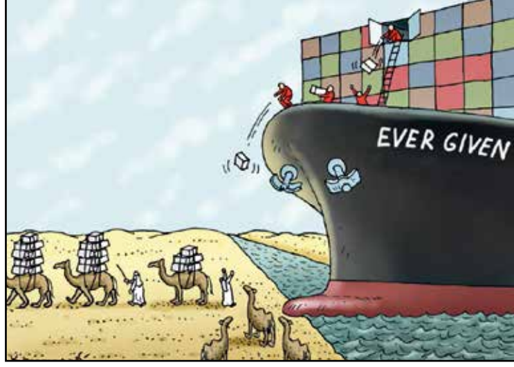
العودة إلى قوافل الجمال (ماريان كمنسكي/كار تون موفمنت)

لم يستطع فرج أن يجيب، فقد دوت عاصفة التصفيق مرة أخرى.