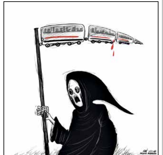
فاجعة اصطدام القطارات في مصر