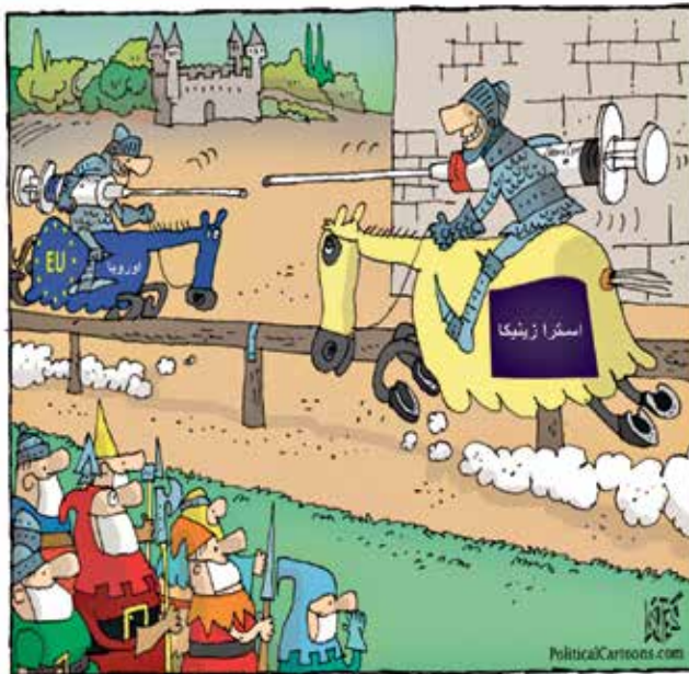
(بيكولا ليسانس/ كيغك كار تونز)