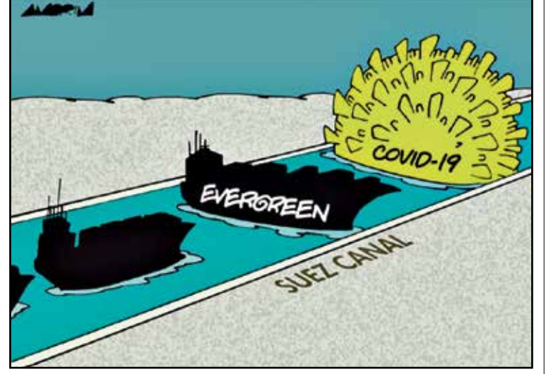
الكورونا قبل السفينة علقت واعاقت العالم (أموريم/كار تون موفمنت)