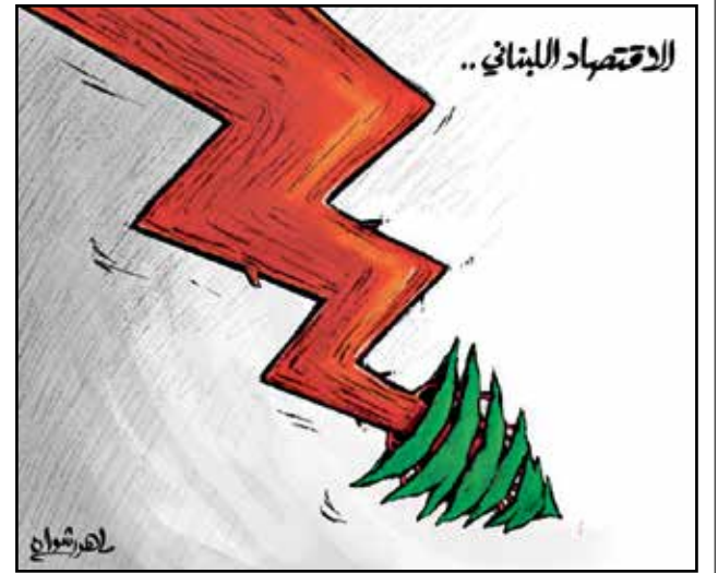
الاقتصاد اللبناني في ترح مستمر