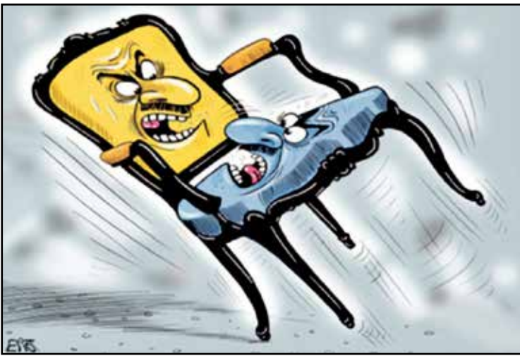
صراع كراسي السلطة المدمر