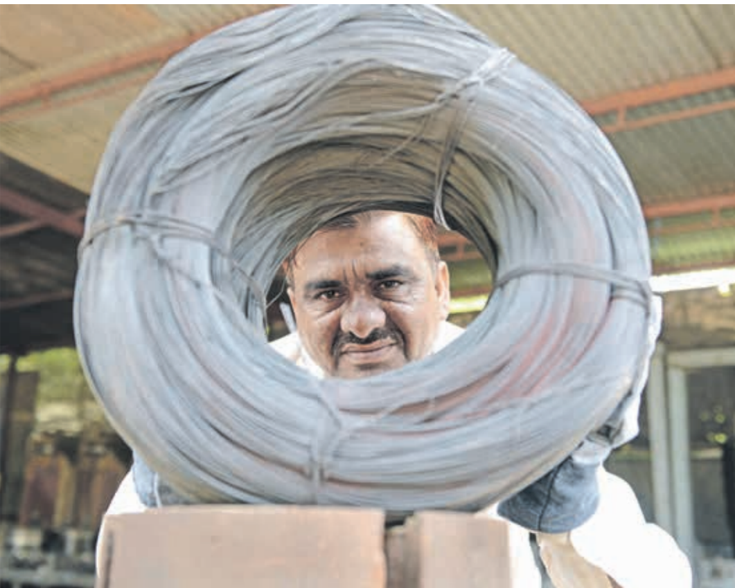
لهديدات يفرض حديد من رسوم الإغراق (سام بلانكين/ماتس رس)