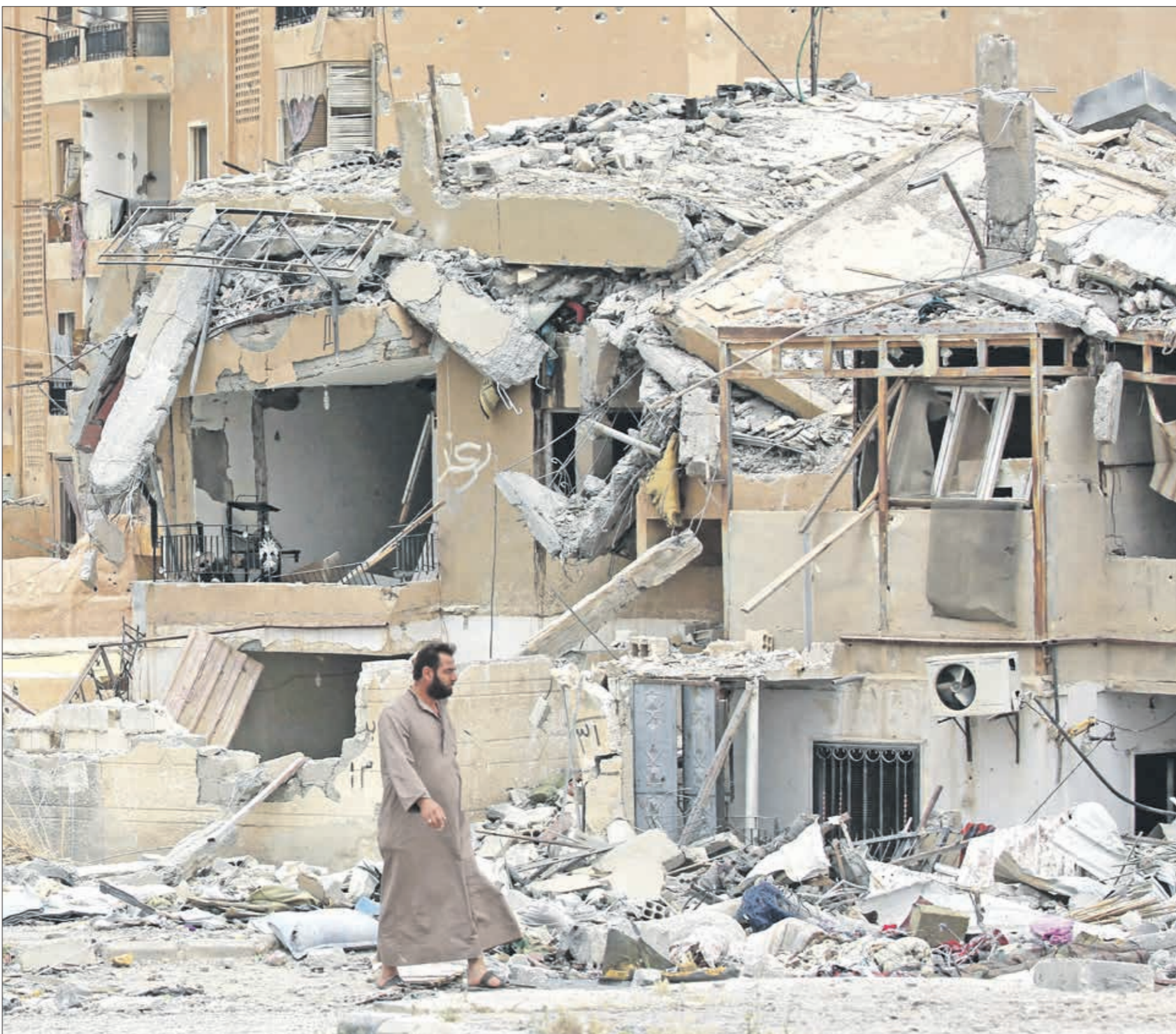
تخرب روسيا أسلحتها على الشعب السوري