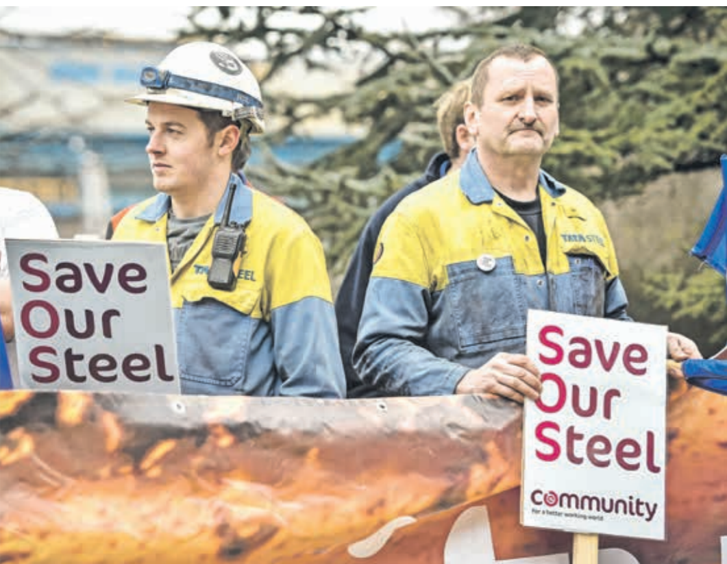
تخلت بريطانيا عن الألف من عمال مصانع الصلب

لا يزال إنتاج الصلب يثير أزمة داخل قطاعات الصناعة الأوروبية والأميركية بسبب إغراق المعدن الصيني أسواق هذه البلدان رغم الإجراءات الحمائية التي تتخذ ضد هذه المستشارة الألمانية أنجيلا ميركل، أمس الأحد، إن من المهم التمسك بالوعد النهائي الجريئة لمعالجة قضية الطاقات الإنتاجية الزائدة في سوق الصلب العالمية، وإلا فإن الولايات المتحدة قد تلجأ إلى عمل منفرد من خلال فرض غرامات أو تعريفات جمركية. وحذ الزعماء الأوروبيون والأميركيون الصين على التعجيل بخفض الطاقة الزائدة، وعزوا هبوط الأسعار إلى صادراتها الكبيرة، واتهموها بإغراق الأسواق الأجنبية بصلب رخيص الثمن. وأضافت ميركل أن زعماء من مجموعة العشرين حدوا أغسطس/آب موعداً نهائياً لقيام منديي عالمي ترأسه منظمة التعاون الاقتصادي والتنمية بجمع معلومات عن المشكلة، مع تقديم تقرير شامل بشأن الحلول المحتملة بحلول نوفمبر/تشرين الثاني. وقالت