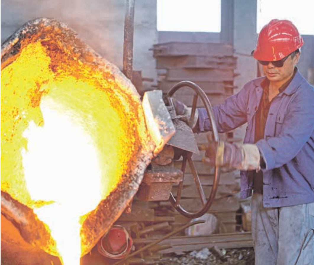
الصلب الصيني يُعزف السبواً