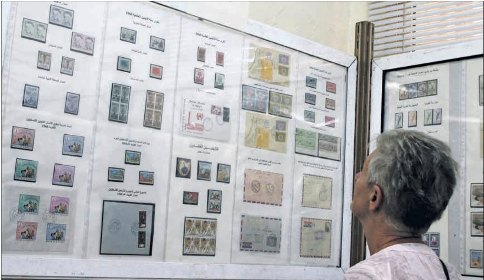
واجهة من معرض الطوابع البريدية الفلسطينية في العاصمة الأردنية عمّان

2017 طابعاً بريدياً تؤرخ للقضية الفلسطينية، في معرض جامع الطوابع الأردني جليل طنّوس، في مقر جمعية هواة الطوابع والعملات الأردنية في عمّان. لحظة نضال وتعزيز الأمل لتحرير الأرض من المحتل