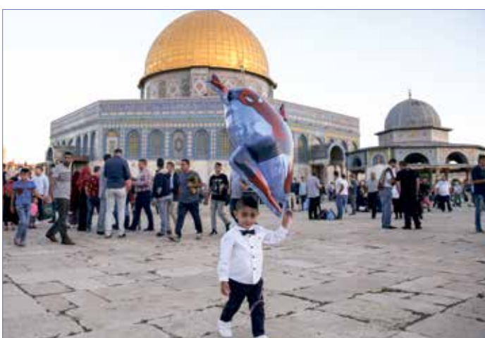
طفلة فلسطينية يلهو في باحة امام مسجد فية الصخرة