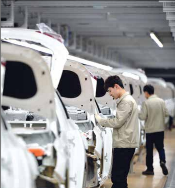
مصنع سيارات هيونداي في الصين

ذكرت أعلى هيئة لمراقبة الجودة في الصين أن شركة بكين هيونداي ستستدعي 43764 سيارة بسبب خلل قد يؤدي إلى فشل محتمل في عمل المحرك. ووفقا لوكالة شينخوا، شغلت مصلحة الدولة لمراقبة الجودة والتفتيش والحجر الصحي أن المركبات المتأثرة هي من نماذج «سانتا في» المجهزة بمحركات ثينا جي دي أي بسعة 2,4 لتر، والتي تم إنتاجها في الفترة ما بين 29 نوفمبر/ تشرين الثاني 2012 و31 مايو/ أيار 2013، فضلا عن محركات ثينا جي دي أي بسعة 2 لتر، والتي تم إنتاجها في الفترة ما بين 29 نوفمبر 2012 و30 نوفمبر 2013. وقال جهاز مراقبة الجودة في الصين كذلك إن شركة فولفو (تاشيانا) المحدودة ستستدعي 595 سيارة بسبب عيوب في أحزمة الأمان. وقالت المصلحة إن عملية الاستدعاء تشمل السيارات المستوردة من طراز اكسي في 90 المصنعة في الفترة ما بين 23 سبتمبر/ أيلول 2016 وة نوفمبر 2016.