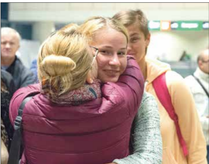
سائحون روس في مطار موسكو بعد حادثة طرم السليخ

كشف مصدر لوكالة «فرانس برس» الروسية، أن استئناف الطيران بين روسيا ومصر «مستحيل» قبل نهاية الصيف. وأتهم المصدر الجانب المصري بتحمل مسؤولية التأخير بقوله: «إن الجانب المصري منذ الربيع لا يبدي أي مبادرة للحوار مع موسكو حول مواصلة الخبراء الروس تفتيش المطارات المحلية والتأكد من أمن صالات الركاب». وحسب المصدر، فإنه «بعد إجراء عملية التفتيش الأخيرة من قبل الخبراء الروس، كان لديهم عدد من الملاحظات حول عمل أمن المطارات المصرية. ودون اختبارات إضافية، لا يمكن استئناف الرحلات الجوية بين البلدين». ولاستعادة نشاط الطيران، برأي المصدر، يجب تنفيذ عدة إجراءات «أولا، على اللجنة التي تقوم بزيارة المطارات المصرية. أعاد تقرير وتقديمه إلى الجهات الحكومية الروسية المعنية، ثم رفعه إلى أكثر من جهة قضائية لتدقيقه. وفي حال إزالة القيود المفروضة، يمكن لشركات الطيران بيع التذاكر واستئناف رحلاتها الجوية على الفور».