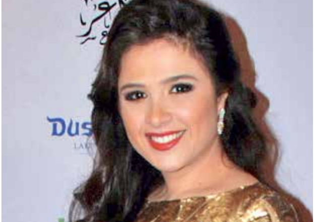
دالما بالزمن، الخوف فيه أمر تجربة عمل جديدة

فنانة مصرية استطاعت أن تحلّل الحلقات المملقة، منذ سنوات، بمخطة الكوميديا، والتي قليلاً ما تتمعز فيها الفنانة بعد احتلال الفنانين الرجال لهذه المخطفة بشكل كبير، لكنها أصرت وتحدثهم، واستطاعت بالفعل أن تنتج، وأن يكون لها جمهورها الذي ينتظر أفلامها. ركّزت على السينما طيلة السنوات الماضية، ورفضت الكثير من العروض التلفزيونية، وكان آخر عمل قدمته عام 2003 وهو الرقص على السلالم المتحركة. وعادت في شهر رمضان بعد كل هذا الغياب بمسلسل «هربانة منها». «العربي الجديد»