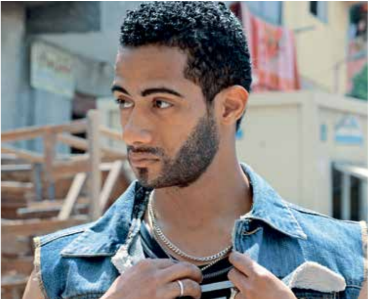
يملك محمد رمضان دور البطولة في فيلم «جواب اعتقال»