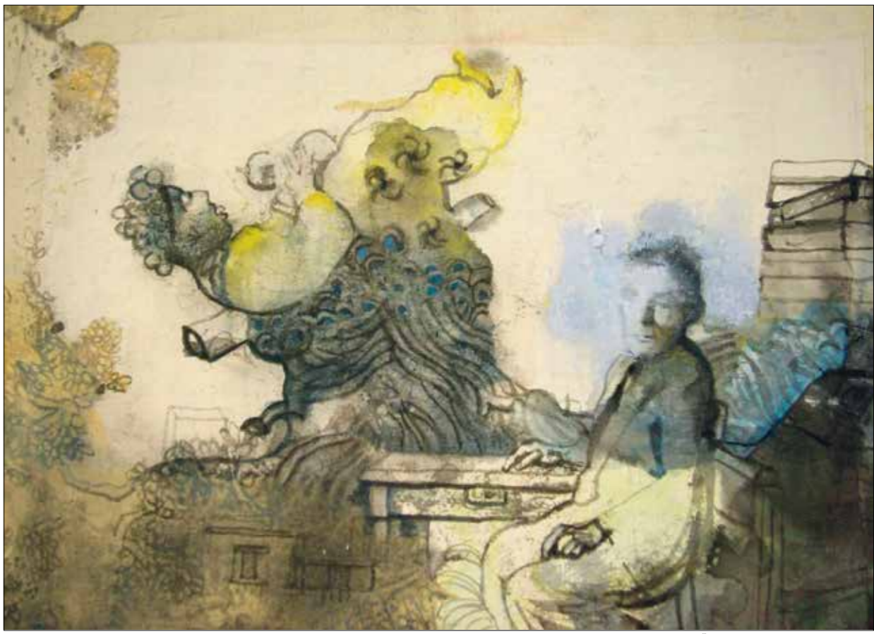
«صبي النظار البرابرة»، ماريا جيناكاي، إيطاليا

في مركز الربع الثقافي بالقاهرة، يحيي فريخ فلامنكا ، امسية موسيقية الخميس المقبل عند السابعة والنصف مساء. ويقدم الفريخ، والذي تأسس عام 2001، بقيادة الموسيقي وانك خض ، موسيقى الاتية تتدج بين إيقاعات الفلامنكو الإسبانية و«الراب» المغاربية والموسيقى العربية الشرقية.