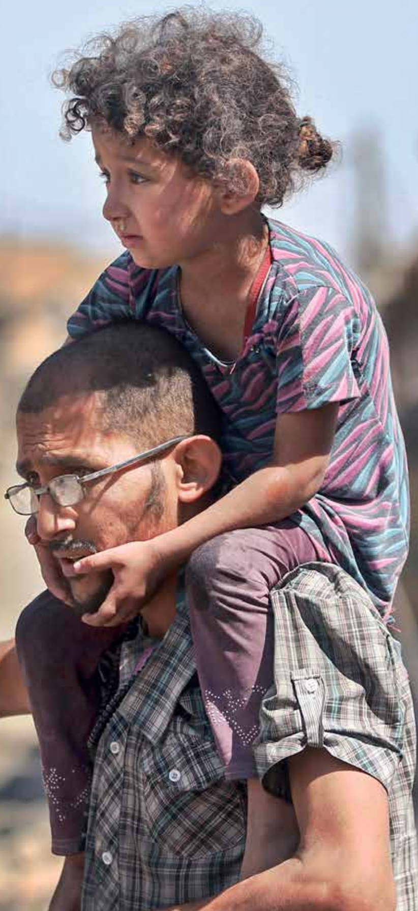
مئات إلى المئات وسط الدمار