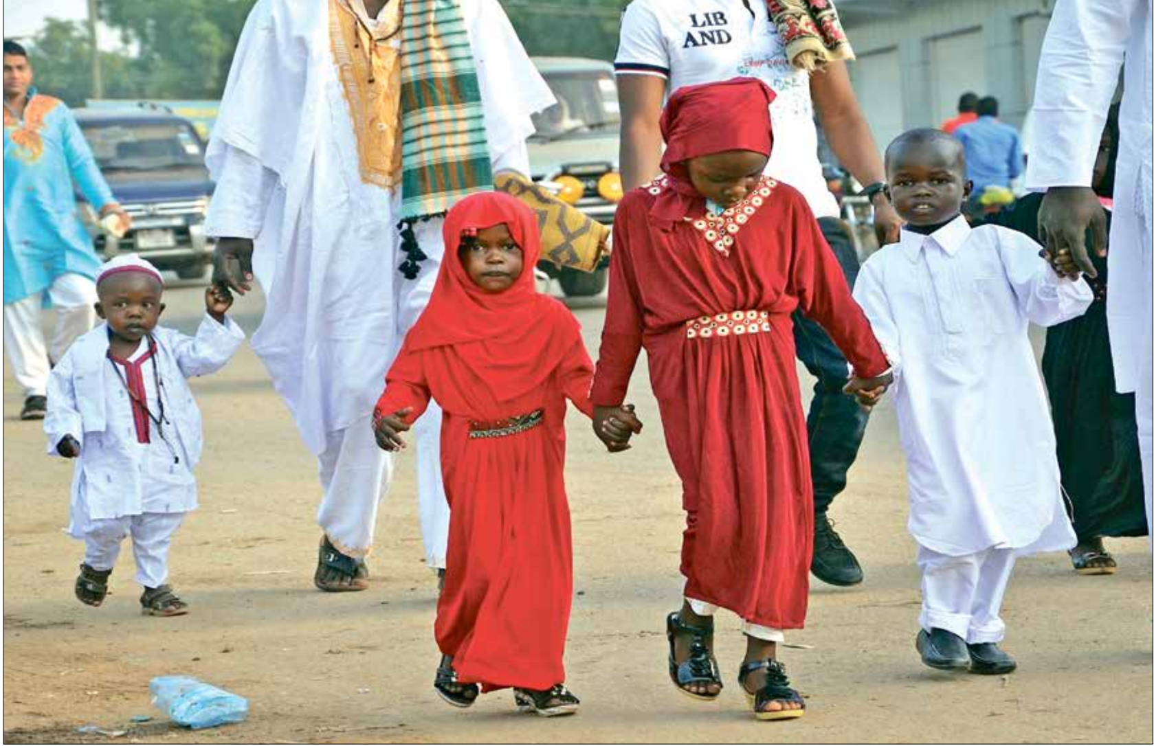
تبادل الزيارات وفرحة للأطفال (الأنطول)

يشكّل عيد الفطر مناسبة اجتماعية مهمة للسودانيين، فهو فرصة للتلاقي وتبادل الزيارات بين الأهل والأقارب، إذ تكثُر الجلسات بعد انقطاع دام لأشهر