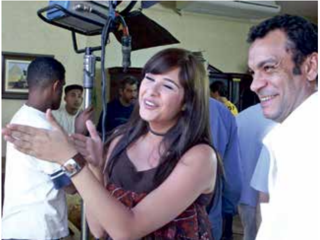
الوصول لفنون الأطفال شيء صعب للغاية