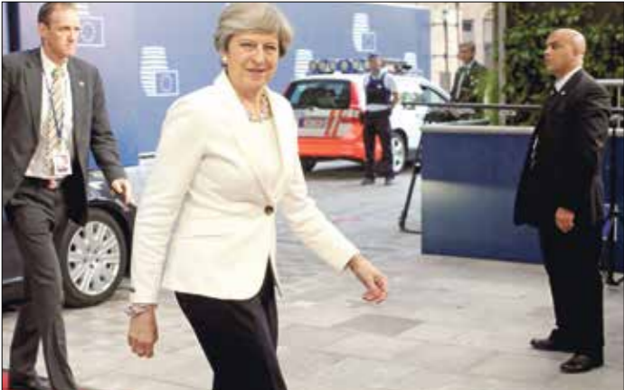
رئيسة الوزراء البريطانية ماي في بروكسل

قالت بريطانيا إنها ستواصل تطبيق دخول السلع الواردة من نحو 50 دولة نامية، من بينها بنغلادش وسريلان وبهايتي، إلى الأسواق البريطانية بلا جمارك بعد خروجها من الاتحاد الأوروبي. وقالت الحكومة إن نحو 48 دولة ستواصل الاستفادة من التصدير المعفى من الجمارك بالنسبة لكل السلع باستثناء الأسلحة والذخائر إلى الأسواق البريطانية. وأنها فور انسحابها من الاتحاد الأوروبي في 2019 ستسمح بخيارات توسيع العلاقات التجارية بشكل أكبر. وقال وزير التجارة الدولية ليام فوكس، في بيان: إن «انسحابنا من الاتحاد الأوروبي فرصة لتعزيز التزاماتنا لعقبة الدول وليس التراجع عنها». وحسب وكالة رويترز، أضاف فوكس «التجارة الحرة والتزينة هي أكبر منفذ لفقر العالم، وإعلان اليوم يثبت التزامنا بمساعدة الدول النامية على تنمية اقتصادياتها وتقليص الفقر من خلال التجارة».