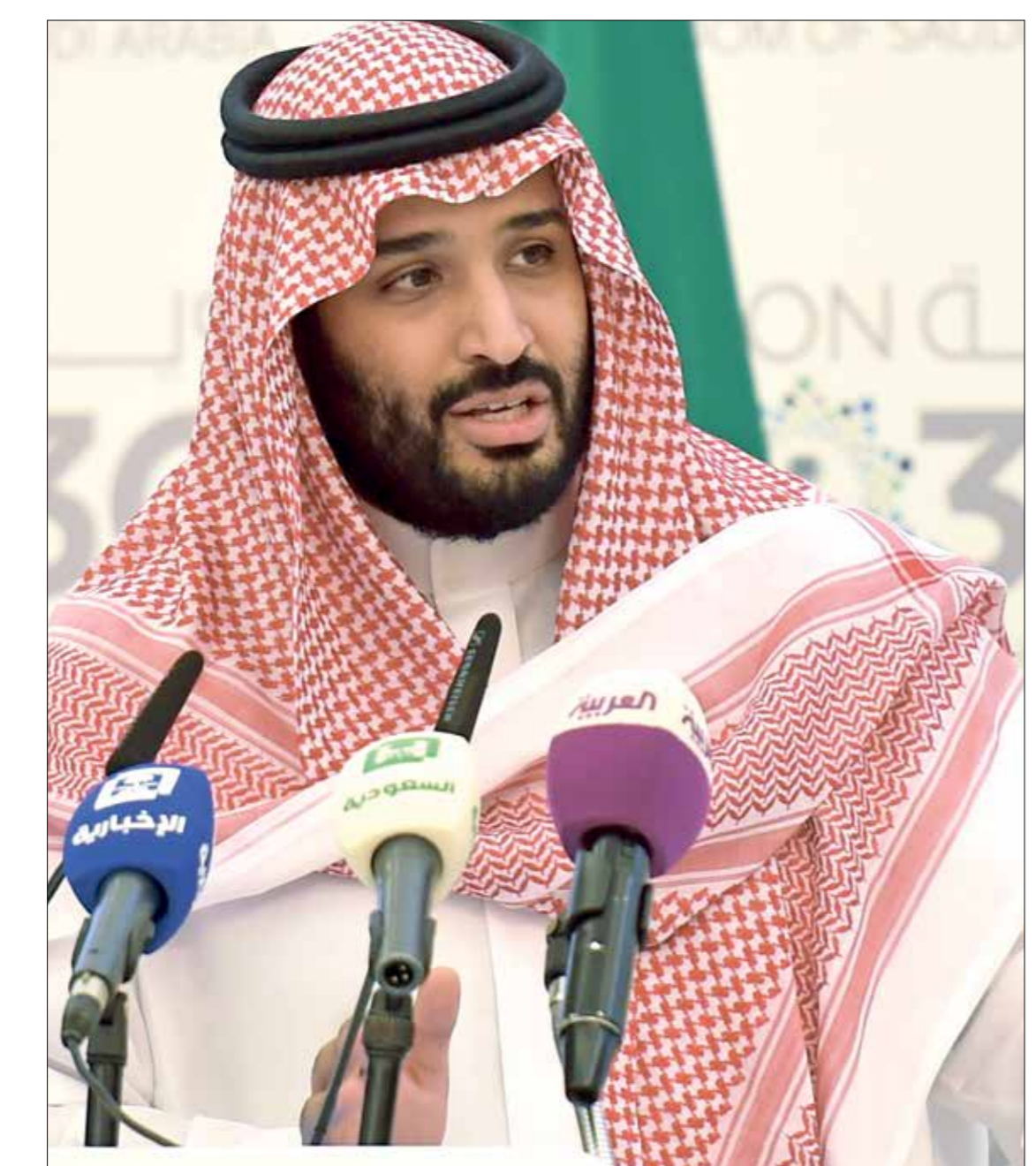
الصربية من أبرز أذرع بن سلمان

«إم بي سي» خلال الأسبوع الماضي، من خلال جميع قنواتها، حتى الدراميّة منها، بنشر شريط دعائي مصور من عدة دقائق، يقول شعراً في بن سلمان، ويعرض أجزاء من مقابلاته الأخيرة مع داود الشريان ويصوره ك«مهندس الرؤية السعودية وقائد التحالفات»، ويمتلك ويدير محمد بن سلمان عدداً من الصحف