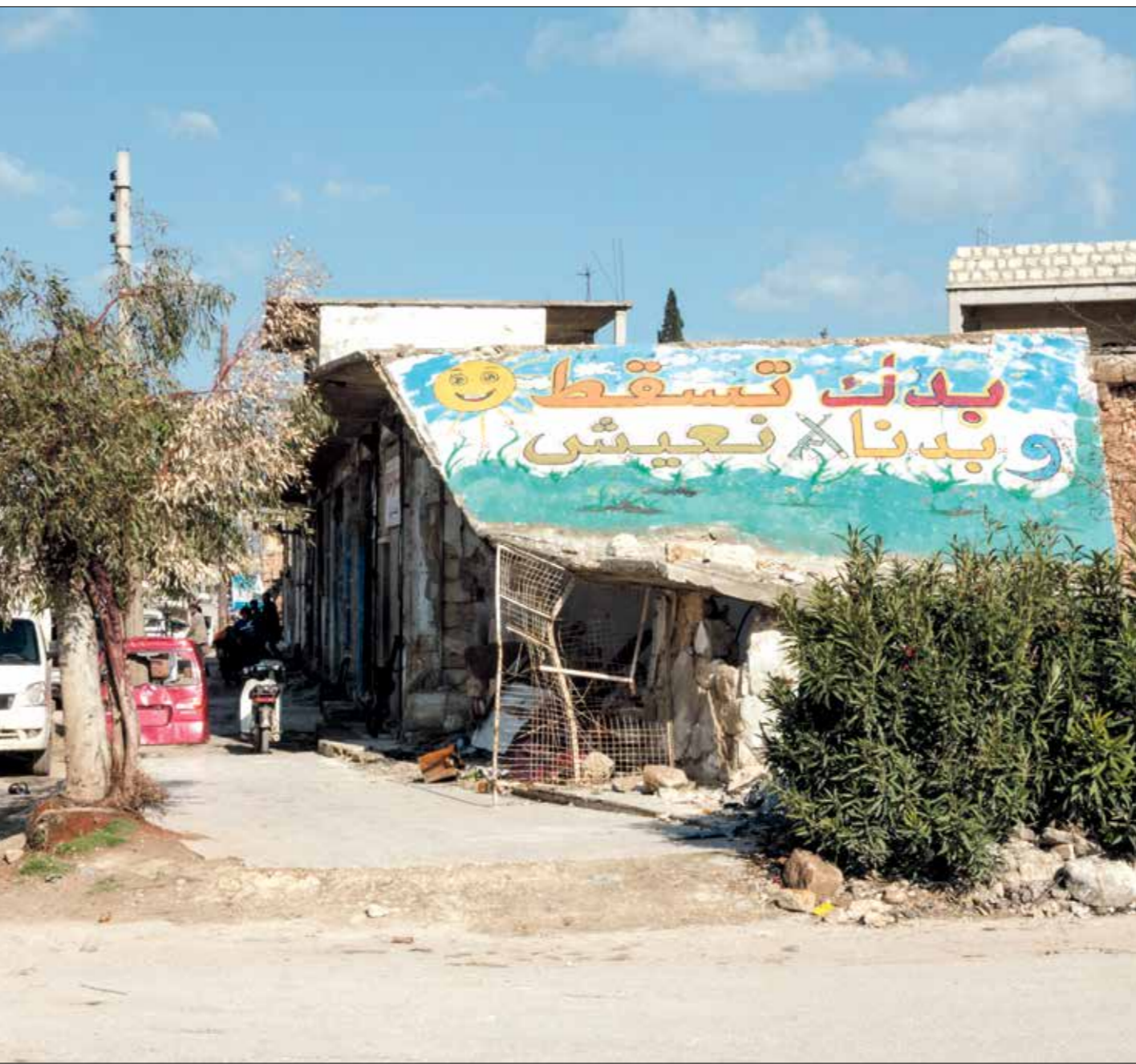
تم رسومات عزير الأسمر

الجداريات السورية ليست استثناء عربياً، فجاء المحدث العربية طاولها بلأ من موجة الجرافيتي، لقد كان حراك 2011 فيه أكثر من بلد نقطة التقاء بين الأساطع مساحة الحريات من جهة، وسلبات عولمة من جهة من الجرافيتي ثقافة عابرة للثقافات، ليصبح أداة توثيق عفوية للتطلعات الشعبية، حيث ان جرح القاطنين التونسي قبس سعيد حيث سلك عن سبب عدم الارتياح الإيضاح لاحتشاور 2014، قال «مت وضموه لم يقرأوا ما كتبه الشباب على الجدران».