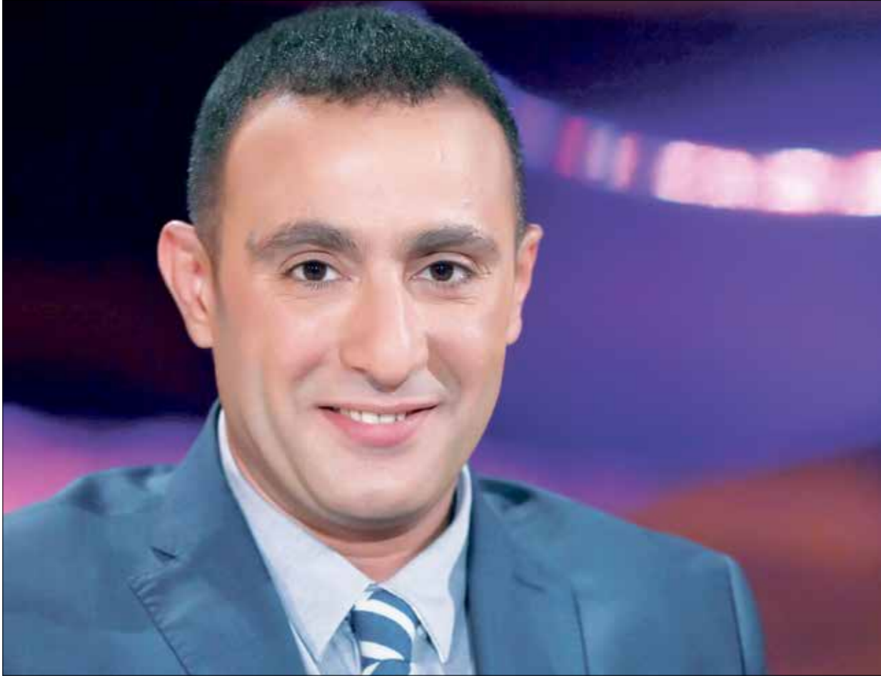
للمرة الثالثة على التوالي يخوض أحمد السقا، مغامرة الدراما التلفزيونية