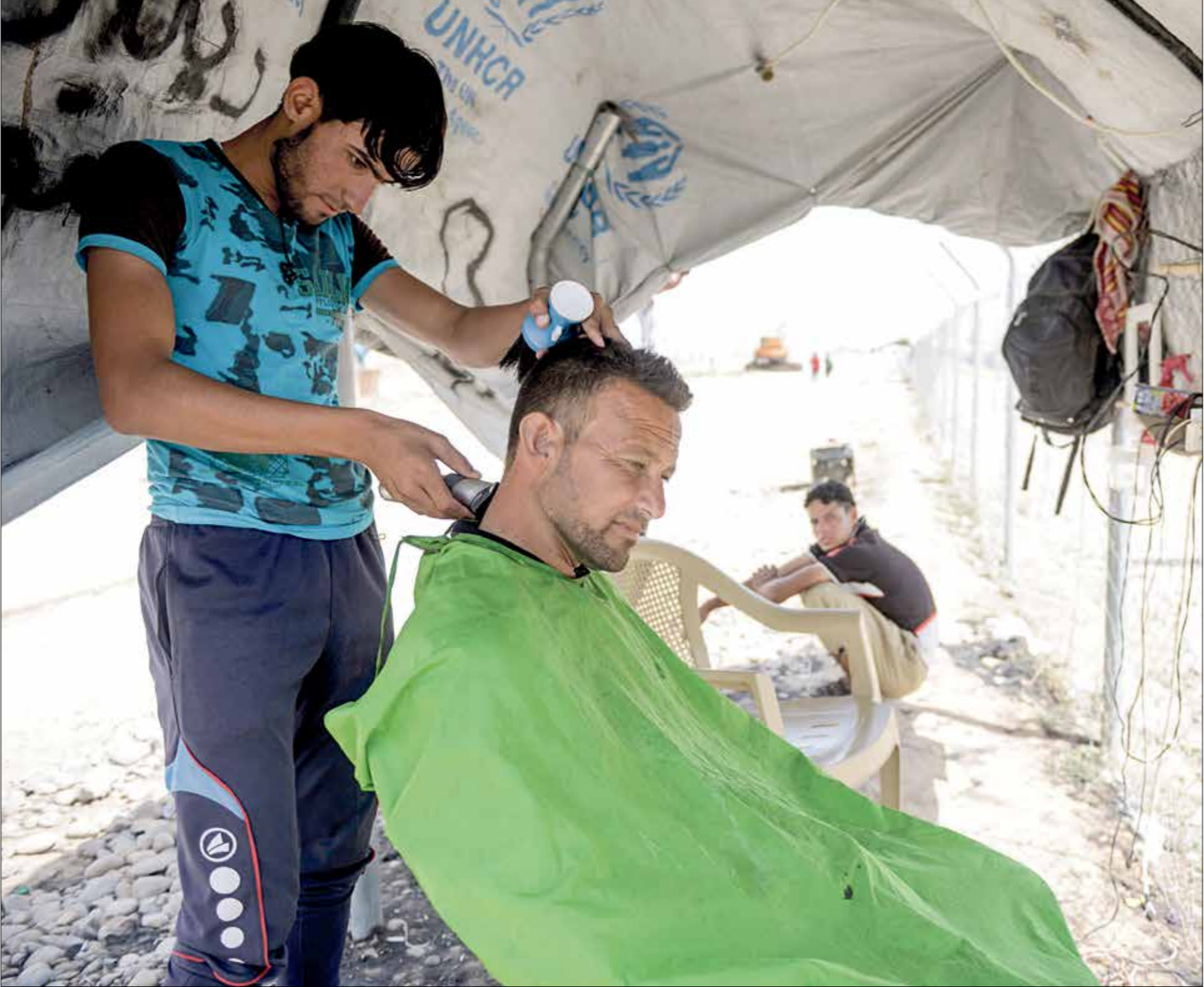
كبار من أهالي المدن المحررة يعضون اليافء في خيم الصراة، لأن بلداهم غير صالحة للحياة

ويات تقاسم حركة «داعش» إحدى العقد الأساسية في إعادة تموضع المحاور السابقة، ويعد محاولات عديدة من قبل النظام السوري والمليشيات ذات الولاء الإيراني بالتقدم باتجاه معبر الخنق مع العراق والذي تسيطر عليه قوات مدعومة من قبل المحور السعودي الإماراتي بدعم أمريكي. يبدو أن مساء يوم الأحد كان فارقاً لناحية وصول التصعيد بين المحورين إلى أوجه، وبينما كان النظام السوري برهقة قوات تابعة لحزب الله اللبناني يحاول التقدم جنوب منطقة الطفيفة الضائعة بسيطرة قوات سورية الديمقراطية التي تقودها قوات حزب الاتحاد الديمقراطي (الجناح السوري للعمال الكردستاني) وتتعاون مع قوات النخبة السورية قليلة العدد والتابعة لرئيس الائتلاف السوري السابق، أحمد الجربا، والمدعوم من الإمارات، قام الطهران الأمريكي، بإسقاط طائرة سورية من نوع سوخوي 22، لأول مرة بشكل مباشر، تلاها اشتباكات عنيفة بين قوات سورية الديمقراطية والنظام السوري جنوب مدينة الطفيفة لم تدّض ساعات حتى قامت طهران باستعراض واضح للنفوذ، بإطلاق صواريخ باليستية، للمرة الأولى