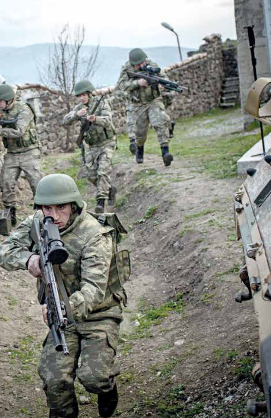
يُزّج نشر قوات تركية في ادلب

غربي حمص، وسط سورية، ومناطق في درعا والقطيفرة. كما تستيطر «قوات سورية الديمقراطية» على مساحات واسعة من الجغرافيا السورية، من غير الواضح بعد ما لها ضمن اتفاق مناطق خفض التوتر. كما لا يزال تنظييع «اعش» يفرض سيطرة على مساحات في شرق سورية تحديدا، حيث يسطر على محافظة دير الزور، وجانب من ريف الرقة الشرقي. ومن المرجح أن تكون المنطقة الرابعة التي ضم درعا وبعض ريف القطيفرة محل خلاف، خصوصا أن الأردن يريد إبعاد عملياتها الإيرانية عن حدود الشمالية نحو 30 كيلومترا، وفقا لصناد مملعة على سير اجتماعات تعقد في ريف حلب بين حزيران روس وأميركيين. فيما يريد النظام السوري وجودا ورمزيا على كامل الحدود السورية الأردنية، خصوصا على معبر نصيب الحدودي.