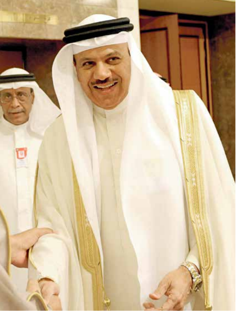
الأمين العام لمجلس التعاون عبد الطيف الزيات،القائد الأكبر منذ بدء الحملة ضد قطر

في الانتقام، انظروا حولكم في شبر من هذا الذي يسمى أمم عربية، صراع في الخليج بين الأشقاء، دماء في ليبيا، دماء في سورية، دماء في العراق، دماء في اليمن، فلسطين، مقدسة، مصر مقدسة، قوسى في المغرب، صراع وخلافات في الجزائر وتونس وليبنان، ويمكن للمشاهد أن يستمر بنفس العناوين في كل البقية. بنسب مختلفة ولكنها نفس الصورة ونفس القامة، ولا تحمل نفس الأمل، لأن الأمل موجود بالرغم من كل هذا، ولا أحد قادر على أن يعيد عجلة التاريخ إلى الوراء ولو لبرهة من الزمن. وفي كل هذه الأوطان تحرك شيء ما في قلوب شبابها، ونخبها على اختلافاتهم السياسية والأيديولوجية، وبدأ الناس يؤمنون بأن هناك ما يمكن تغييره في حياتهم ولا يمكن للأوضاع أن تستمر كما هي عليه اليوم. وفي الانتظار... لا عيد للحرب طالما أنهم متفوقون ويصلون في قلوبهم ضغائن بحجم الجبال، وتتن صدروهم بحلم أن يتكسروا خواتمهم ويخسر أشواقهم ويتكلم للمساءة فيهم، بينما ترضى العرب ونخبه على الصغار، يرغم كل الدمار الذي خلفه فينا، ولكن ماذا تفعل مع العمى والصمم؟