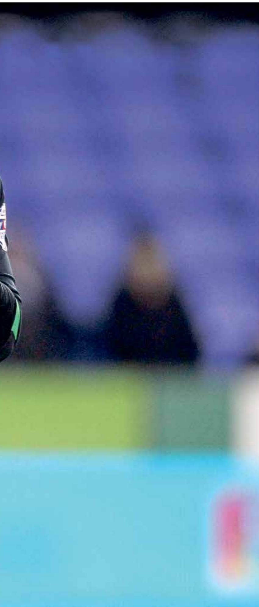
الحسبي واجه النجوم الكبار في الدوري الإنكليزي

وحسب إحصائية أعدتها صحيفة «ماركا» الإسبانية والتي تظهر ترتيب الفرق في مختلف الدوريات الأوروبية، لا تزال أندية الدوري الإنكليزي الممتاز تحقق الأموال الكبيرة على الصفقات وكان آخرها صفقة المصري محمد صلاح إلى ليفربول والتي تعد أعلى صفقة في تاريخ النادي الإنكليزي. وتعاقد نادي هيدرسفيلد تاون الصاعد