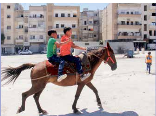
طفلاً سوريان يسلمعان بأجواء العيد في ادلب